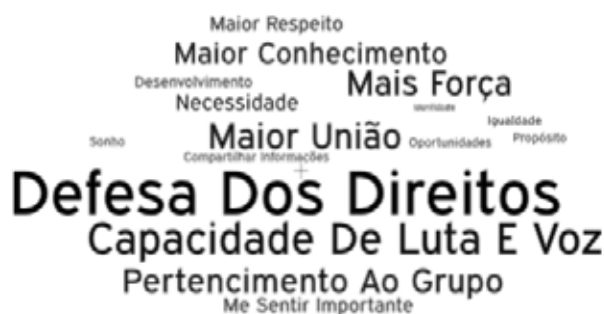
Figura 1 - Nuvem de palavras relativas às justificativas das respostas Sim