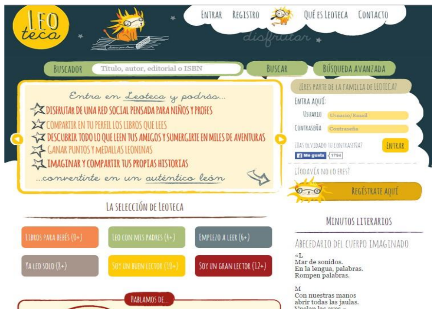
Portada Leoteca https://www.leoteca.es/

Leoteca es un espacio dedicado a la literatura infantil especialmente pensado para la participación de los niños pero en el que los adultos también desempeñan un papel activo. https://www.leoteca.es/leoteca