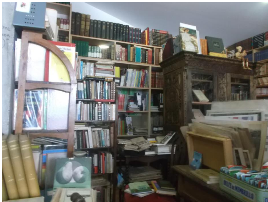
Librería Anticuaria El Laberinto de Córdoba