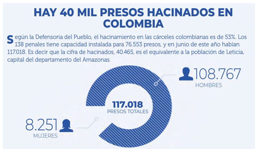
Figura 3. Cárceles y presos en Colombia. Datos del 2018

Así las cosas, son distintos los frentes que están fallando al interior del sistema penitenciario nacional y que, además, no son fallas recientes, sino que vienen acrecentándose sistemáticamente, ya que la mirada de los gobiernos de turnos ha seguido situada en el control, el castigo y el asilamiento como únicas medidas para garantizar la seguridad y la normalidad de la sociedad.