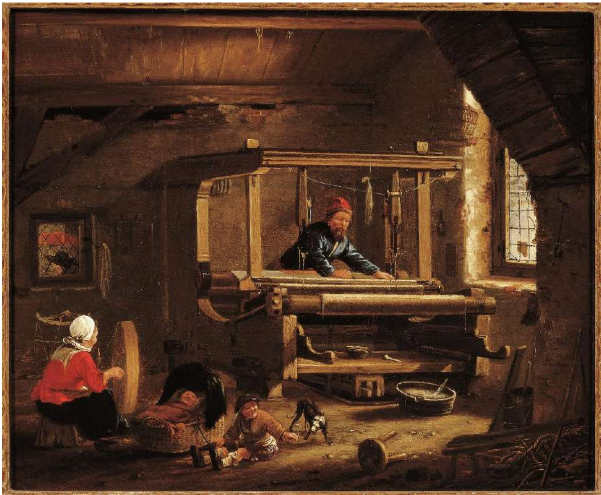
Figura 10. Gillis Salomonsz Rombouts (1631-1672), Taller de tejedores, 1656, Frans Hals Museum (Haarlem).

“La esposa de un maestro agremiado puede llegar a trabajar tanto o más que un oficial, pero, a diferencia de este, sin salario ni posibilidad de impugnar sus condiciones laborales apelando a ordenanza alguna, dado que su trabajo es propiedad del cabeza de familia y por ese motivo solo está sometido a las normas de este, no a las del gremio. La hija de un maestro agremiado puede aprender el oficio tanto mejor que un aprendiz; pero su cualificación será informal y solo le será lícito ejercer bajo el ropaje jurídico del vínculo matrimonial o, si cuenta con recursos suficientes, mediante la contratación de un maestro” 166 .