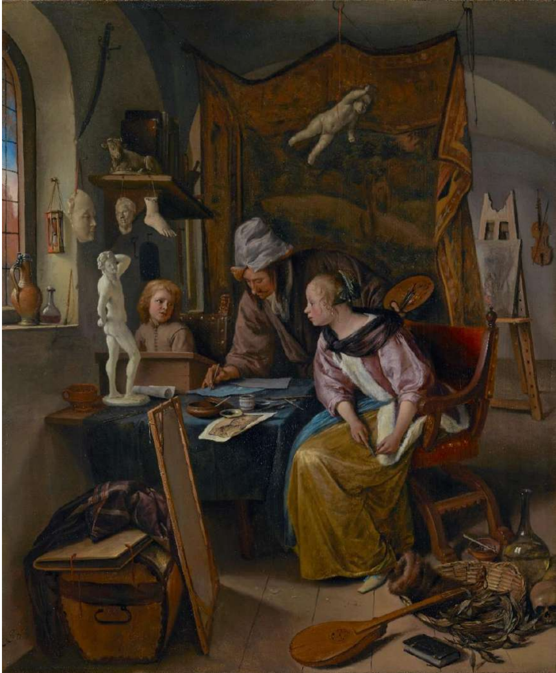
Figura 11. Jan Steen, Lección de dibujo , ha. 1665, The Paul J. Getty Museum (Los Ángeles).

siendo en ocasiones este el mismo taller, pues ellas también tuvieron un fuerte papel como vínculo de transmisión del oficio, como comentaremos—. Así, continuaban ejerciendo la profesión tapadas por la sombra de la “cabeza visible” del hombre al que quedaban vinculadas, que era el que estaba agremiado.