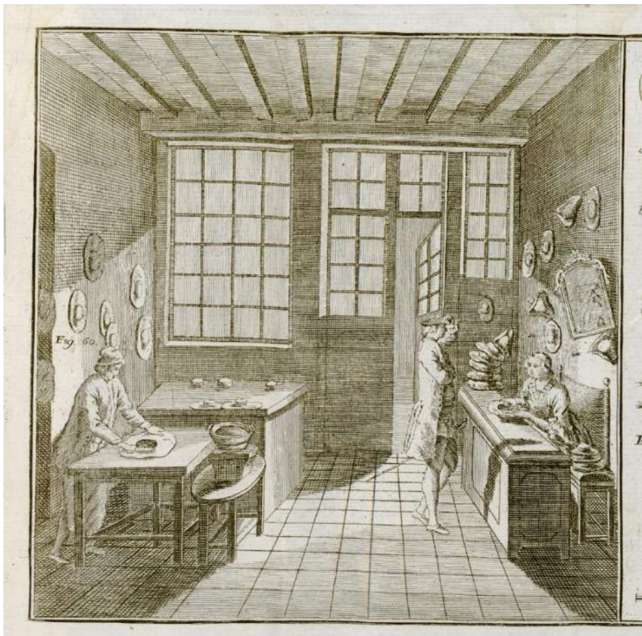
Figura 14. Anónimo, Tienda de un sombrero , en: NOLLET, Abad: Arte de sombrero . En Madrid: Imprenta de Andres Ramirez, [1771[?], BH FLL 10639, Biblioteca Histórica Marqués de Valdecilla (Madrid).

“La Reyna Gobernadora: Por quanto por una parte de vos el gremio de mercaderes de paños de la plaza de la villa de Madrid, nos ha sido hecha relacion, que habeis estado siempre en estilo de poner en vuestras tiendas unos reparos de mantas, para estorbar que la inmundicia que arrojan de los quartos altos y baxos de las casas de la dicha plaza, en invierno y verano los moradores de su acera, donde estais asistiendo en las dichas tiendas con vuestros hijos y mujeres de vuestras mercaderías [...]” 240 .