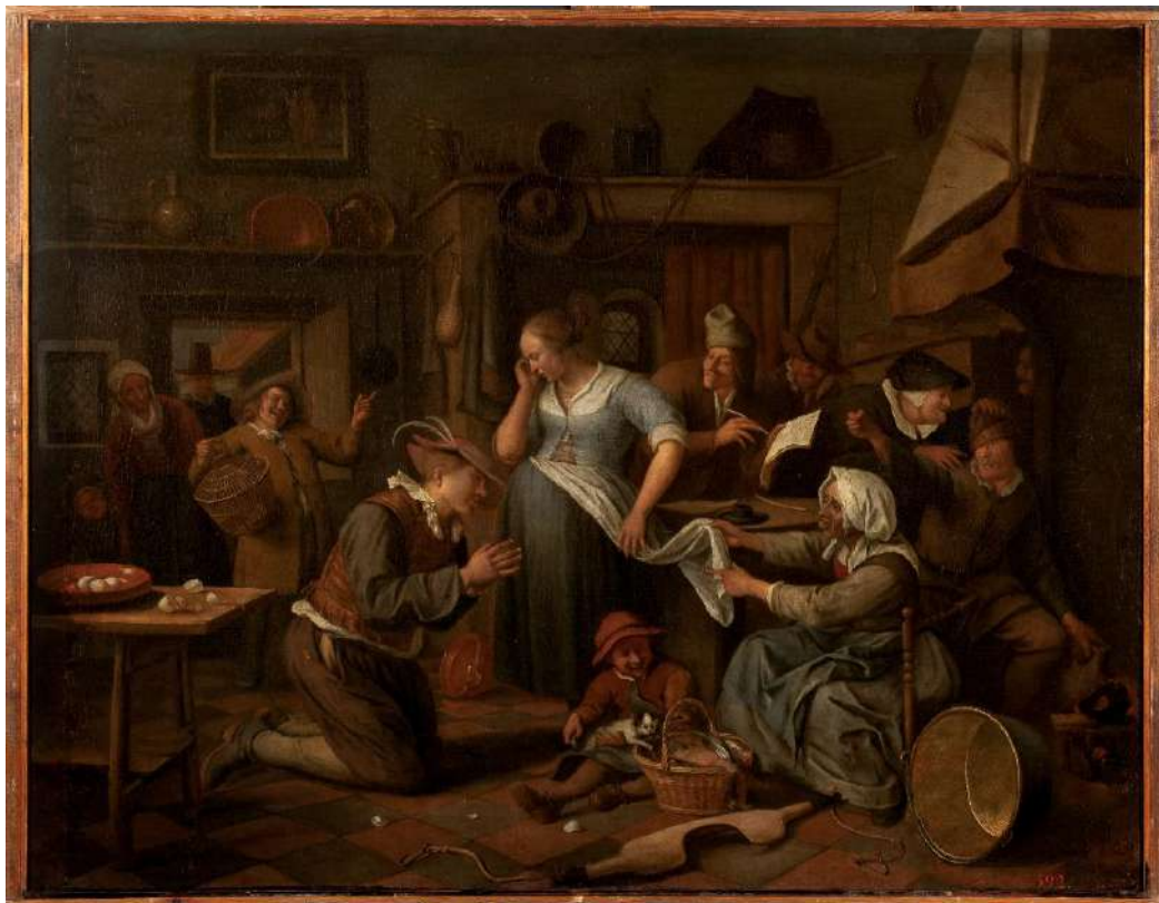
Figura 7. Jan Steen (1626-1679), Contrato matrimonial, ha. 1668, Hermitage Museum (San Petersburgo).

los intereses comunes de los dos cónyuges. Tanto que, al concretarse el acuerdo se establecían una serie de bienes –dote 114 y arras– que debían ser entregados y recibidos, para ser mantenidos y, a ser posible, aumentados a lo largo de la vigencia del mismo, buscando el beneficio como en cualquier otro tipo de negocio. Esto se determinaba en la primera de las fases del contrato matrimonial, en la que, por medio de un documento notarial firmado por el novio y el representante legal de la novia, se establecían los parámetros económicos que cada cónyuge iba a aportar al matrimonio. Así, este era, para la mayoría de las mujeres, junto con la profesión religiosa, un instrumento para la supervivencia y la inserción social 115 .