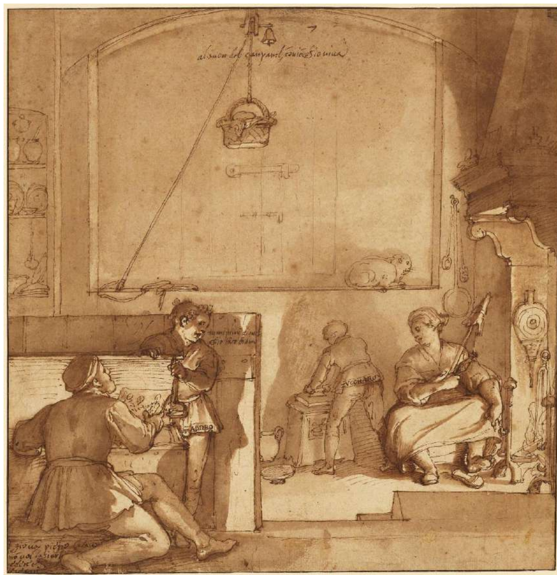
Figura 12. Federico Zuccaro (1541-1609), Veinte dibujos sobre la temprana vida de Taddeo Succaro (taller), ha. 1595, The Paul J. Getty Museum (Los Ángeles).

tapicería, llamada “de Santa Isabel” porque se ubicó en un edificio aledaño al colegio homónimo, cuyos niños, huérfanos, también fueron destinados a aprender el oficio de la tapicería en la fundación. Dos años después de la muerte de su padre, ella solicitó que se la concediese el título de “tapicera de la reina” 220 , aunque en 1603 debió marcharse a Valladolid. La tapicería continuó en activo unos años más, posiblemente bajo la dirección de alguno de los oficiales 221 .