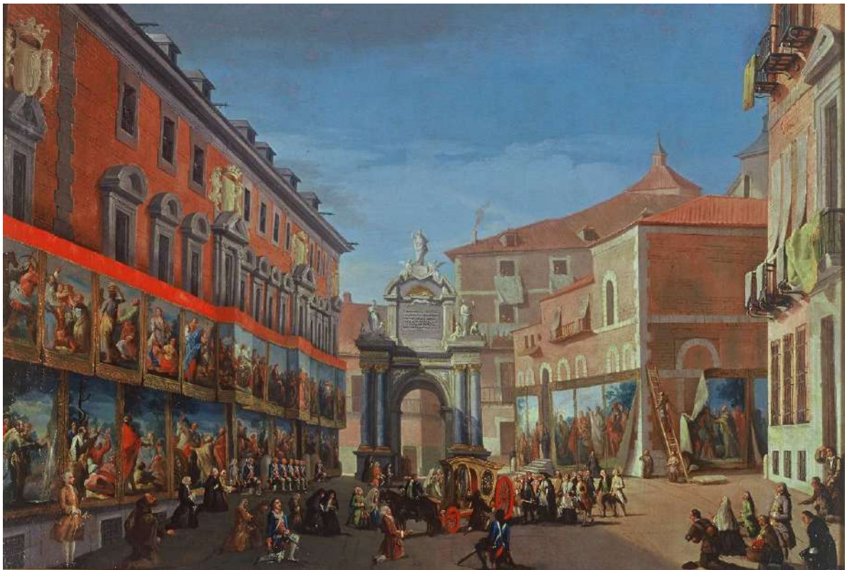
Figura 2. Lorenzo de Quirós (1717-1789), Arco de triunfo de Santa María en la Calle Mayor [antigua calle de Platerías, donde se ubicaron las tiendas de los miembros del gremio de plateros], ca. 1763, depósito de la Real Academia de Bellas Artes de San Fernando en el Museo de Historia de Madrid (Madrid).

“[...] ante una demanda cuya expansión era percibida como incierta y reversible en el corto y medio plazo, el crecimiento unilateral de una empresa (una familia) ponía en peligro la viabilidad de otras, y frente a las amenazas externas, las cofradías reclamaban la conocida y siempre denostada privativa local del oficio y el control del acceso a su práctica” 54 .