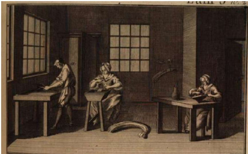
Figura 4. Anónimo, Pasamanero, herretero ó modo de hacer los herretes , en Colección de estampas de la Encyclopedia metórica, por orden de materias , tomo primero. En Madrid: en la Imprenta de Sancha, 1794, lámina 3, BH FLL 14918, Biblioteca Histórica Marqués de Valdecilla (Madrid).

tenían que contraer matrimonio con algún hombre agremiado, o poner a alguno de sus hijos varones, si los tuviesen, al frente del obrador.