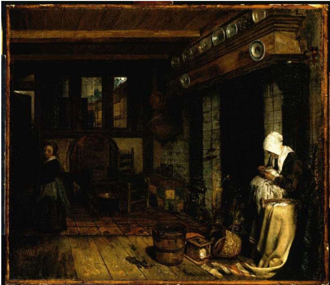
Figura 8. Esaias Boursse, Interior alemán con una mujer cosiendo , c. 1660, Gemäldegalerie der Staatlichen Museen, Berlin.

“Naturalmente el semen del hombre es recibido en el vientre maternal, si tiene calor suficiente el hombre engendra varón y de otro modo la mujer. Por ello, por defecto de color vivo la mujer es más imbécil por naturaleza, menor en seriedad, más caduca, miedosa, por lo que ha de ocuparse en el cuidado de pequeños negocios” 131 .