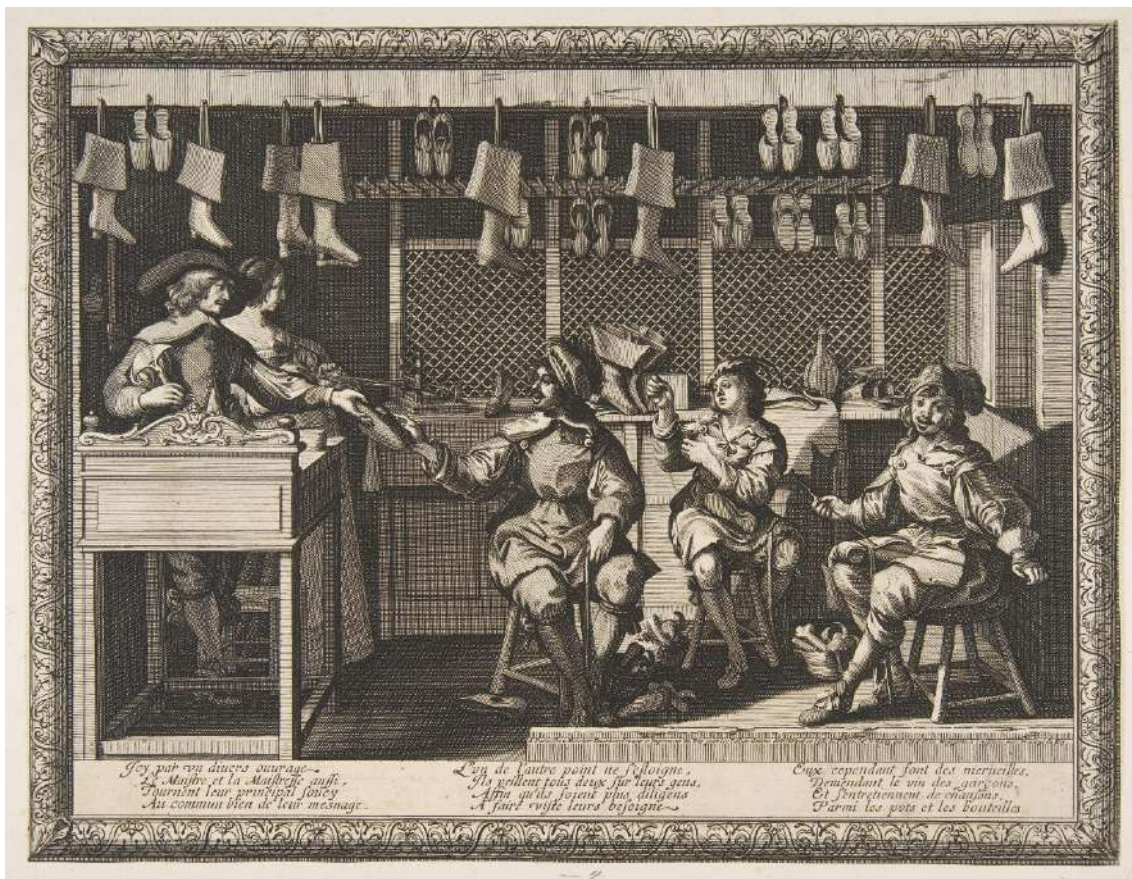
Figura 15. Abraham Bosse (1602/4-1676), Interior de una tienda de zapatería (Le Savatier), ha. 1632-1633, IFN-8403220, Biblioteca Nacional de Francia (París).