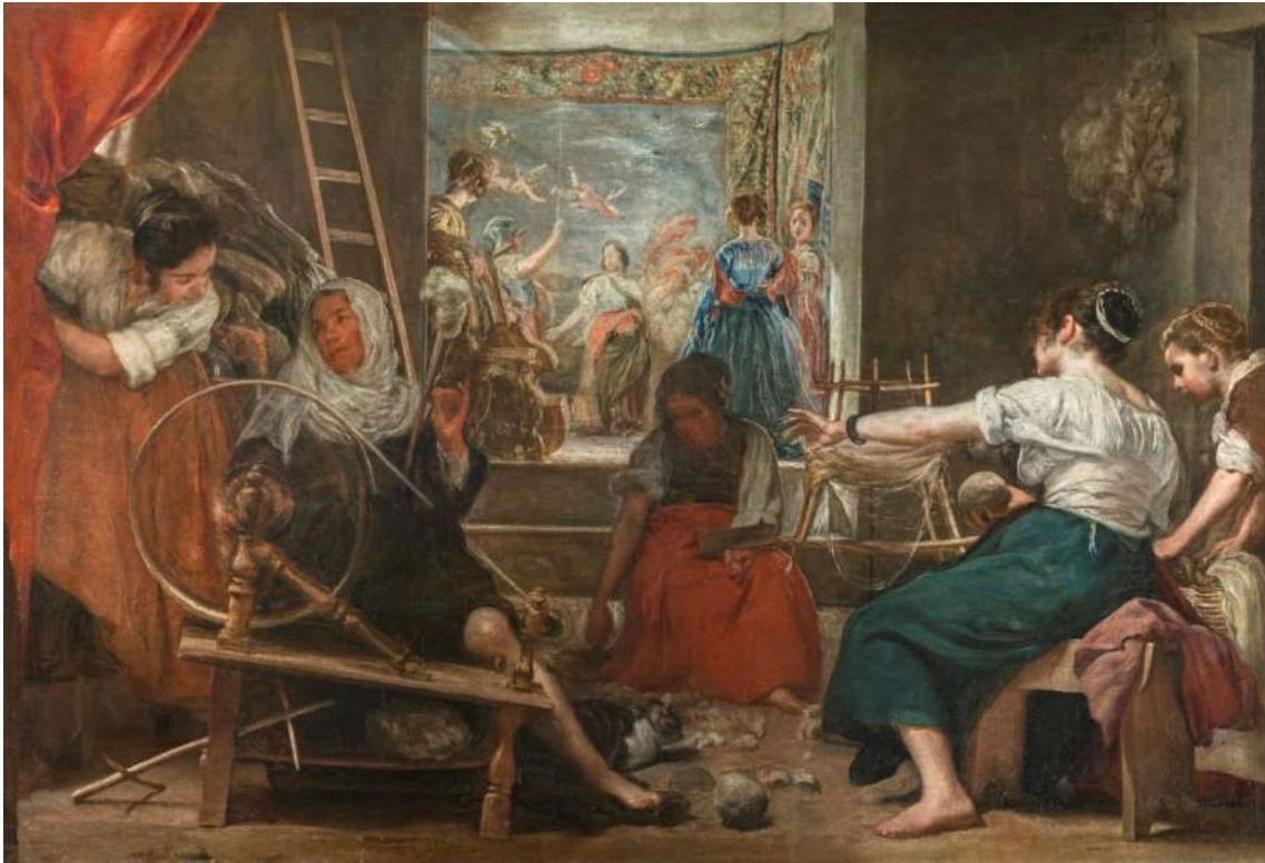
Figura 5. Diego Velázquez (1599-1660), Las hilanderas o La fábula de Aracne, 1655-1660, Museo Nacional del Prado (Madrid).

los grupos. Además, si perteneciese al segundo, nos permitiría corroborar el empleo del genérico como alusión tanto a los trabajadores como a las trabajadoras.