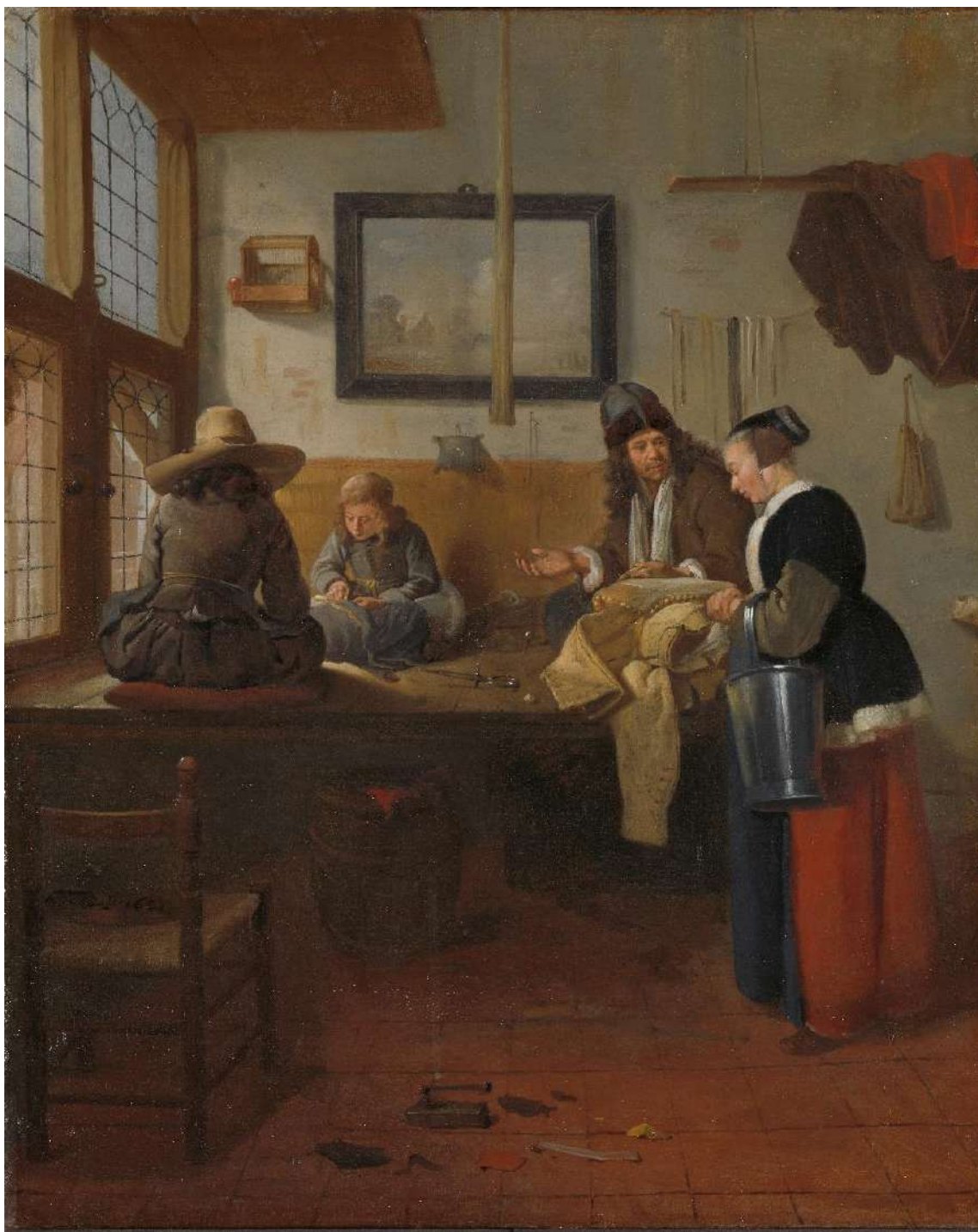
Figura 16. Quiringh Gerritsz. van Brekelenkam, El taller del sastre , 1661, Rijksmuseum (Ámsterdam).

Este traspaso se materializó a través de mujeres que, según la relación que tuviesen con el maestro del taller, transferían la propiedad o permitían el fortalecimiento del obrador, a otros hombres dedicados al mismo oficio. En el caso de las hijas del propietario, fue común que contrajesen nupcias con un hombre ocupado en la misma tarea, en ocasiones un oficial del