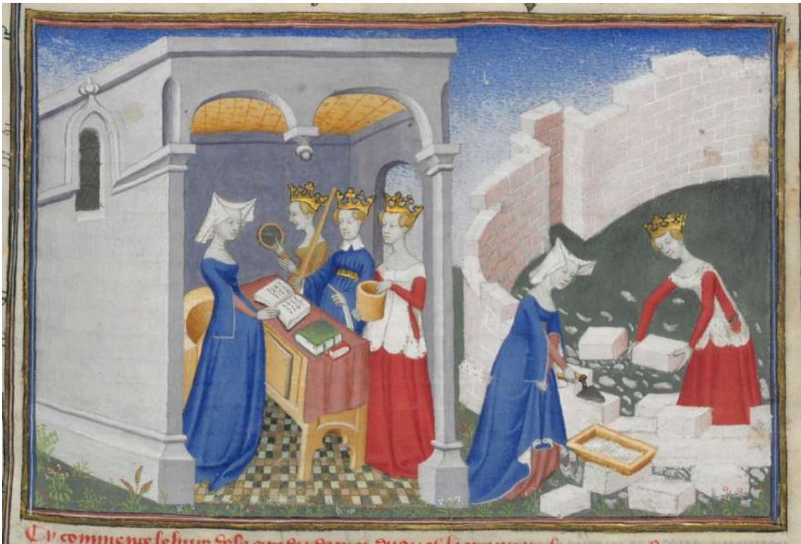
Figura 3. Anónimo (llamado Le Maître de la Cité des Dames), Mujeres construyendo la Ciudad de las Damas , en Christine de Pizan, Cité des Dames , 1405, Ms. 607, f. 2r, Biblioteca Nacional de Francia (París).

Aplicado al contexto de nuestro estudio, con el establecimiento de la corte en Madrid en 1561 hubo, como ya hemos mencionado, un aumento demográfico que propició el incremento de la población laboral 63 , al mismo tiempo que se intensificaba la demanda, generándose así la expansión económica. Si bien en las primeras décadas, esto propició que tanto hombres como mujeres ejerciesen oficios de forma pública, con el paso de los años fue generando una crítica coyuntura derivada del exceso de trabajadores en relación con la demanda existente, algo que se vio potenciado con la crisis económica del siglo XVII 64 . Esto podría haber propiciado que se generase una división sexual del trabajo que se vería incrementada los siglos posteriores, como reacción de los trabajadores ante la competencia que suponían las mujeres, cuyo trabajo en los oficios que aquellos desarrollaban se movía dentro de unos parámetros de igual calidad, pero menor remuneración 65 .