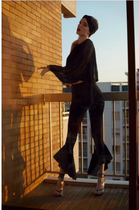
Fig. 7.- Fotografía de Zara

Hay que cubrir contenido en las webs de moda, el consumo sigue estando ahí. Nuevas publicaciones en redes sociales, nuevas tendencias, tejidos, modelos, etc. El ser humano sigue existiendo y el mundo también, el tiempo no se ha detenido y fruto de ello es que mientras hemos estado confinados hemos cambiado de estación. Las plantas han germinado, la fauna recoloniza la ciudad, las aguas son más cristalinas y el aire está más limpio y puro. La naturaleza nos está hablando ahora más que nunca.