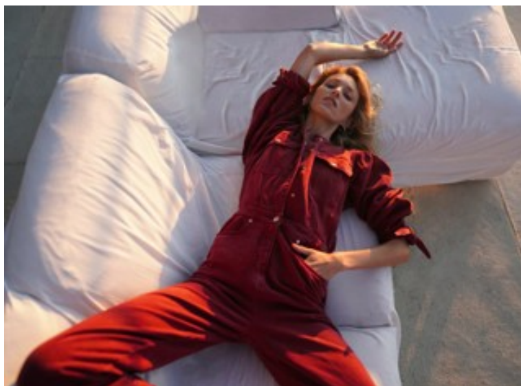
Fig. 5.- Fotografía de Zara