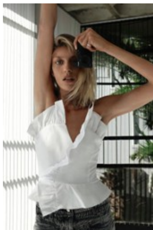
Fig. 4.- Fotografía de Zara