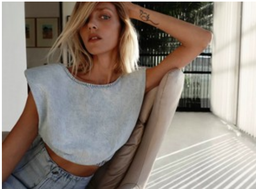
Fig. 3.- Fotografía de Zara