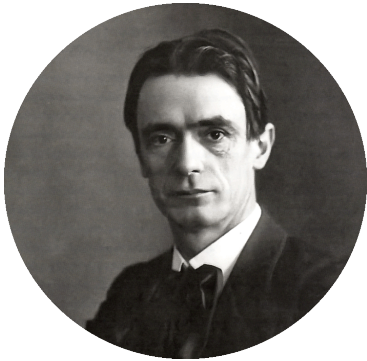
RUDOLF STEINER (1861-1925)

Fuente de la imagen: http://upload.wikimedia.org/wikipedia/commons/f/f5/Steiner_um_1905.jpg