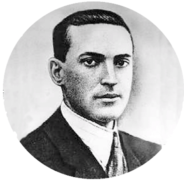
LEV S. VYGOTSKY (1896-1934)