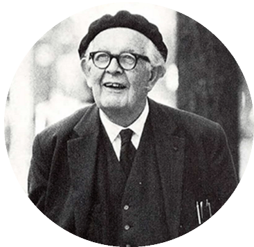
JEAN PIAGET (1896-1980)