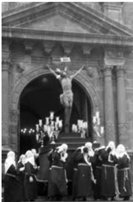
Cristo de las Siete Palabras y cofradía del Cristo Preso (2011)