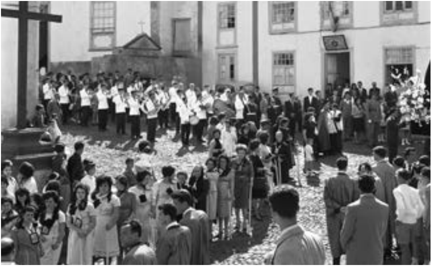
Banda de Música Santa Cecilia (ca. 1965) [JMLM]

Santísimo Rosario, a la del Señor de la Columna , la del Nazareno y la del Santo Entierro, además de la del Santísimo del Domingo de Pascua; las hermandades del Santísimo Sacramento, las procesiones del Domingo de Ramos y las del Domingo de Resurrección, además de la del Calvario , la homónima de San Francisco, y la del Santo Entierro, la de El Salvador; y la cofradía del Santo Escapulario del Carmen y la v.o.r. de Santo Domingo, la madrugadora procesión de Pascua de El Salvador, junto las autoridades y a las fuerzas del Batallón de Infantería, así como la procesión del Santo Entierro. Intervienen, además, puntualmente las asociaciones del Apostolado de la oración y de la Medalla Milagrosa de El Salvador y la cofradía de la Virgen de San Francisco.