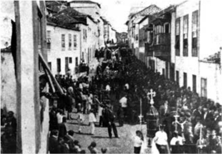
Procesión del Crucificado (ca. 1900)

un religioso franciscano 60 . El desfile procesional del Santo Entierro reúne las imágenes de la Dolorosa de Estévez, el San Juan del Morenito, y los Santos Varones (en andas separadas), el Señor Muertito y la Magdalena , atribuidas al padre Díaz.