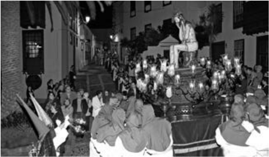
Procesión del Señor de la Piedra Fría (Francisco Fajardo Batista, 2011) [AFC]