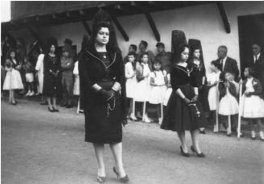
Cofradía de los Siete Dolores (1959) [AJJR]

Santo Entierro. Se funda el 11 de marzo de 1957, aunque sus estatutos no son definitivamente aprobados hasta el 24 de diciembre de 1959, por lo que desfila por primera vez el 12 de abril de 1957 bajo una autorización provisional 51 . La hermandad sepulcrista viste túnica blanca de raso, capirote y capa de raso negro y cíngulo rojo terminado en borlas. El distintivo es una cruz de terciopelo rojo (algo inclinada) con una corona de espinas bordada sobre sus brazos. Acompaña la procesión del Santo Entierro y se ocupa de llevar el cuerpo de Jesús en la ceremonia del enterramiento, sustituyendo en esta labor, cincuenta años después, a la histórica cofradía de la Santa Vera Cruz y Misericordia. El mismo año se funda también en El Salvador la hermandad de damas de Los Siete Dolores, que desfila en la procesión de la Dolorosa del Viernes de Dolores y en la