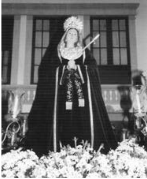
Dolorosa (El Salvador). Anónima (siglo XVI) [AJJR]

aunque no lo hicieran en aquel tiempo, procesionan en la actualidad, cifra muy superior a la de cualquier otra ciudad del archipiélago. El frecuente intercambio comercial que se establece con Flandes con motivo de la exportación del azúcar y la nutrida colonia de mercaderes de Amberes, Malinas y Bruselas que se instalan en la isla, contribuyen a que La Palma reúna más del 60 por ciento de la producción artística existente en Canarias proveniente de talleres flamencos, destacando especialmente la producción escultórica, que se reparte por numerosos templos del territorio insular y que constituye uno de los mayores tesoros artísticos de la isla 5 .