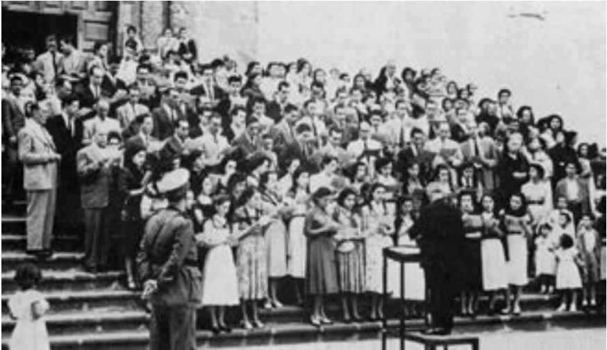
La Masa Coral interpreta el motete O vos omnes (ca. 1951) (AJGRE)

mismo contribuí a ello cuando introducía a veces el tercer sonido de la tríada. Agrupaciones corales cantaron los motetes O vos omnes y Dextera Domini ; el resto era suficientemente fuerte para resistir la coralización» 36 . Su declive se acelerará con el largo periodo de inactividad que tendrá la Masa Coral de La Palma a partir de 1956.