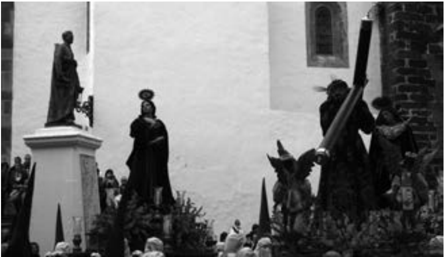
Punto en la plaza (Jorge A. Guerra Machín, 2009) [AFC]