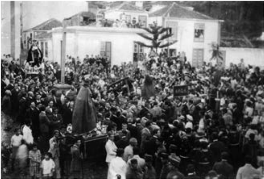
Encuentro en la Alameda (ca. 1928) [AJGRE]

Huerto y del Crucificado y la Venerable Hermandad del Santísimo Rosario, la del Nazareno y el Santo Entierro.