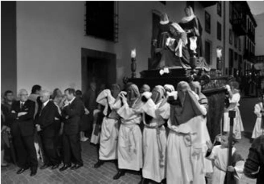
Las Tres Marías, y los artífices (José A. Fernández Arozena, 2011) [AFC]