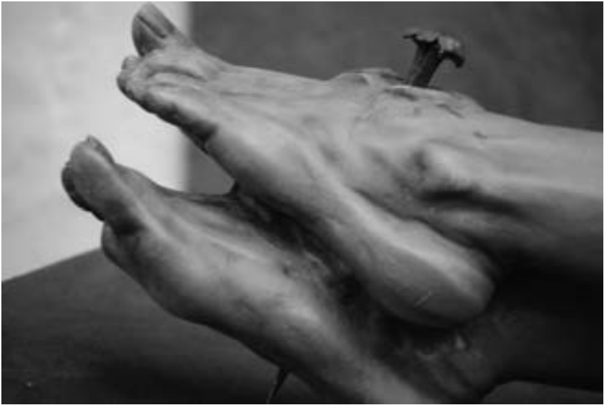
Detalle del Cristo del Clavo (Ismael Pérez Hernández, 2010) [AFC]

Cristo en la Tierra: ¡clavado a ella!». La denominación que ha prosperado, Cristo del Clavo , se debe al padre Rafael Navarrete s.j., malagueño como el escultor, que así lo bautiza con ocasión de una serie de conferencias y meditaciones celebradas en Santa Cruz de La Palma poco después de la llegada de la imagen a la isla. El clavo, según su artífice, procede del castillo de Borgia en Nepi, localidad cercana a Viterbo. Esta imagen es la única que el escultor malacitano no talla en España, aunque será en La Palma donde terminará de policromarla. La parte posterior de la imagen que reposa sobre la espalda y el paño de pureza se muestra lisa, sin labrar. Toral Valero recuerda las verdaderas dificultades que al imaginero le dio la talla del Cristo palmero, que necesitó repetir dado que la sacada de puntos en piedra-mármol no le permitía perfeccionar la anatomía musculosa y venaria 3 .