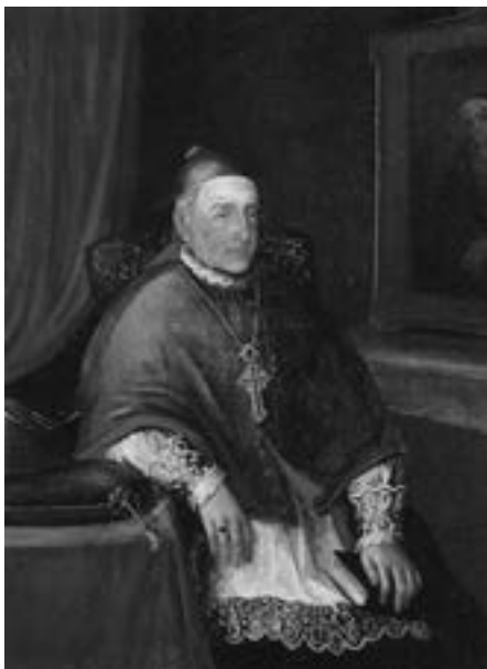
Obispo Luis Folgueras Sión, retrato de Juan Abreu (siglo XIX)

Aún en el marco de la Década ominosa, en 1830 visita la isla el primer obispo de la nueva diócesis nivariense 22 , Luis Folgueras Sión (1825-1847), en cuya visita, que se extiende hasta agosto de 1832, resalta la solemnidad, el esplendor litúrgico y la concurrencia con que se celebra la Semana Mayor en Santa Cruz de La Palma, convertida de facto en la sede episcopal de la diócesis. Asiste el Domingo de Ramos a toda la función: bendice y distribuye las palmas, va en la procesión y está en el sermón y misa mayor. El Jueves Santo pontifica el Santísimo, consagra los santos óleos, efectúa el sermón general e indulgencias, lava los pies, y lleva en la procesión el Santísimo Sacramento hasta el monumento.