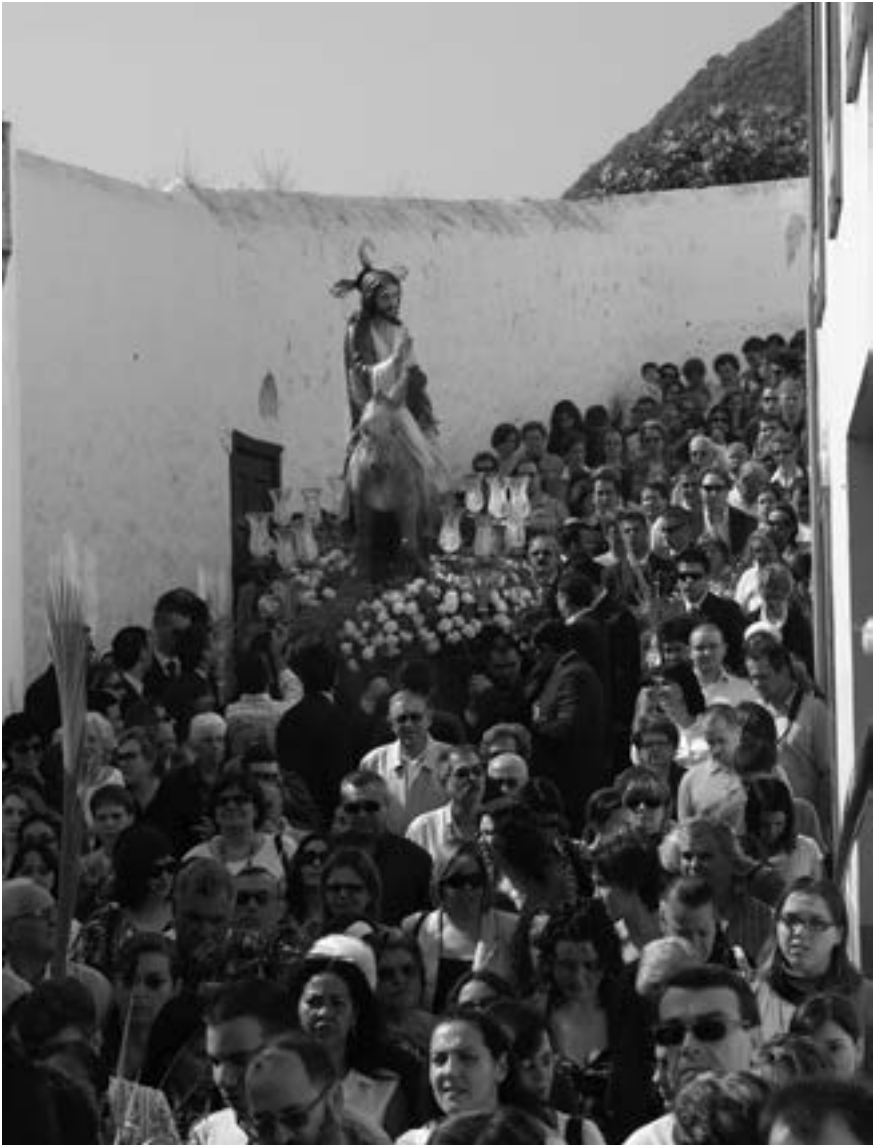
Procesión de Jesús entrando en Jerusalén (José A. Fernández Arozena, 2011) [AFC]