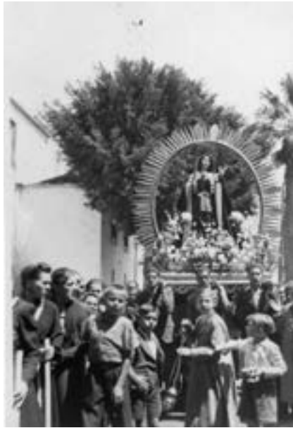
Virgen de la Soledad en procesión (ca. 1940)