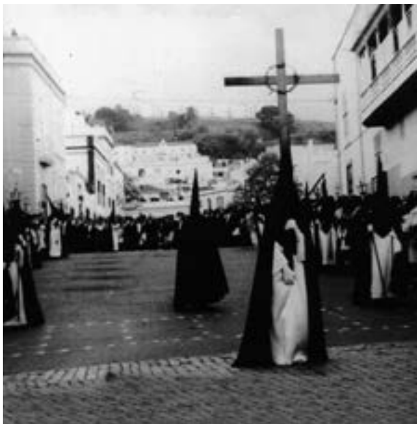
Cofradía del Santo Sepulcro (ca. 1961)