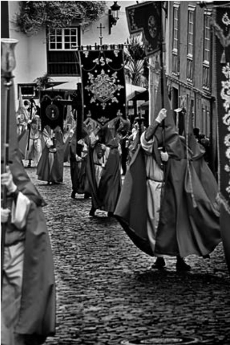
Cofradía del Crucificado y la Vera Cruz (José A. Fernández Arozena, 2009) [AFC]