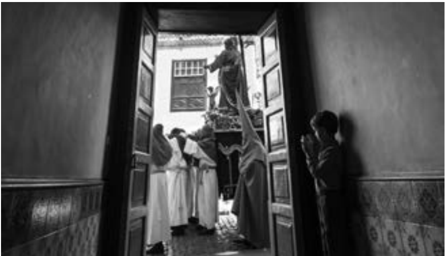
El niño ante un poso del Calvario (José A. Fernández Arozena, 2013) [AFC]