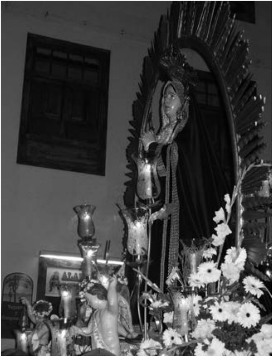
Virgen de la Soledad (2008) [AJJR]