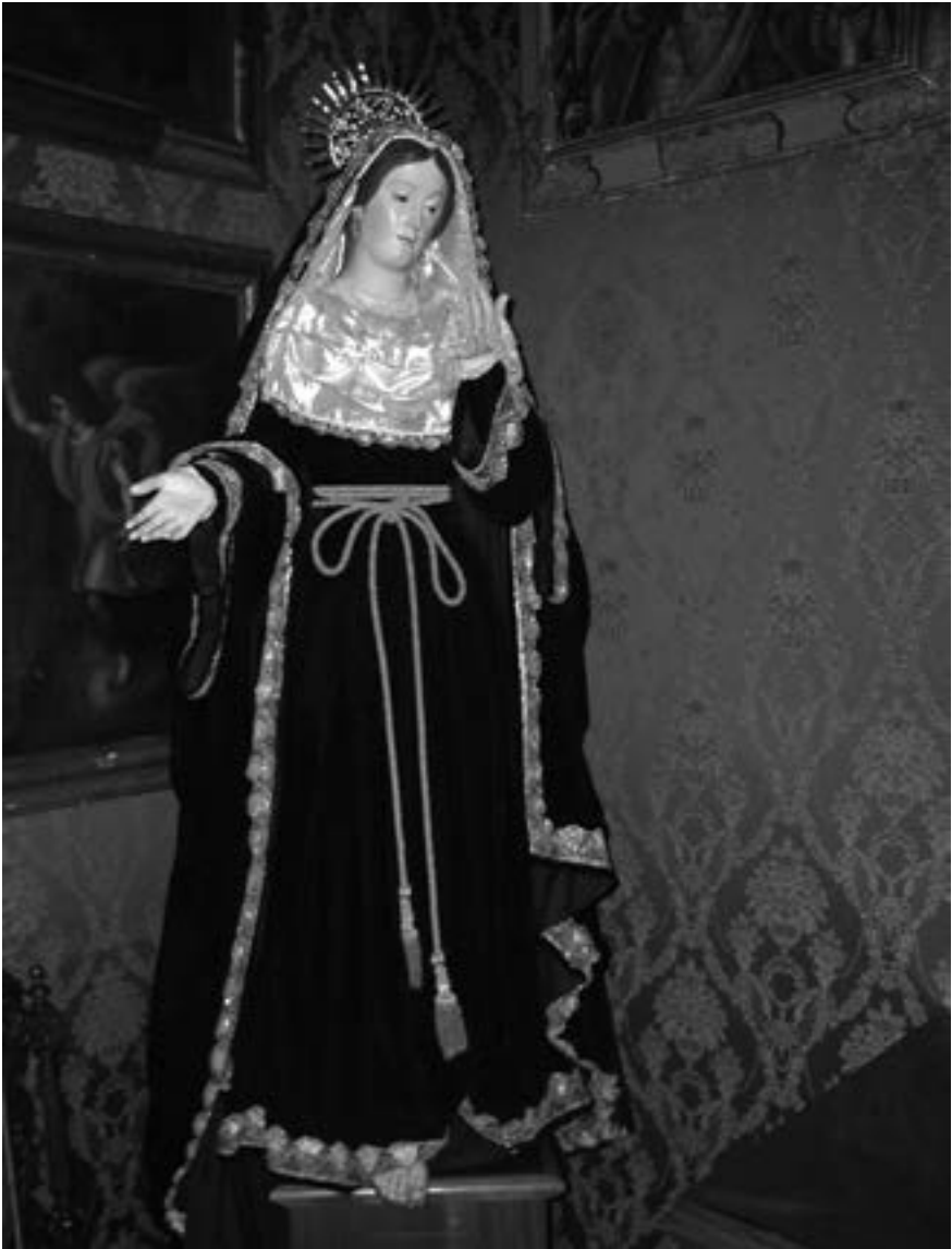
Nuestro Señora de los Afligidos (Las Nieves) [AJJR]