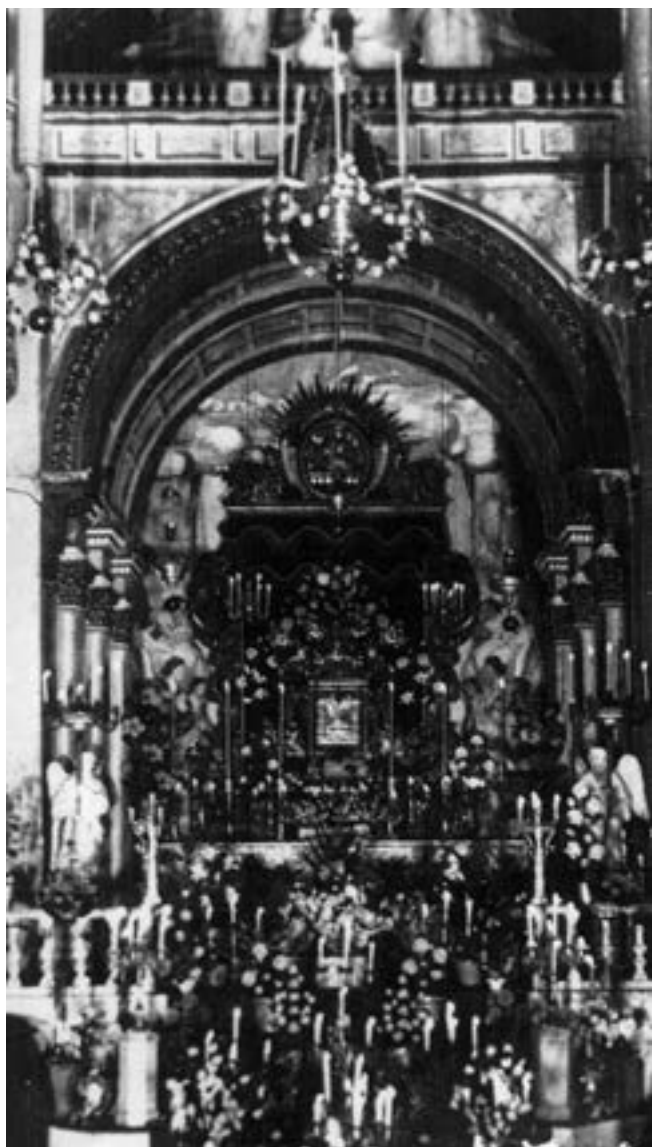
Monumento de la parroquia de El Salvador (ca. 1898) [AJGRE]