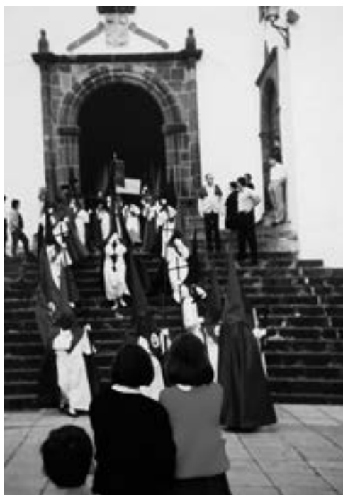
Cofradía del Santo Encuentro (sección femenina) (1990)

que salen ahora conjuntamente con el resto de las imágenes secundarias desde la iglesia de Santo Domingo, y no desde la ermita de San Sebastián como solían hacerlo. Tras la ceremonia del entierro, se mantiene la tradicional procesión del Retiro o de la Soledad conformada por las imágenes de la Dolorosa , San Juan y los Santos Varones en su regreso al antiguo cenobio dominico 5 .