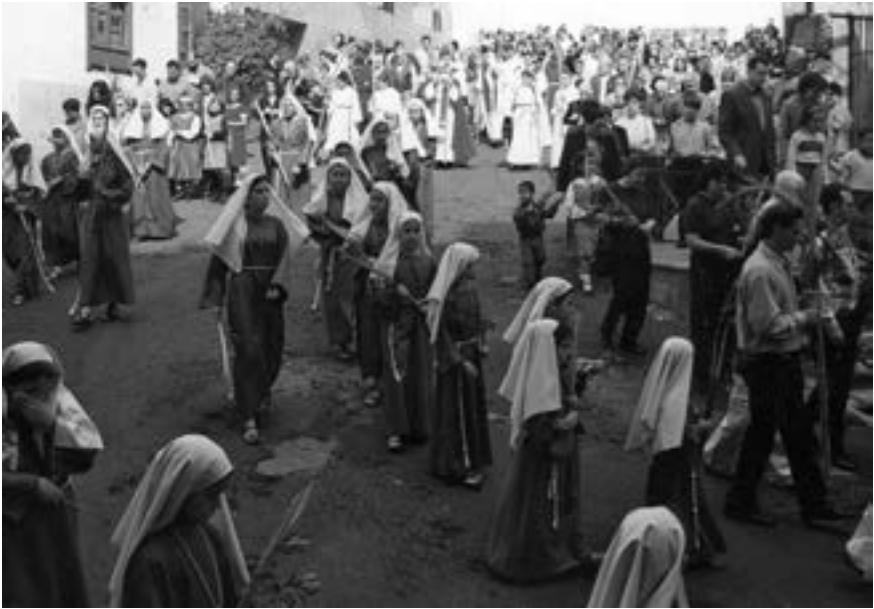
Cofradía de la Verónica (1986) [AJJR]