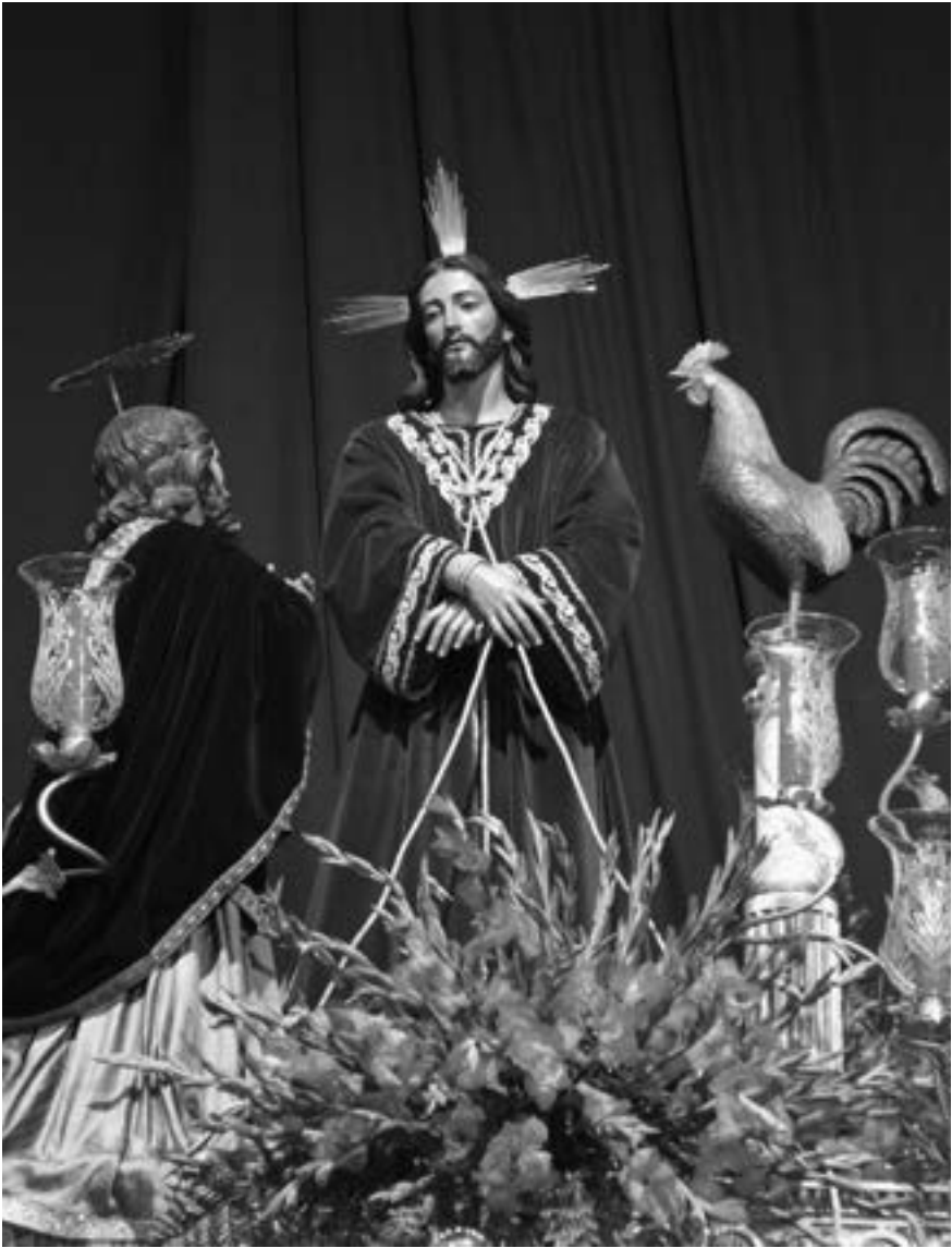
Paso del Señor del Perdón y San Pedro penitente (Ricardo Marante Ortega, 2009) [AFC]