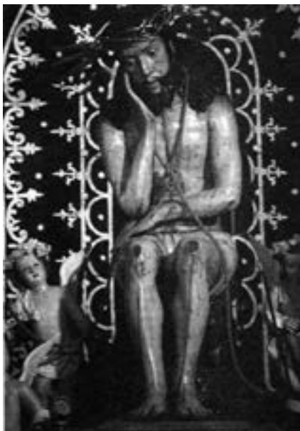
Señor de la Piedra Fría. Anónimo (siglo XVI) [AJGRE]

antigua calle de la Cuna 12 . Al Cristo , de aspectos góticos y en el que predominan las formas arcaizantes y medievalistas, se le representa sentado sobre la piedra fría, con la diestra en la mejilla y coronado de espinas 13 . Presumiblemente esta devoción haya entrado en Canarias por los Países Bajos, ya que se extendió de manera especial en Europa central y septentrional 14 .