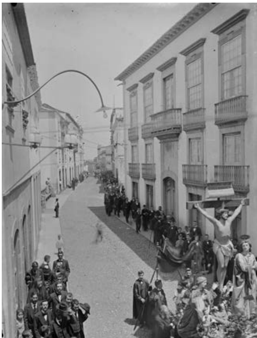
Procesión del Crucificado (ca. 1910) [AGP, MB]