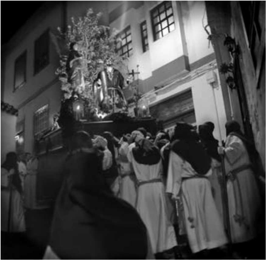
El Señor del Huerto en la pendiente de Jorós (José A. Fernández Arozena, 2010) [AFC]