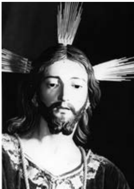
Detalle del Señor preso. Fernando Estévez (siglo XIX)

atribuirse a los continuadores de Martínez Montañés 58 . La túnica que viste la efigie es de terciopelo bordado y data de 1803 59 . Sobre esta imagen, el sacerdote e historiador Sebastián Padrón Acosta (1900-1953) ha escrito: «La cabeza de Cristo está magistralmente tallada. Una expresión de tristeza infinita, de amoroso perdón, se refleja en la faz sacra de Cristo. Las manos son obra acabada. El artista rotavense, al modelarlas, tuvo muy en cuenta la presión que en ellas ejercen los cordeles que la aprisionan» 60 .