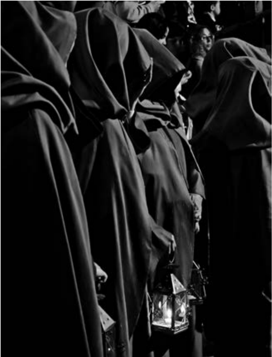
Cofradía de Nuestra Señora de los Dolores (David Amador de Paz, 2011) [AFC]