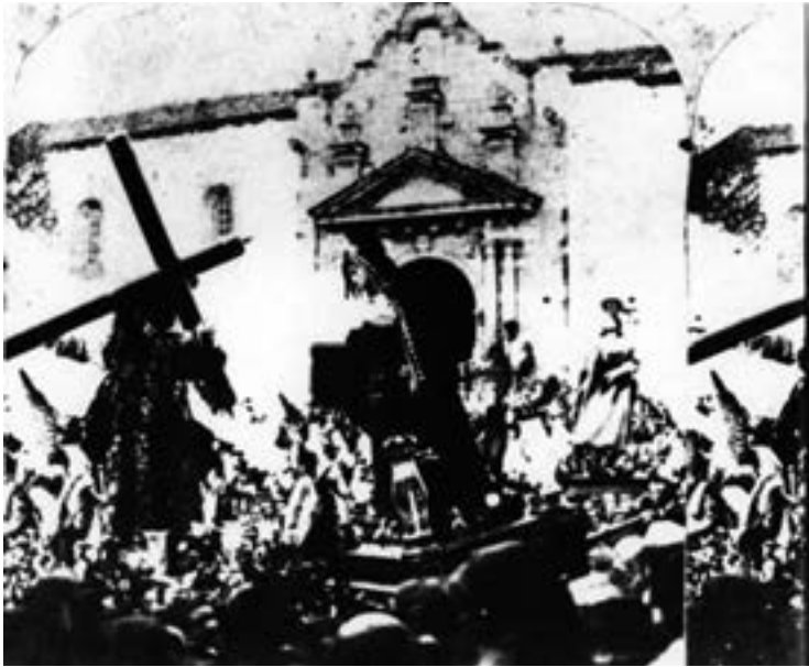
Punto en la plaza (ca. 1857) [AJGRE]

centuria entrante, con el exordio del Sexenio (1868-1874), donde predomina otra vez el clima anticlerical y secularizante.