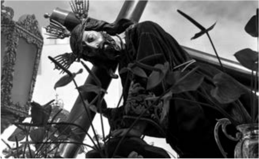
El Señor de la Caída procesionó por primera vez en 1920 [AJGRE]

aunque se insta la asistencia de los terciarios. El Señor de la Caída procesiona junto a la Dolorosa de Nicolás de las Casas y en ocasiones con una eventual Verónica , ambas imágenes pertenecientes a la Orden Tercera 28 .