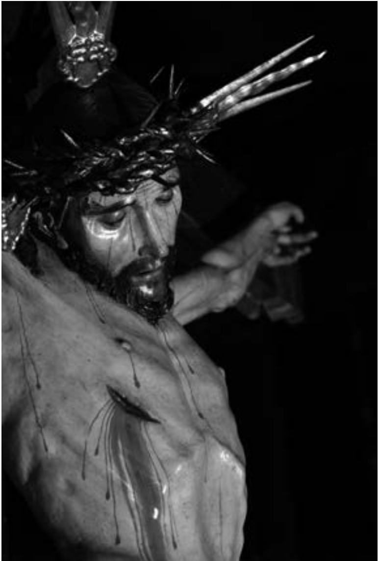
Santísimo Cristo del Amparo (siglo XVI) (Miguel Á. Álvarez Trinidad, 2011) [AFC]