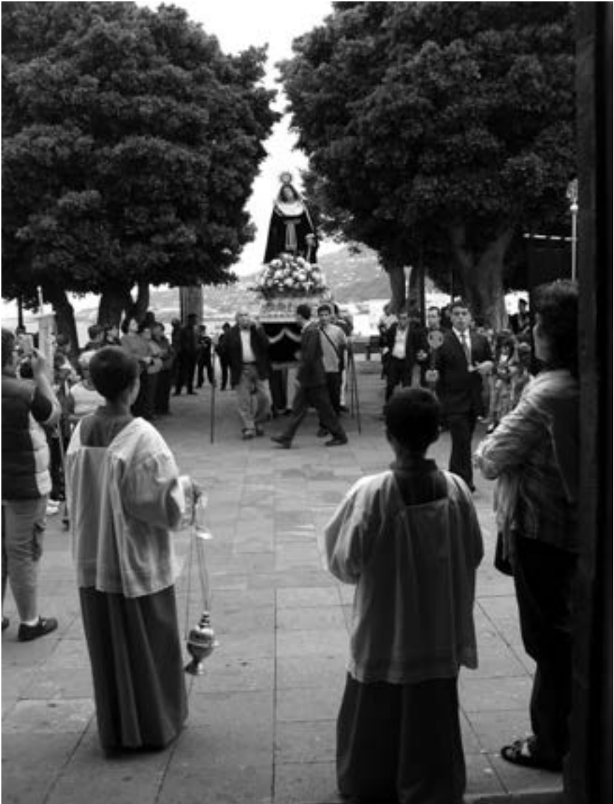
La Dolorosa de La Encarnación (Cristina M a Reyes Pérez, 2011) [AFC]