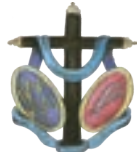
Venerable Hermandad de Jesús Nazareno