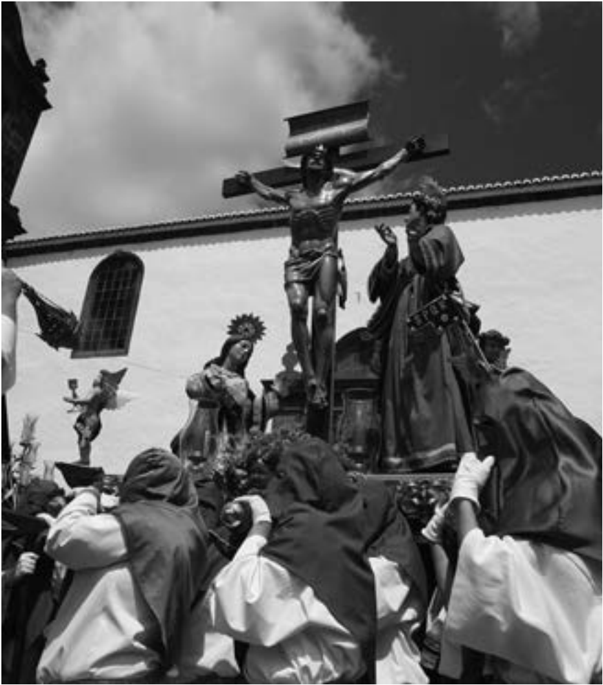
El Calvario (Daniel Rodríguez Cabrera, 2008) [AFC]