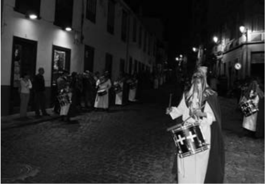
Cofradía de La Pasión (sección de tambores) (2008) [AJJR]

En 2003 se funda la cofradía de La Piedad, la primera con sede canónica en el Hospital de Dolores desde la antigua de La Misericordia y la Concepción y la más moderna de los Siervos de Dolores, que no solo acompañará a su imagen titular sino que participará también de la procesión magna del Santo Entierro. Su paso se enriquece, además, con dos bellos candelabros de plata maciza repujada, que sufraga el propio Cabildo Insular de La Palma.