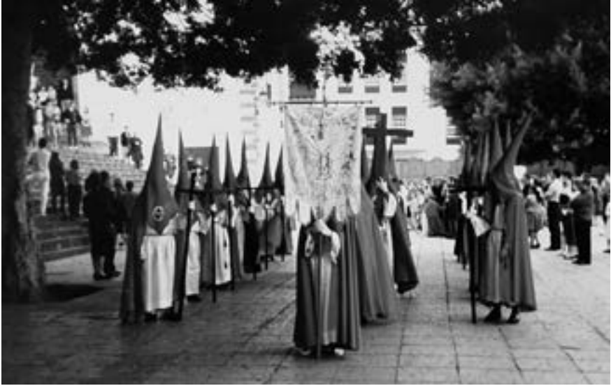
Cofradía del Santo Encuentro (sección masculina) (1990)