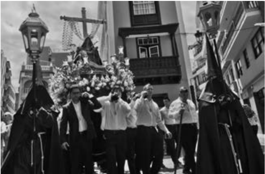
Procesión de la Piedad (José A. Fernández Arozena, 2011) [AFC]