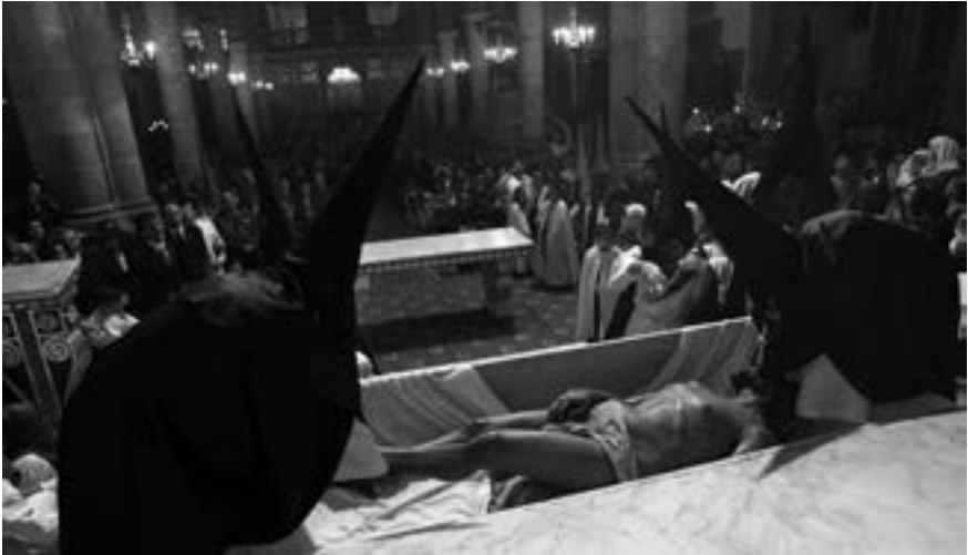
El enterramiento. Cofradía del Santo Sepulcro (Daniel Rodríguez Cabrera, 2008) [AFC]