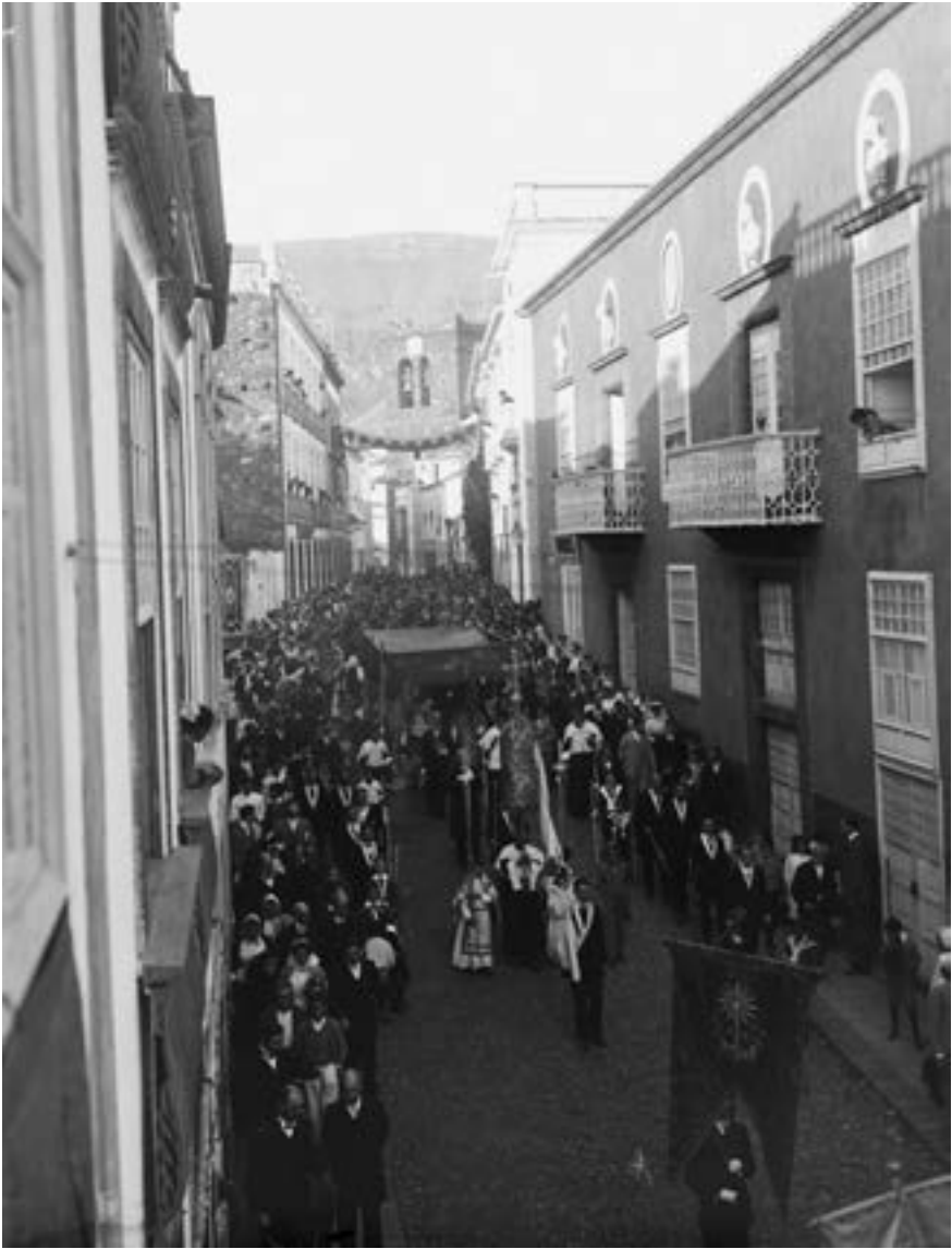
Procesión de Pascua (ca. 1911) [AGP, MB]