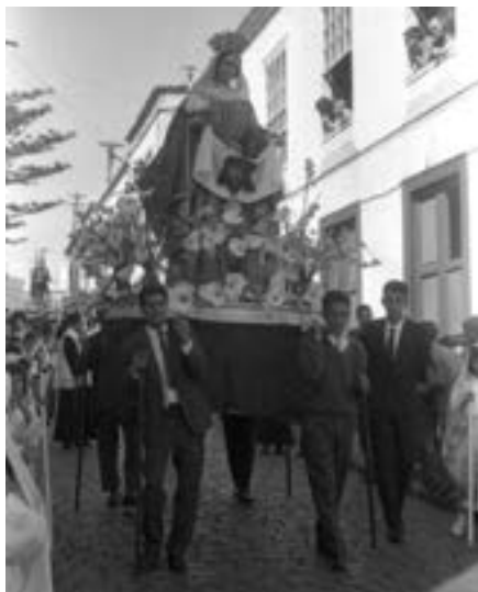
La Verónica en la procesión del Señor de la Caída (ca. 1965) [AJGRE]

de la procesión vespertina del Jueves Santo son, por fin, los cincelados por Nicolás de las Casas Lorenzo para la v.o.t.: la primera conocida ya como la Virgen de los Dolores de la Capilla de la v.o.t. (que termina por abreviarse en Virgen de la Capilla ) y el segundo, una imagen sobria, con problemas de conservación, que deja de procesionar en 1972 con motivo de su avanzado deterioro.