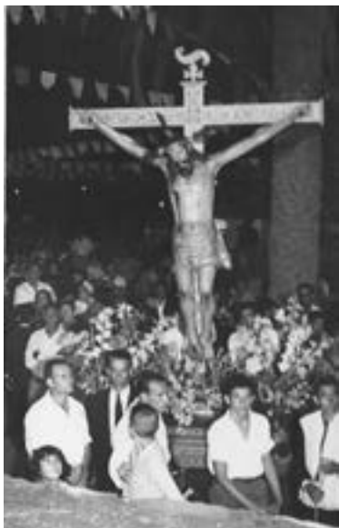
Santísimo Cristo de El Planto. Anónimo (siglo XVII) (ca. 1965) [AIGRE]

Durante el siglo XVIII tenemos prácticamente conformado el esqueleto de la Semana Santa actual, aunque sin disciplinantes, que al menos en Canarias habían desaparecido casi en su totalidad en el último tercio del siglo precedente 54 . En esta centuria, las funciones y procesiones de Semana Santa, hasta el último cuarto del siglo, cobran un especial auge. Sin embargo, las andas seguían caracterizándose por su simplicidad, sin adorno floral alguno, soportadas por pocos cargadores, y las imágenes, por su barroquismo, por lo general de candelero (más livianas para procesionar), destacaban por su realismo. Por el contrario, el pueblo y las cofradías y hermandades se mostraban de distinta forma, predominando la suntuosidad y el lujo y el estreno de las mejores ropas. Es más, en aquel tiempo el cortejo procesional se había convertido en un auténtico escaparate de la sociedad, que exhibía en público el poder económico y social de las clases privilegiadas 55 .