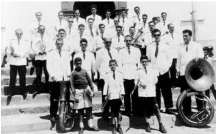
Banda de música Santa Cecilia (1954) [JMLM]