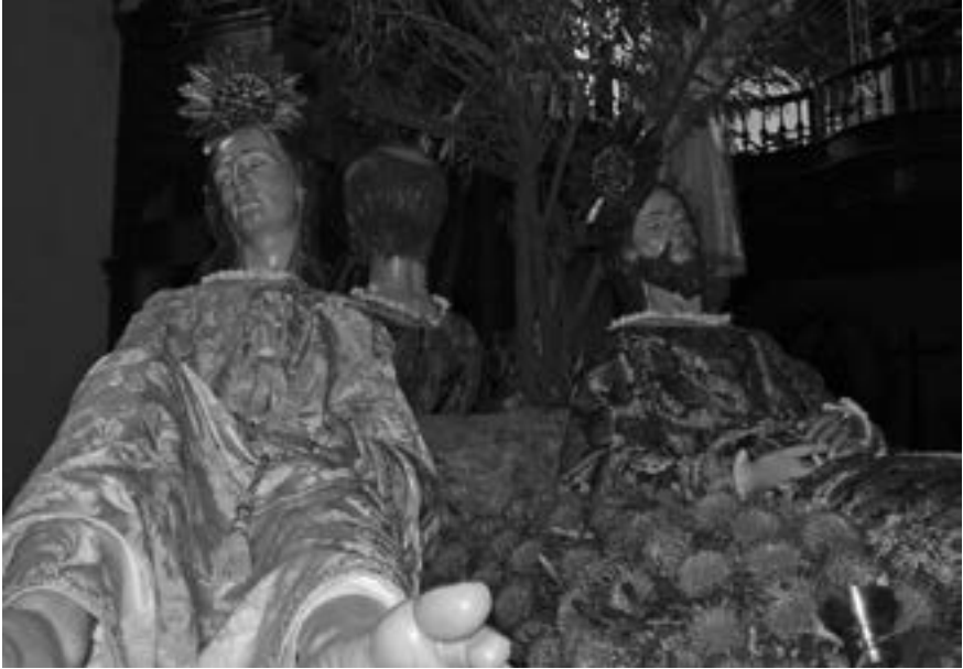
Los apóstoles dormidos. Jesús de León (2007) [AJJR]

de duración. Con música en off de conocidas marchas de procesión, el DVD ofrece una visión bastante digna de los desfiles procesionales de la Semana Mayor de la ciudad. Este año se estrenan los Niños de Hosanna de la cofradía del Santísimo Cristo Preso y las Lágrimas de San Pedro, a modo de pre-cofradía.