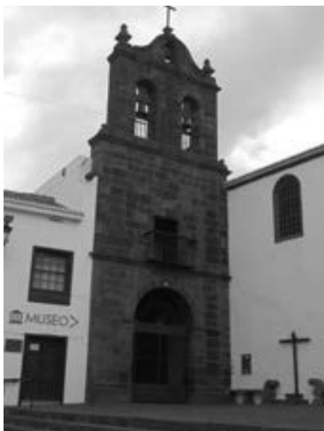
Espadaña de la iglesia de San Francisco. Antiguo convento franciscano de la Inmaculada Concepción

sujetas a la autoridad del obispo de la diócesis, prohibiéndoseles el ingreso en ellas de novicios 8 . En Santa Cruz de La Palma el convento franciscano de la Inmaculada Concepción es suprimido por primera vez el 12 de julio de 1821 y el de Santo Domingo, el 13 de julio del mismo año. Tras el fin del periodo constitucional, retornan las órdenes religiosas a sus conventos y monasterios y se restituyen privilegios y prerrogativas a los eclesiásticos. El cenobio franciscano es restablecido el 14 de julio de 1826 y el de la Orden de Predicadores, aun antes, el 25 de marzo de 1825.