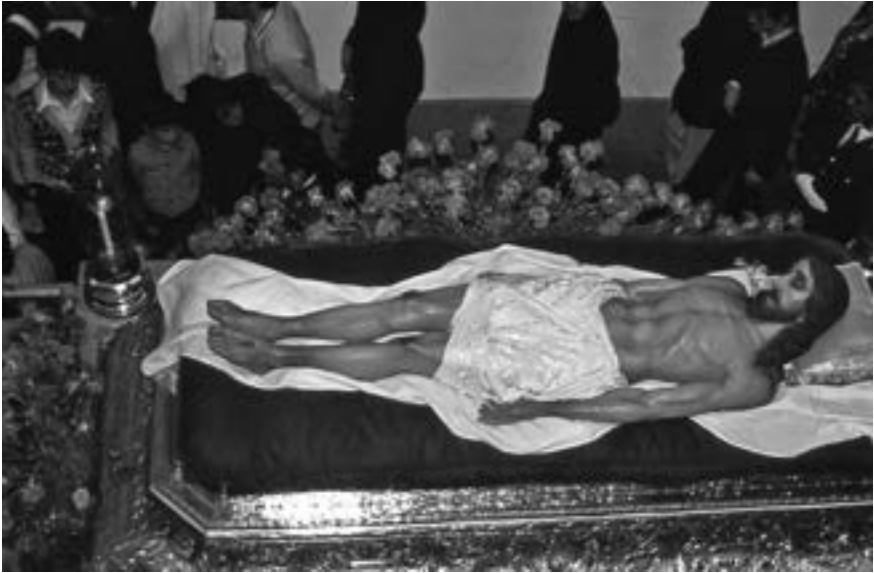
Procesión del Santo Entierro. Antiguo Cristo Yacente (1976)