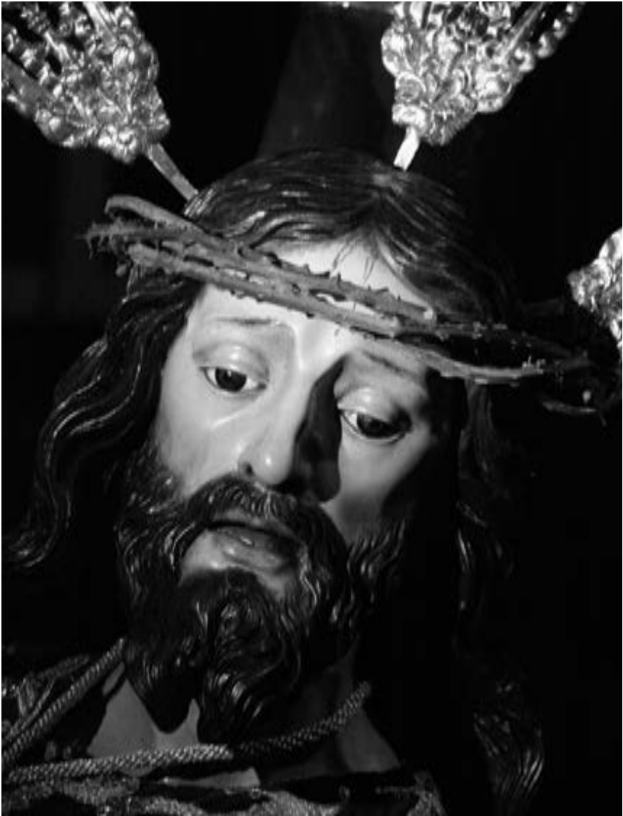
Detalle del Señor de la Caída. Hita y Castillo (siglo XVIII) (Manuel Santana Hernández, 2010) [AFC]