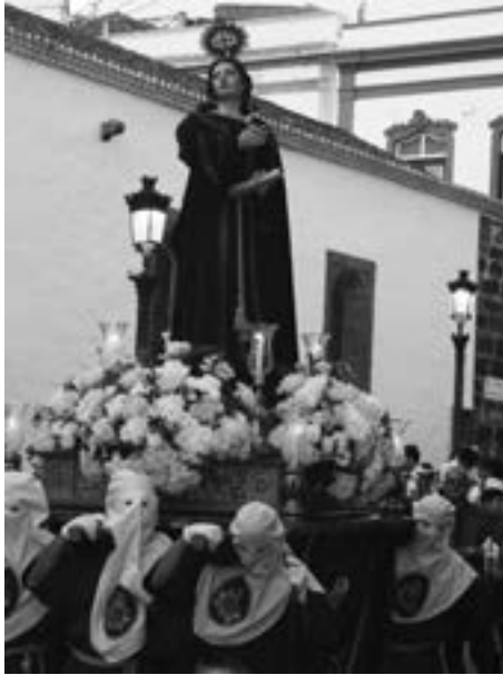
San Juan en la procesión del Nazareno (2008) [AJJR]

diez y media de la mañana en 2008 y las procesiones del Lunes y Martes Santo se adelantan media hora, saliendo a partir de entonces a las nueve y media de la noche, en 2009. Desde esos años son frecuentes las exposiciones sobre la Semana Santa o sobre algunos de sus aspectos o cofradías.