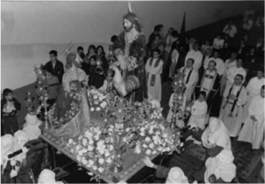
Señor del Perdón y su cofradía (1993)

les dice cargadores principalmente, como en Cádiz o en Zamora, como antaño, o «hermanos de paso», como los denominan, por ejemplo, los estatutos de la cofradía del Santo Sepulcro. La creación de la cofradía del Santísimo Cristo Preso y las Lágrimas de San Pedro posibilitará que solo un año después todos los pasos de la Semana Santa de la ciudad sean cargados por hermanos cofrades, salvo los reservados a otros cargadores por promesa o tradición ( Piedad, Virgen de la Soledad y Cristo del Clavo ) o los que desfilan extramuros. Ambas hermandades se cubren el rostro con un caperuz sin la formaleta de cartón, más cómodo para la carga, lo que les asemeja a los portadores (hermanos de carga) de Cáceres o a los braceros de León. Las cofradías de cargadores han marcado un punto y aparte en el desarrollo de la Semana Mayor de Santa Cruz de La Palma. Además, las procesiones se han hecho mucho más lucidas, a expensas de que —para aligerar la carga y mejorar su vistosidad— más confraternidades apuesten con decisión, al menos en algunos casos, por ampliar, en sus tronos, la longitud de los varaes.