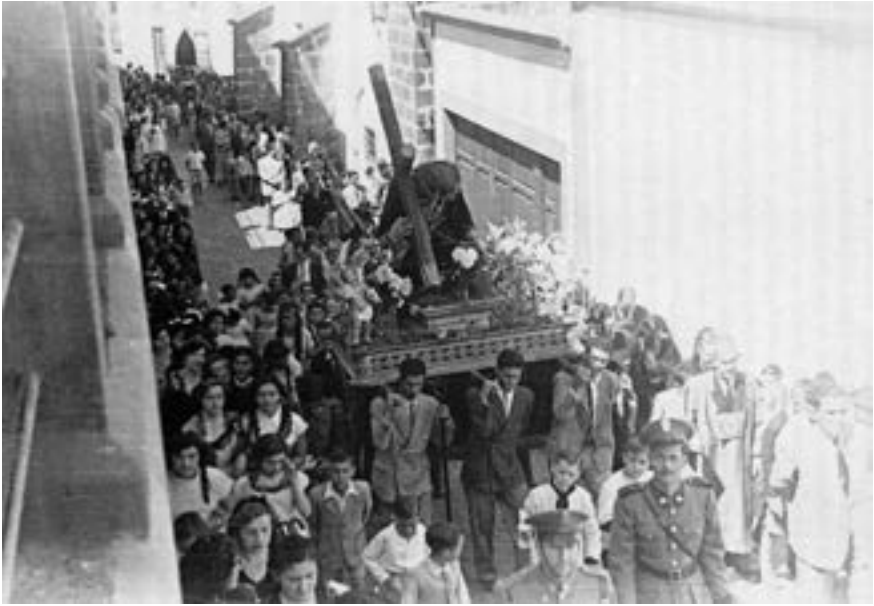
Procesión de La Caída (ca. 1949) [AJGRE]

En 1939 la v.o.t. de San Francisco restaura el vía crucis de las calles del entorno de su capilla (antigua General Mola, Rodríguez López y Baltasar Martín), y efectúa uno solemne con su imagen de la Virgen de los Dolores (Virgen de la Capilla) el Viernes de Cuaresma 2 , que será el precedente inmediato para retomar su vía crucis tradicional, conocido como la Benedicta , que transcurrirá al amanecer del Viernes Santo, y que se restablece en 1940.