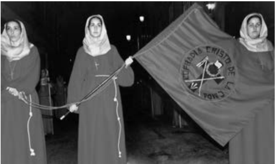
Cofradía del Cristo de la Caída ( ca. 1995) [MRC]