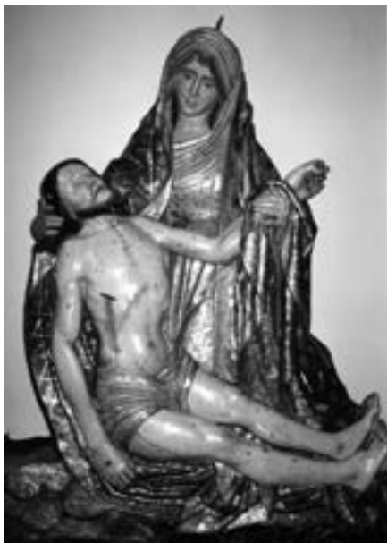
La Piedad (Hospital de Dolores). Anónima (siglo XVI) [AJGRE]

desde 1603, fue «aderezada» unos años más tarde (1634-1655) por el escultor y dorador establecido en La Palma, seguramente de origen donostiarra, Antonio de Orbarán (1601-1671) 10 .