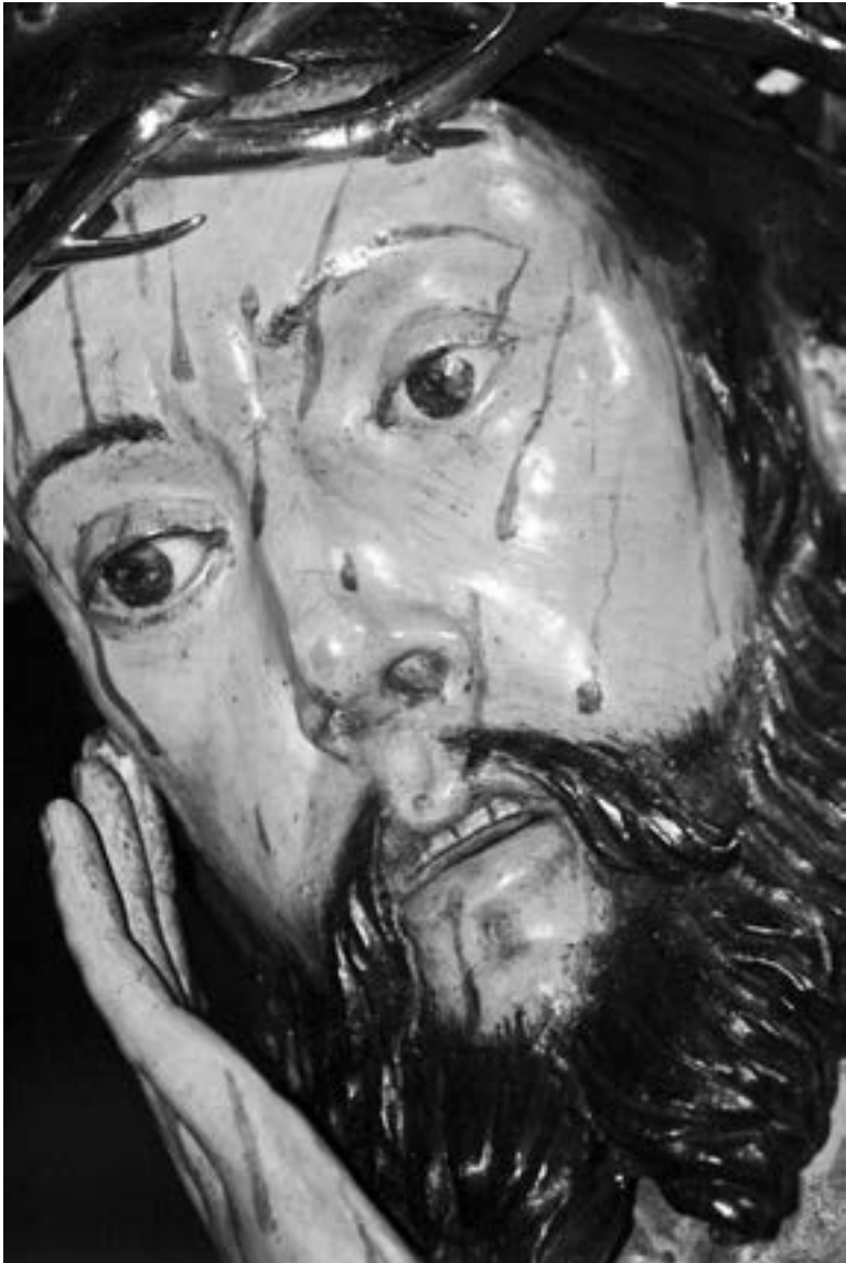
Detalle del Señor de la Piedra Fría (Miguel Á. Álvarez Trinidad, 2011) [AFC]