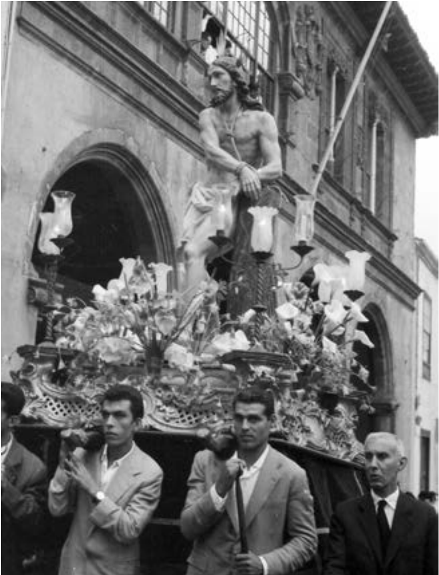
Procesión del Señor de la Columna (ca. 1970) [AJGRE]