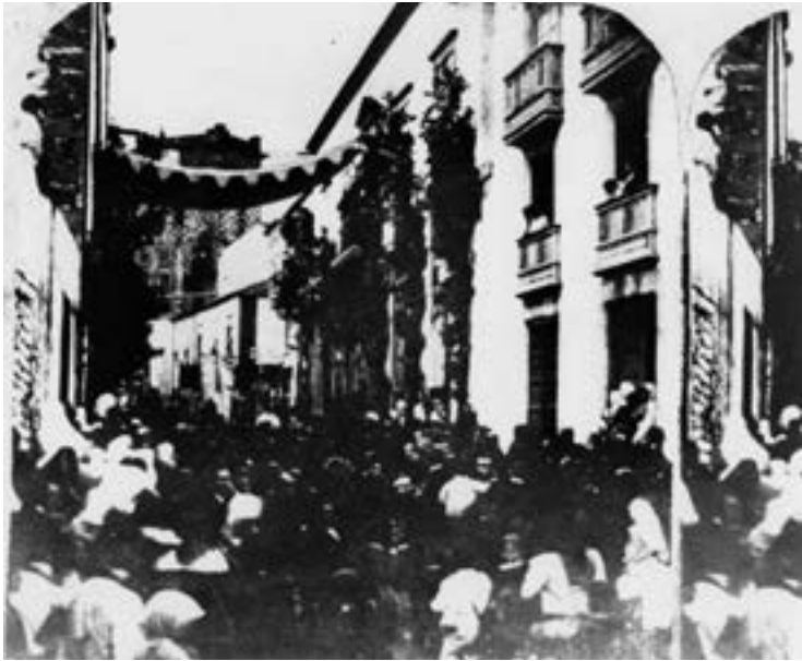
Procesión de Pascua de Resurrección (ca. 1857) [AJGRE]

estaciones del Jueves Santo 9 . En 1862 se reclaman al marqués de Guisla-Guiselin varios documentos y antecedentes referidos a esta cofradía y en 1856 consta que funcionaba con regularidad y la componían treinta y siete congregantes 10 .