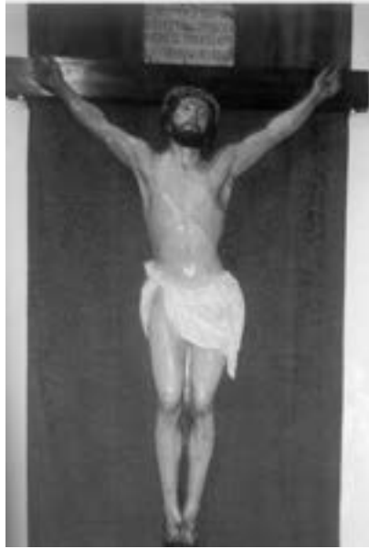
Crucificado de la Misericordia. Manuel Díaz (siglo XIX) [AJGRE]

una efigie de candelero (hoy desaparecida) un tanto tosca de María Magdalena , de papel encolado y melena de cabello natural, creada ex profeso para la procesión del Santo Entierro, donde procesionará hasta 1945 35 .