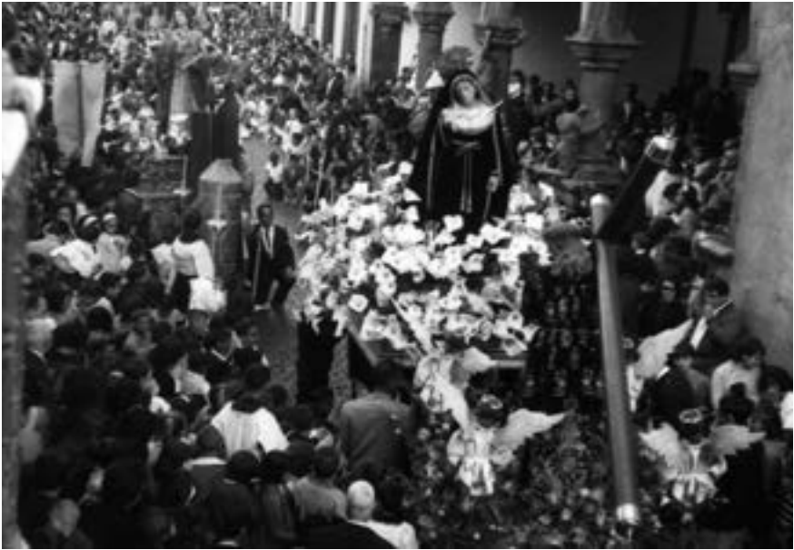
Punto en la plaza (ca. 1965), con las imágenes de Estévez y El Morenito (siglo XIX) [AJGRE]

y manto rojo, y como era tradicional desde el siglo XIV, con pluma y pergamino en sus manos, indicadores de que estamos ante el auténtico notario de la Pasión.