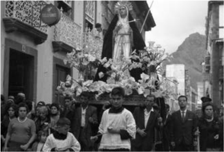
Virgen de la Esperanza en la procesión de Señor de la Columna (ca. 1970) [AIGRE]

contribuyen los cambios socioeconómicos, la crisis de valores y de las familias, la secularización de la sociedad y la independencia de la juventud 102 . La cofradía de La Pasión desiste de procesionar ese año, y poco después también la de los Siete Dolores de Nuestra Señora. Alumbra entonces la latente media España profundamente anticatólica.