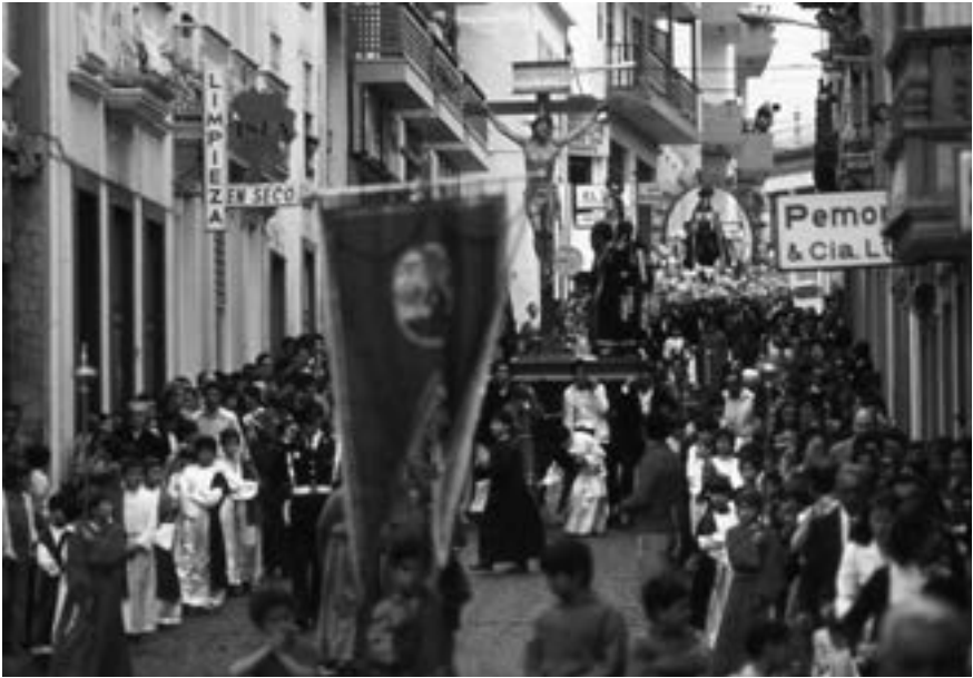
Procesión del Calvario (1976)