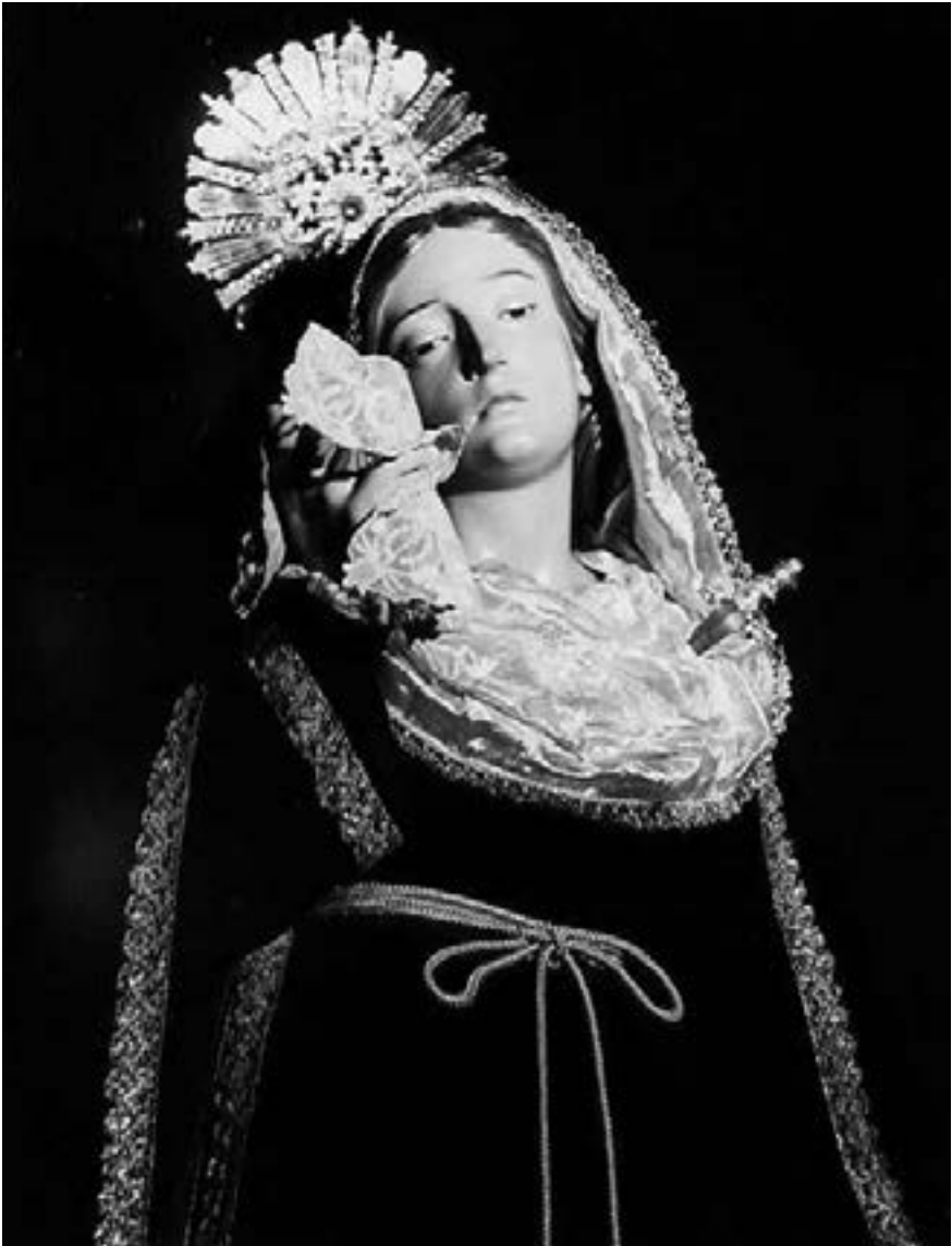
La Dolorosa (detalle). Fernando Estévez (siglo XIX) [AJGRE]