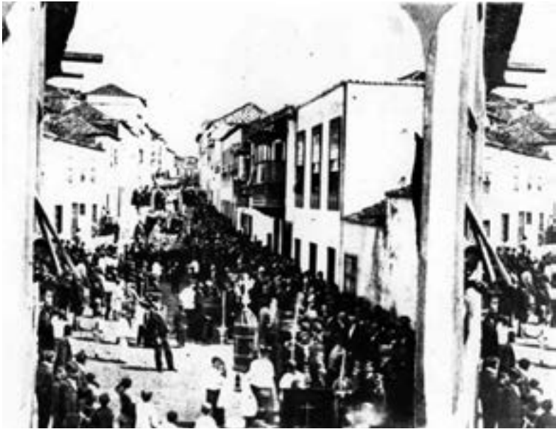
Procesión del Crucificado (1857) [AJGRE]

progresista), con nuevas medidas desamortizadoras que afectan directamente a las cofradías. A ello coadyuva el concordato suscrito con la Santa Sede el 22 de enero de 1851, que confirma el compromiso del estado español de atender el mantenimiento del culto y del clero como compensación por los bienes desamortizados. No en vano, las medidas desamortizadoras habían generado graves problemas para el mantenimiento del culto y del clero. En 1851 el obispo de Canarias Buenaventura Codina (1847-1857), sacerdote de la congregación de San Vicente de Paúl, clama al Ministerio de Gracia y Justicia que «las iglesias no tienen ni para comprar aceite para las lámparas. Se padece hambre y desnudez» 1 . Por fin, la etapa de la Restauración lo es también para la Semana Santa, que vuelve a celebrarse con asiduidad y sin los contratiempos de otras épocas, al menos hasta los primeros años de la