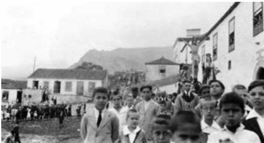
Procesión del Crucificado frente al Hospital de Dolores (ca. 1920) [EAH]