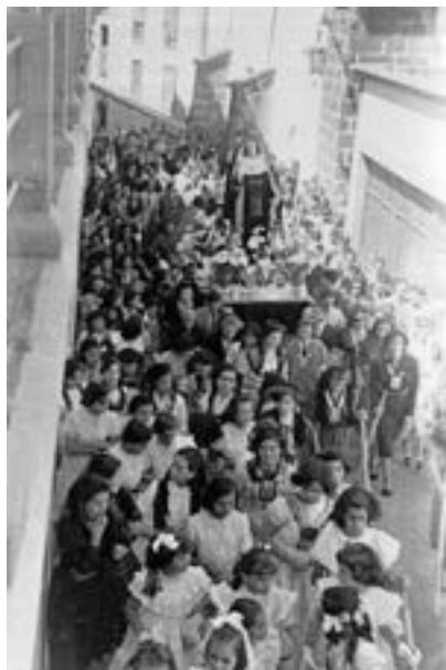
Procesión de La Caída (ca. 1949). Virgen de la Capilla [AJGRE]

vamente su estación de penitencia en la calle, acompañadas en corporación por la seráfica orden, año en el que la hermandad del Rosario participa también en la procesión del Santísimo Sacramento del Domingo de Pascua. En la Semana Santa de 1941 se escuchan incluso saetas cantadas al Redentor y a la Santísima Virgen a su paso por las calles de la ciudad 3 . Estas intervenciones espontáneas, a cargo por lo general de algún soldado de procedencia andaluza, van a ser en el futuro relativamente frecuentes durante la procesión del Nazareno o de la Piedra Fría .