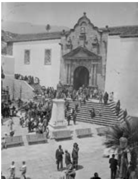
Procesión del Crucificado en la plaza de España (ca. 1910)