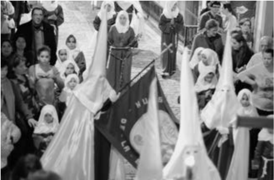
Cofradía de Nuestra Señora de la Esperanza (Antonio Pérez Concepción, 2011) [AFC]