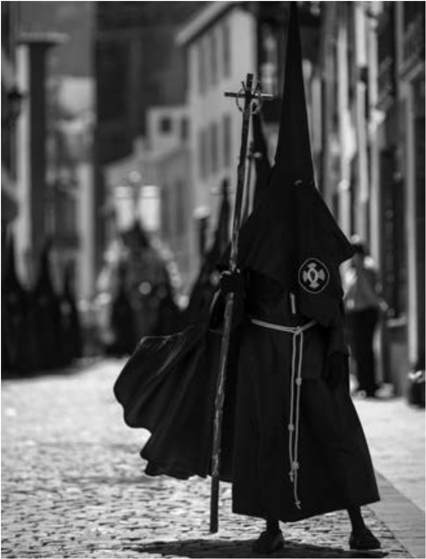
Cofradía de la Piedad (Álvaro Brito Pérez, 2013) [AFC]