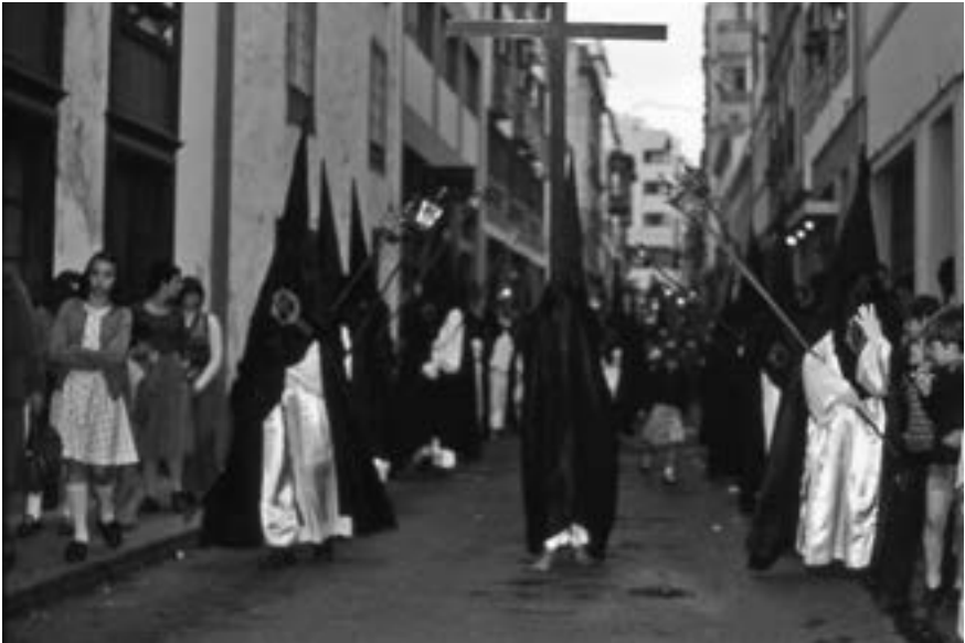
Procesión del Santo Entierro. Cofradía del Sto Sepulcro (1976) [AJGRE]

Santo. La «nueva Vera Cruz» (en su etapa primigenia, fundada en 1558) viste túnica de color blanco palo y capa y capuchón rojos. Su primer hermano mayor y fundador fue Facundo Daranas Ventura. Finalmente, la cofradía de la Verónica u Hosanna de niñas, fundada el 4 de abril de 1986, luce túnica azul, toga y cingulo blancos y sandalias de cuero. Una sencilla cruz de madera le sirve de escapulario y acompaña a la imagen de la Verónica en la procesión de la noche del Miércoles Santo, entre otras presencias.