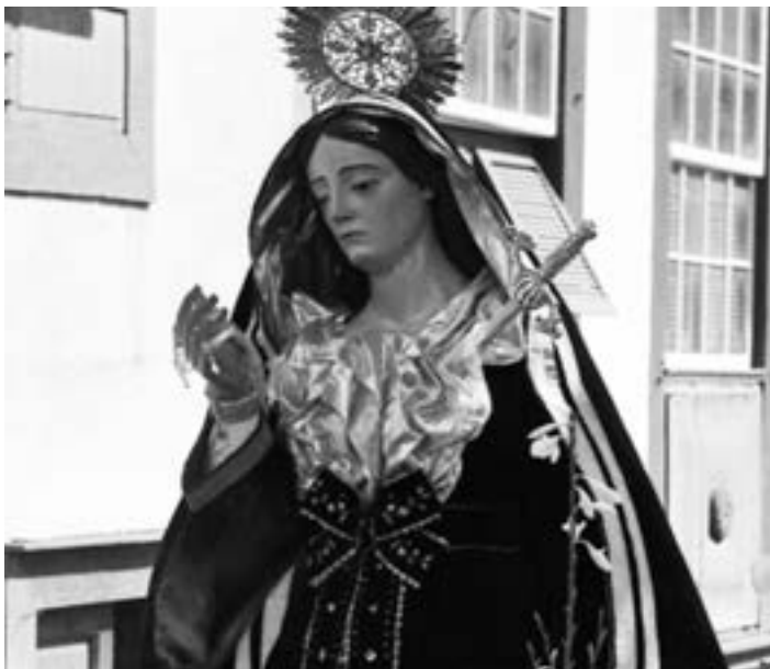
Virgen de la Capilla. Nicolás de las Casas (siglo XIX) [AJGRE]

teniente de las Milicias de La Palma. Bendecida el 26 de noviembre de 1862, la imagen tiene cierta originalidad en tanto que el artífice no repitió los esquemas de la escultura del bajo barroco 43 . También responden a sus cánones un San Juan Evangelista (ca. 1860), cincelado también para la v.o.t., del que solo se conservaba su cabeza y parte del torso (hoy felizmente restaurado), que acompaña al principio al Crucificado del señor Díaz, y otro San Juan , de la misma advocación, que se venera en la iglesia parroquial de San Mauro (Puntagorda).