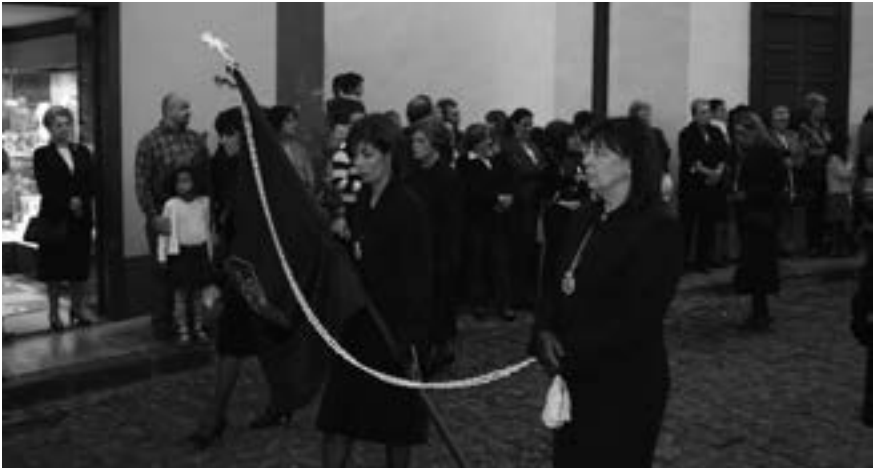
Cofradía de los Siete Dolores de Nuestra Señora, reorganizada en 1985 [AJJR]