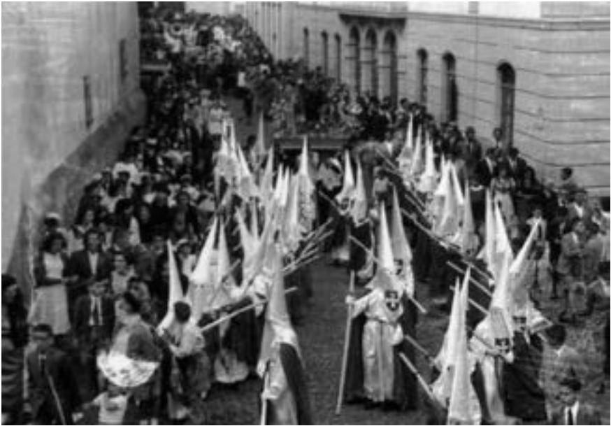
Cofradía de La Pasión (ca. 1960) [AJGRE]

nitenciales las dos primeras, y de damas o «manolas» 48 las otras dos. También se constituye una de las primeras cofradías de carácter eminentemente infantil, la de Hosanna de la parroquia de San Francisco, que se funda y desfila por primera vez en 1956, revestida con hábitos blanquiverdes 49 .