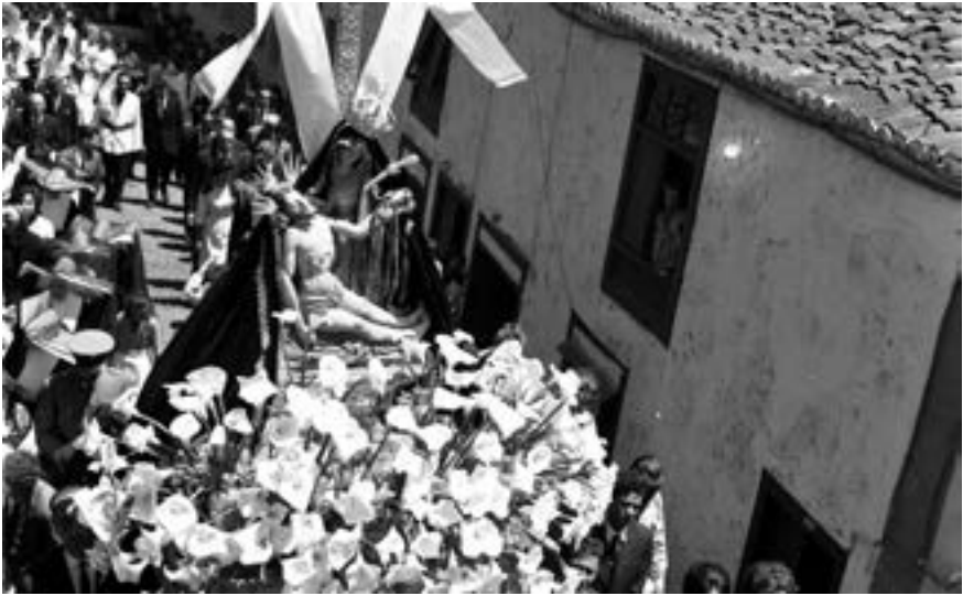
Procesión de la Piedad (ca. 1960) [AJGRE]

Solo los motetes dejan de interpretarse durante este periodo, debido, tal vez, al ocaso de la propia formación que últimamente los interpretaba, la Masa Coral de La Palma.