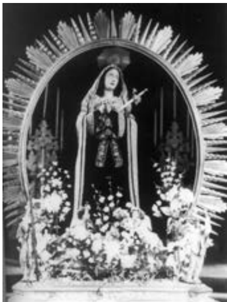
Virgen de la Soledad. Domingo Carmona (siglo XVIII) [AJGRE]

vive 63 . A Carmona se le atribuye asimismo otra de las Tres Marías del paso que desfila en la actualidad.