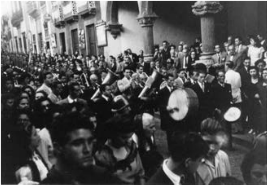
Banda de Música La Victoria (ca. 1949)