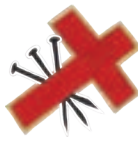
Cofradía de Nuestro Señor del Huerto