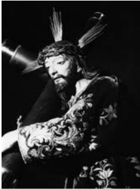
El Nazareno. Fernando Estévez (siglo XIX) [AIGRE]

En La Magna , también obra vestidera, se perciben mayores influencias de Luján Pérez, sobre todo de las Dolorosas de la iglesia de Santo Domingo de Las Palmas (sobre 1794) y de la ermita del Espíritu Santo, aunque es una obra típicamente esteviana: «...potentes mejillas, ojos rasgados y de mirada oblicua, quijadas portentosas y suavidad en el cabello» 68 . Para Delgado Campos, en esta imagen Estévez «da una auténtica lección de concentración, intimismo y sencillez en el gesto» 69 . Tarquis no duda en afirmar que esta Dolorosa es comparable a las de Luján Pérez y que este es el mayor elogio que puede hacerse de ella 70 .