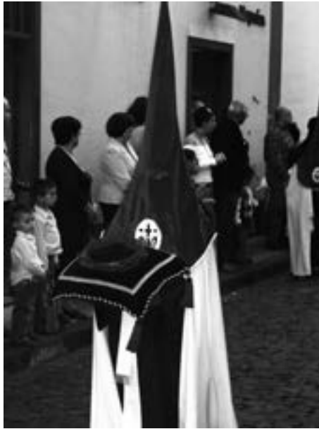
Cofrade de la Hermandad de Jesús Nazareno (2008) [AJJR]

gital FotoCofrade . La iniciativa cuenta desde un principio con una gran acogida y continúa celebrándose con mucho éxito hasta 2013. Asimismo, entre 2008 y 2009, renace el interés de las cofradías en la constitución de la primera Junta de Hermandades y Cofradías de Santa Cruz de La Palma, con la elaboración del primer proyecto de estatutos. El empuje, sin embargo, no es definitivo.