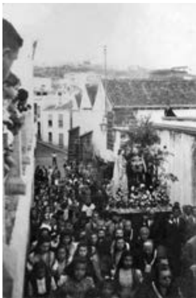
Procesión del Señor del Huerto (ca. 1949)