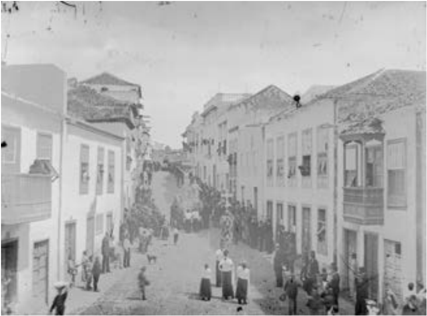
Procesión del Crucificado (ca. 1905) [AGP, RCH]

Todos estos oficios se practican antes de las ocho de la mañana, luego sobreviene el sermón de las tres horas o de las siete palabras a las dos y media de la tarde y al anochecer la ceremonia del santo entierro al regreso de la procesión. Además, los hermanos terciarios franciscanos mantienen su acostumbrado vía crucis, conocido como la Benedicta (una suerte de nocturno mariano heredado de la Edad Media), por las calles del entorno de su capilla, a partir de las seis de la mañana del Viernes Santo. Durante el Sábado Santo solo hay oficios en El Salvador, consistentes en la misa de Aleluya o de Gloria a las ocho de la mañana. Comprobamos, en fin, que de entre los templos de la capital, aparte de la parroquia matriz, es la iglesia del Hospital de Dolores (y por momentos la propia capilla de los hermanos terciarios franciscanos), la que tiene un papel más destacado, muy por encima de la iglesia de San Francisco, que solo acoge la salida de la procesión del Crucificado la mañana del Viernes Santo.