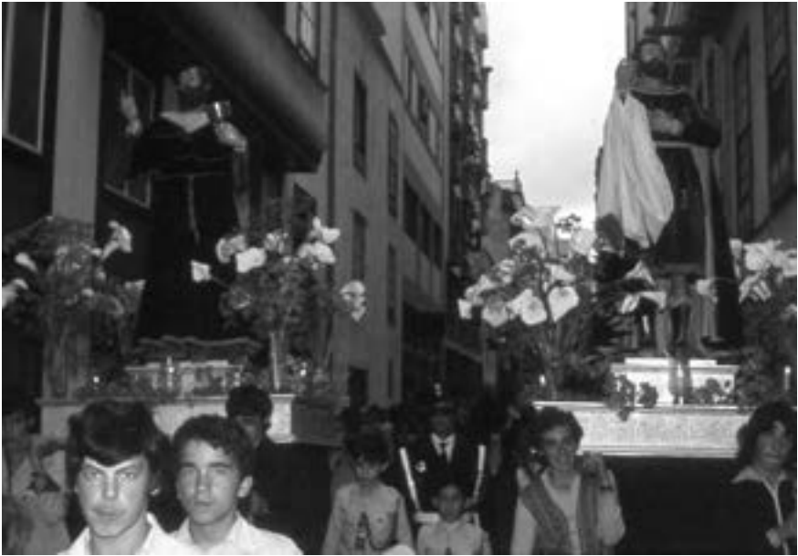
Los Santos Varones (en andas separadas). Santo Entierro (1976)