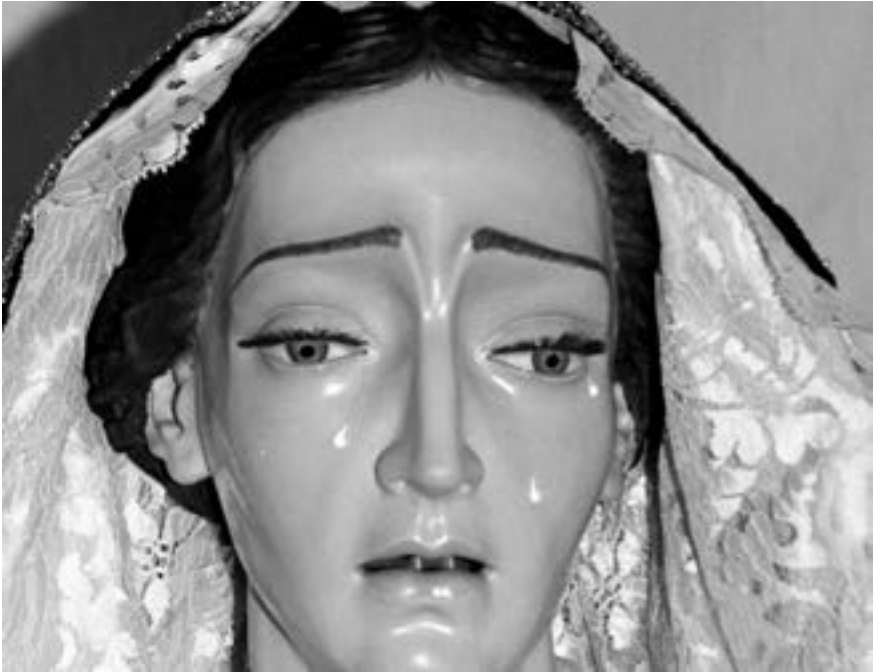
Nuestra Señora de la Luz de la Pasión. Rodríguez Perdomo (1995) [RL]

Viernes Santo: Vía crucis penitencial con el Cristo de las Siete Palabras , a las siete de la mañana desde El Salvador; procesión de la Dolorosa , a las nueve de la mañana desde La Encarnación; procesión del Calvario , a las once de la mañana desde San Francisco y de la Piedad , a la una del mediodía desde el Hospital de Dolores; procesión del Santísimo Cristo del Amparo , a las cinco y media de la tarde desde Las Nieves; y magna procesión del Santo Entierro, a las siete de la tarde desde El Salvador 13 . Los cultos del día se celebran entre las cuatro y cinco y media de la tarde en Las Nieves, Santo Cristo de Calcinas, Hospital de Dolores, La Encarnación, El Salvador y San Francisco.