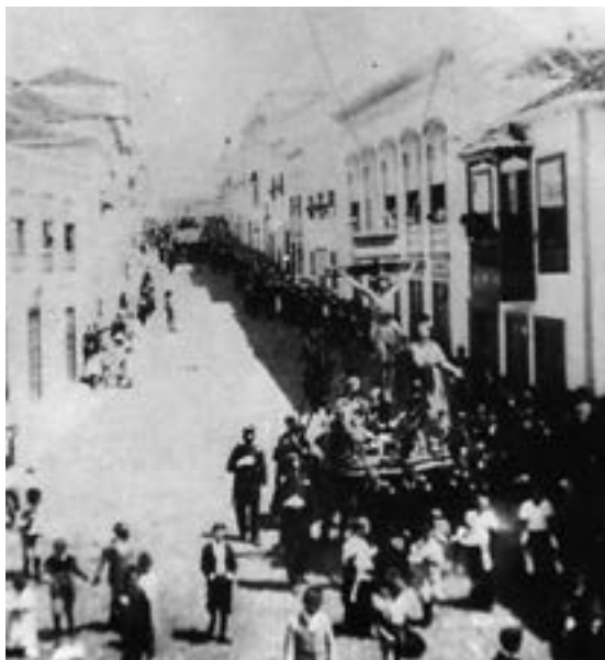
Procesión del Calvario (ca. 1915) [AJGRE]

lo racional, constituye igualmente el Derecho canónico vigente, no necesitando los Paúles más que la licencia del Párroco para la procesión, si no se la da el Obispo... 19 .