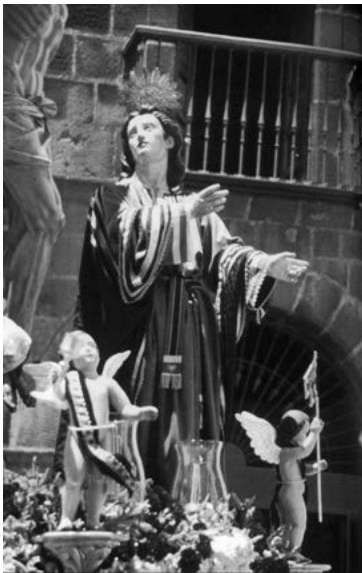
San Juan Evangelista. Aurelio Carmona (siglo XIX) [AJGRE]