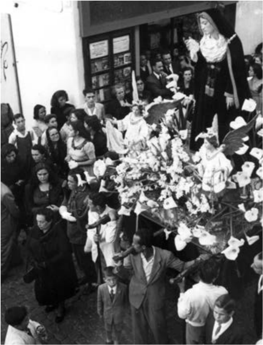
Dolorosa en el Santo Entierro, ca. 1955 [AJGRE]