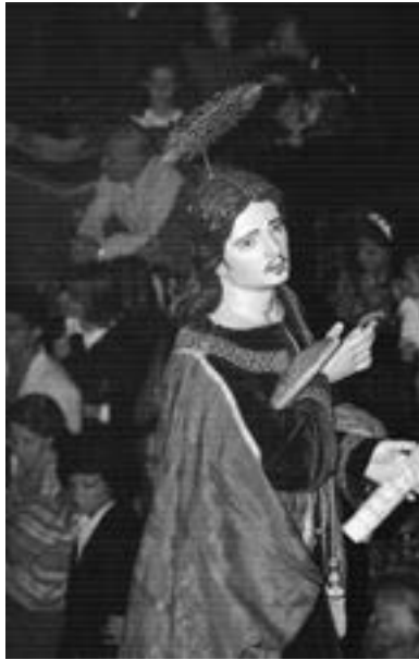
San Juan. El Morenito (siglo XIX)

Virgen del Carmen y la Virgen de las Angustias , ambas en Las Palmas de Gran Canaria) 84 . Probablemente El Morenito y Díaz ya se conocieran con anterioridad, pues se sospecha que el grancanario estuvo en La Palma para estar al tanto de la labor que desarrollaba el ilustre sacerdote. La efigie vestidera, de 1,57 metros, fue costeada por el presbítero Esteban Van de Walle y Llerena y repite las líneas generales marcadas por su maestro, pese a que también se muestra con cierta actitud contemplativa y sublime, conjugando los métodos de Luján y el sentimiento de Estévez, algo propio del estilo de Hernández 85 . A esta efigie comienza a dársele culto el 12 de abril de 1843 y se procesiona con hábito de terciopelo verde