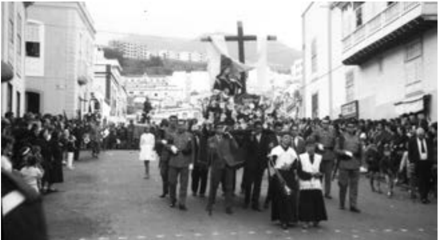
Procesión del Santo Entierro. La Magdalena (ca. 1965) [AJGRE]