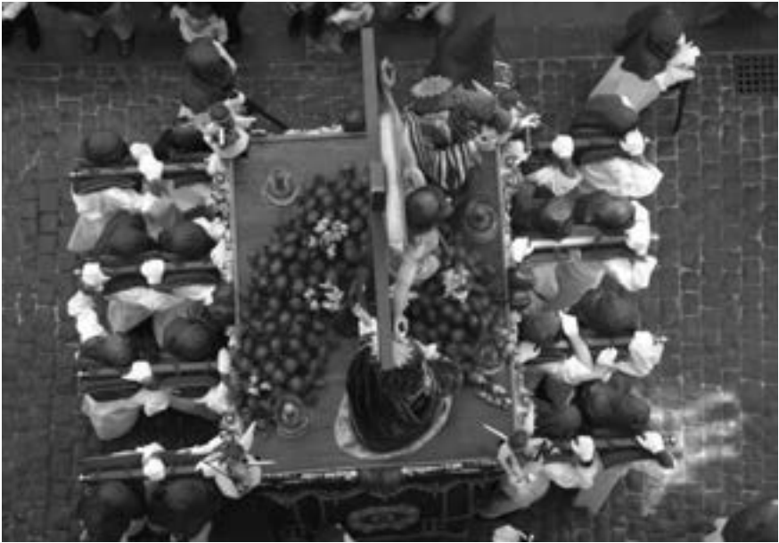
El Calvario y la cofradía de Nuestro Señor del Huerto (2013)[AFC]

que se deje de retribuir por «cargar» a Cristo, su principal finalidad, sino promover indirectamente la ampliación y mejora de tronos y andas.