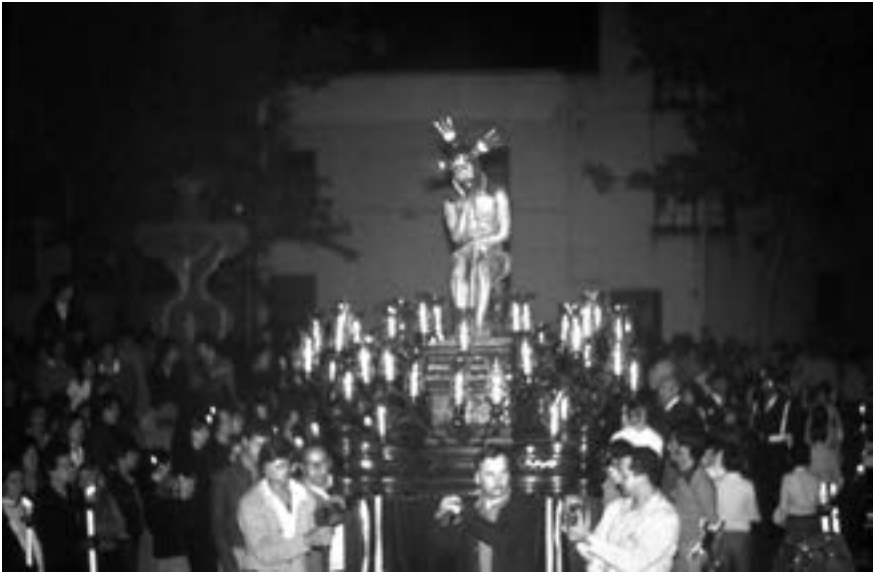
Procesión del Señor de la Piedra Fría (1976)