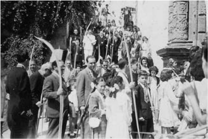
Procesión de Ramos desde Santo Domingo (ca. 1960)