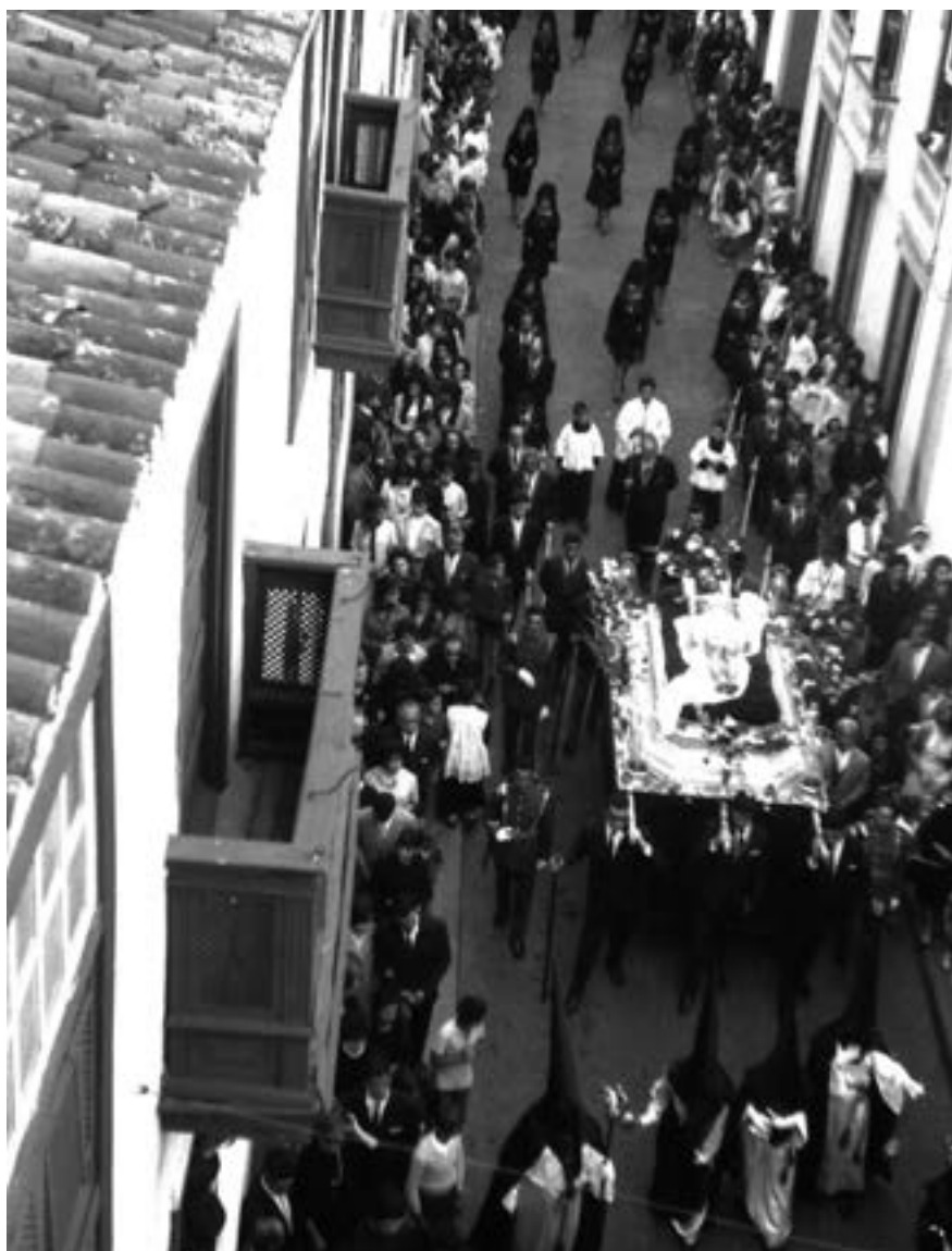
Santo Entierro. Señor Muertito (ca. 1960) [AJGRE]