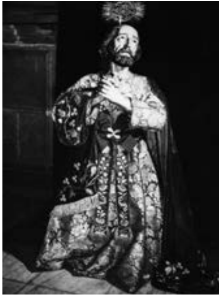
San Pedro penitente. Fernando Estévez (siglo XIX) [JGRE]

Hermandad de San Pedro, porque esta decidió desprenderse de ella por no ser del agrado de los hermanos que el Señor maniatado y San Pedro vistieran de igual forma. En 1827 el paso estrena andas 62 .