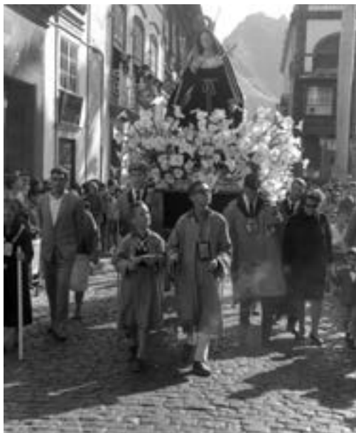
Virgen de la Capilla en la procesión del Señor de la Caída (ca. 1965)