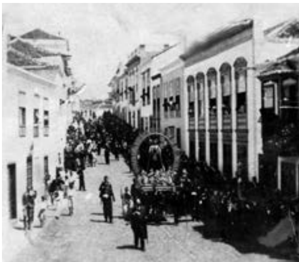
Virgen de la Soledad en la procesión del Calvario (ca. 1915) [AJGRE]