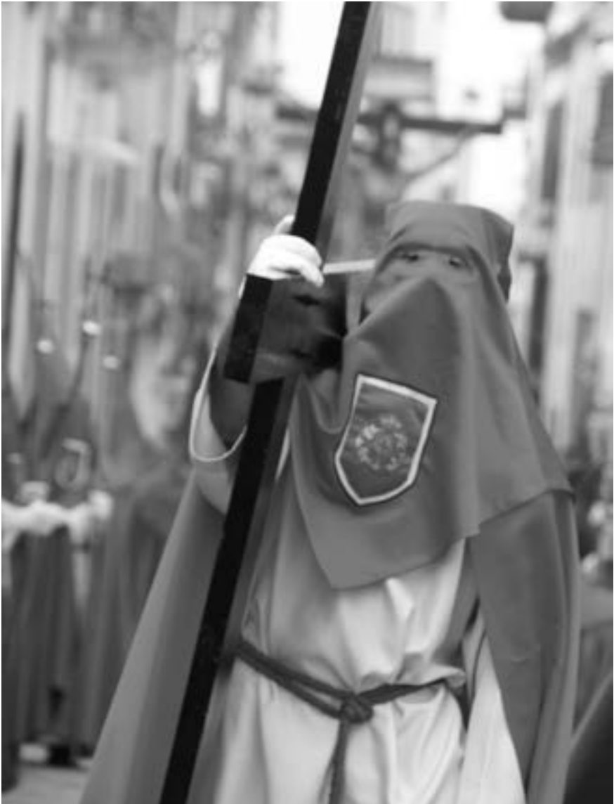
Nazareno de la cofradía del Crucificado y la Vera Cruz (Manuel Á. Martín Hernández, 2011) [AFC]