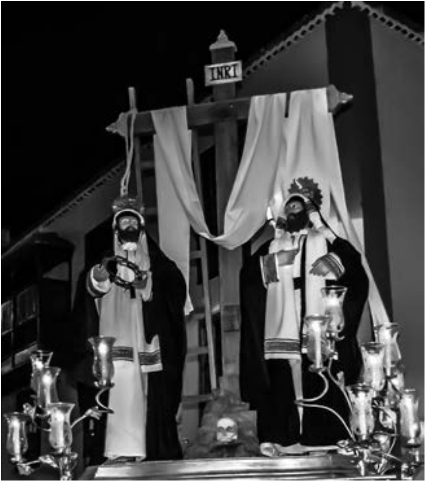
Los Santos Varones (David Amador de Paz, 2013) [AFC]