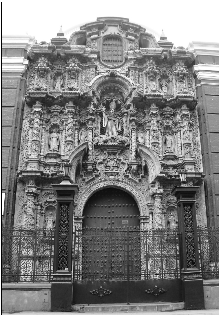
Fachada de la Iglesia de la Casa Grande de Lima, 1720