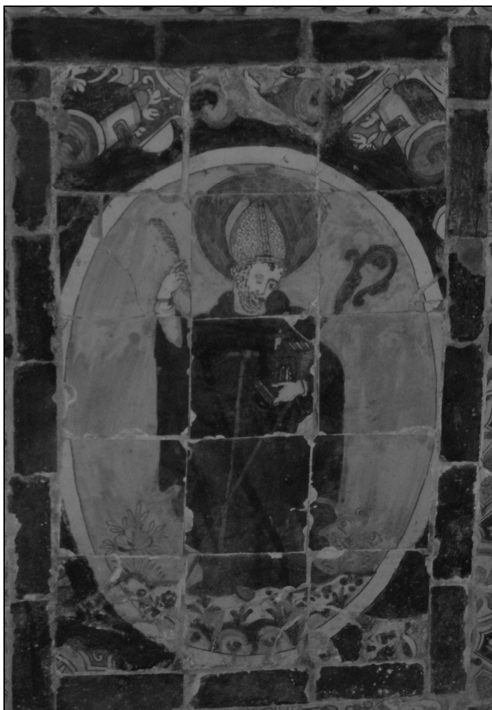
Panel cerámico del siglo XVII con la imagen de San Agustín Sacristía del convento de San Agustín de Lima