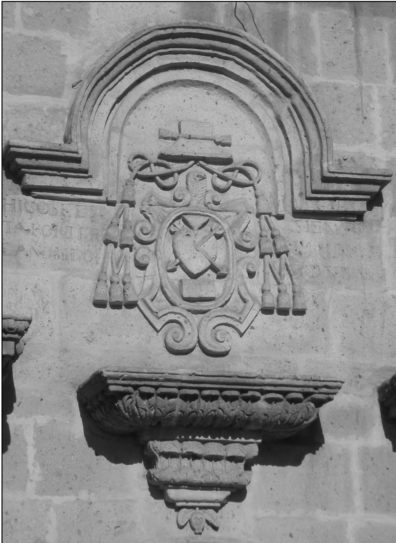
Escudo de la Orden de San Agustín. Antiguo convento de Arequipa