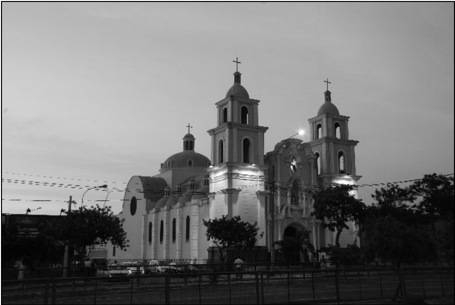
Iglesia del Monasterio de Ntra. Sra. de la Encarnación (Lima)