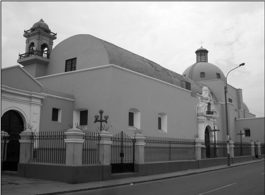
Iglesia del Monasterio de Ntra. Sra. del Prado (Lima)