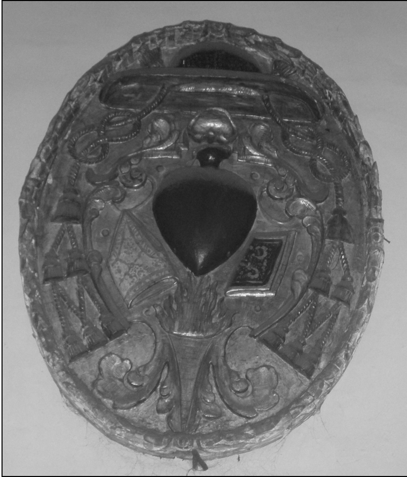
Escudo de la Orden de San Agustín. Antiguo convento de Trujillo