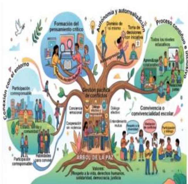
Figura 3. Características de la educación para la cultura de paz.