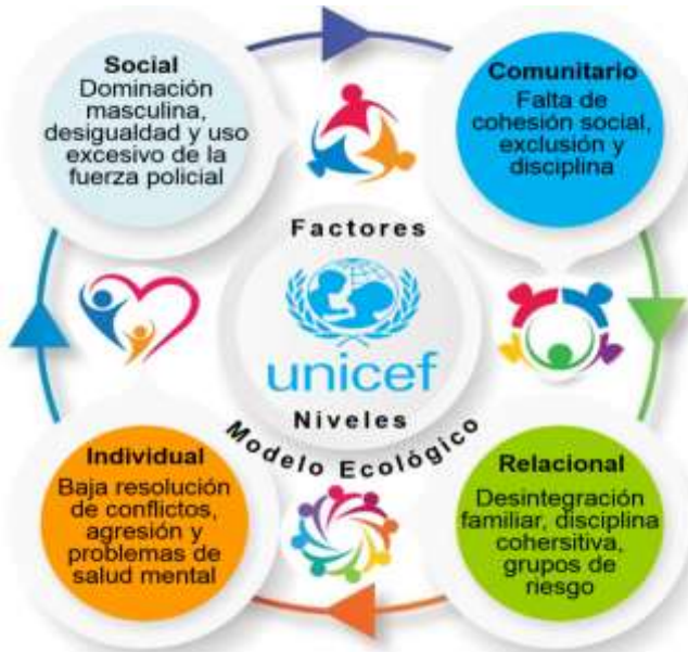
Figura 1. Factores intervinientes en la violencia según modelo ecológico de UNICEF Venezuela (2019)

comunidad educativa, con visión integral, no aislado, en la identificación de riesgos y su prevención efectiva.