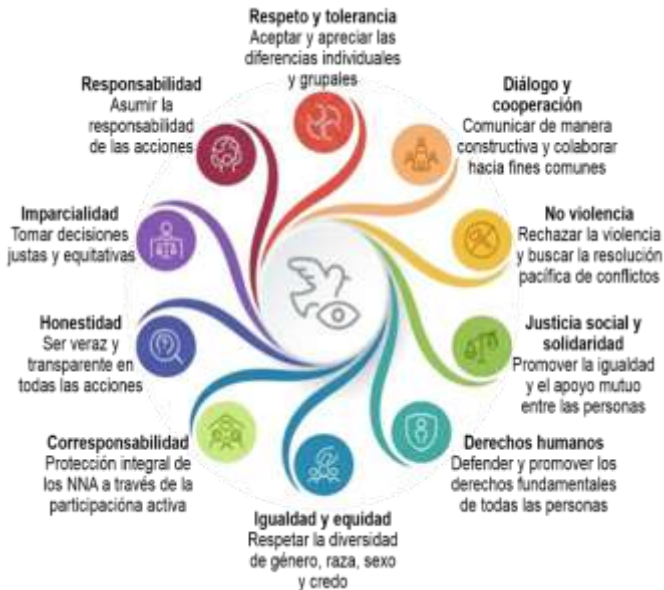
Figura 4. Principios y valores

iluminan el camino hacia la construcción de una educación en la cultura de paz.