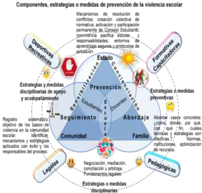
Figura 2. Estrategias de prevención de violencia escolar.

contra la violencia escolar en sinergia corresponsable de los actores implicados.