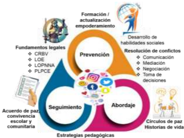
Figura 7. Estrategias positivas contra la violencia escolar

Aunado a ellos, las actividades deportivas recreativas, serán abordadas con perspectiva transdisciplinaria, tienden puentes entre el conocimiento, los saberes y haceres para un aprendizaje constructivo, significativo en la cultura de paz, convivencia pacífica que permite trascender realidades y desarrollar actos creativos, reflexivos. Aspectos que se aprecian en la figura 7, seguidamente.