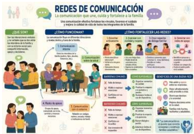
Figura 2. Redes de comunicación

Por ello, la enfermería debe considerar la comunicación como una herramienta terapéutica indispensable para promover familias más saludables y resilientes. En la figura 2 se objetivan las redes de comunicación que operan como el soporte vital que une, cuida y fortalece a la organización familiar.