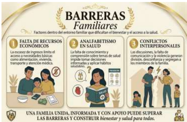
Figura 1. Barreras familiares

Desde la perspectiva de enfermería, reconocer estas dificultades permite desarrollar cuidados integrales y humanizados orientados a fortalecer las capacidades familiares y mejorar la calidad de vida. En consecuencia, la enfermería reafirma su compromiso con la promoción de entornos familiares saludables y con el acompañamiento de las familias en situaciones de vulnerabilidad.