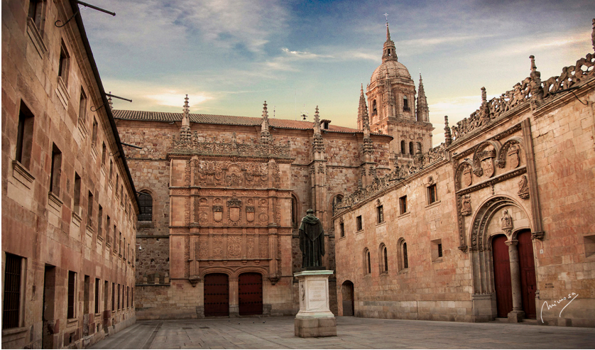
Universidad de Salamanca