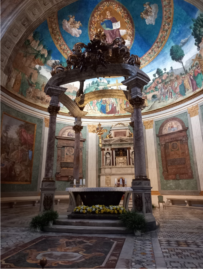
Interior de la Basílica