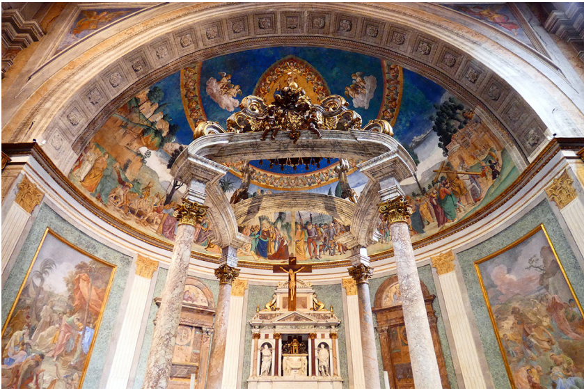
Fresco absidal con la representación de Bernardino López de Carvajal