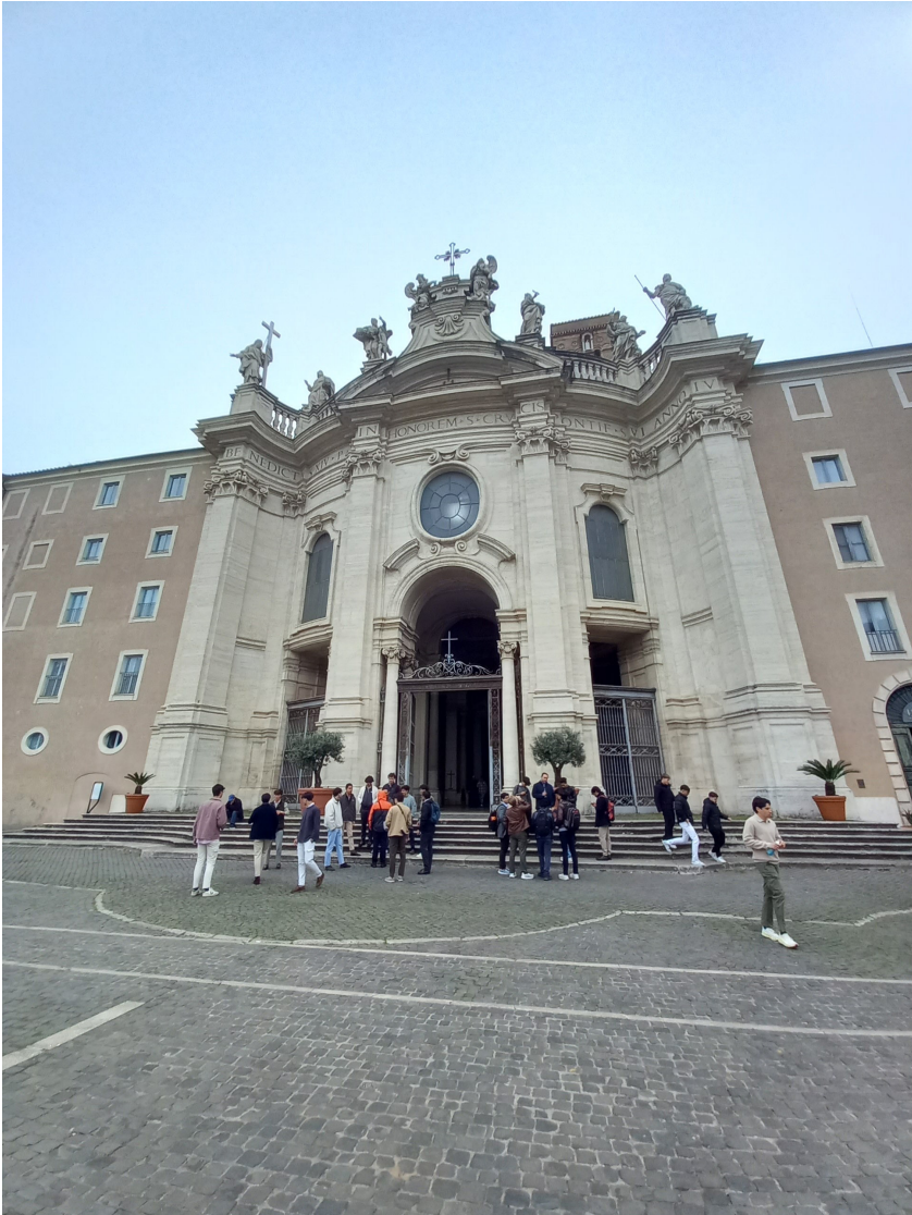
Basílica de la Santa Cruz de Jerusalén, Roma