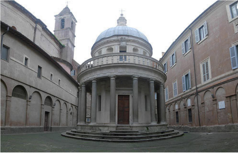
San Pietro in Montorio, Roma