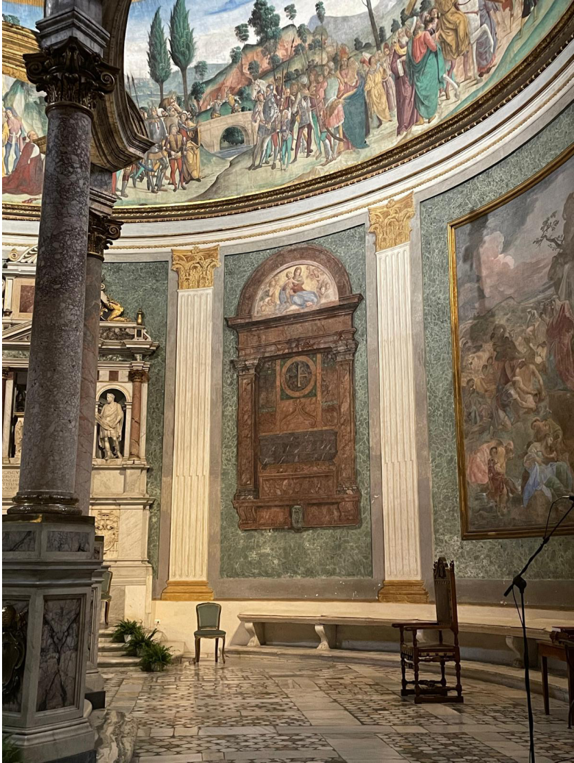
Sepultura de Bernardino López