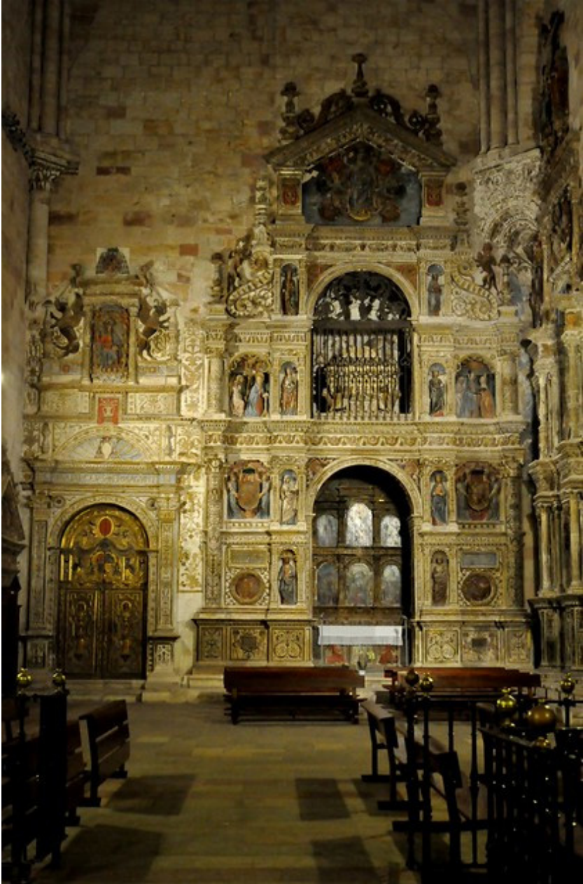
Catedral del Sigüenza, portada del Jaspe y retablo mayor