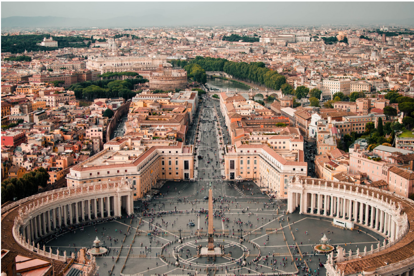
Ciudad del Vaticano