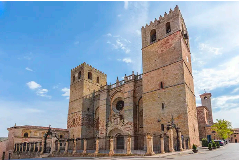
Catedral de Sigüenza