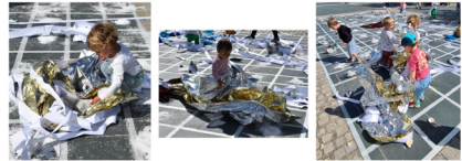
Figura 5: El juego simbólico