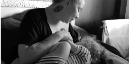
Figura 2. Los arrullos del océano.