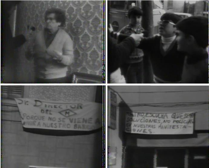
Imagen 4. Video Nou (1977). ¡Que viene el metro! (Projecte Can Serra) [vídeo, 24:30 min.]. Sitio web: HAMACA. https://www.hamacaonline.net/titles/que-viene-el-metro-projecte-can-serra/