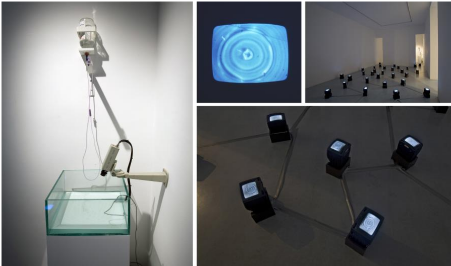
Imagen 1. Torres, F. (1969). Lluvia uniforme o más de una gota de agua [vídeo instalación, medidas variables]. Las imágenes proceden de la versión de la pieza realizada en 2010.

que incluso puede haber otra pieza más de videoarte en ese crucial año 1969 en nuestro país. Como se explica en dicho catálogo, coordinado por John Hanhardt, Lluvia uniforme o más de una gota de agua , de 1969, “fue el primer proyecto de vídeo realizado por Torres” (Hanhardt, 1991, p. 44). En él, siguiendo las propias palabras del artista, “una cámara de televisión en circuito cerrado registra el proceso de caída al agua de una gota también de agua y transmite esta información a varias pantallas de televisión distribuidas dentro de un determinado espacio cerrado” (p. 44). La obra fue versionada en otras ocasiones, como en 1973, 1996 y 2010 (Vozmediano, 2010).