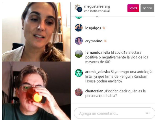
Imágenes 2 y 3.