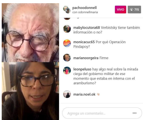
Imágenes 5 y 6. Fuente: captura de pantalla, Instagram Live, 16 de mayo de 2020.