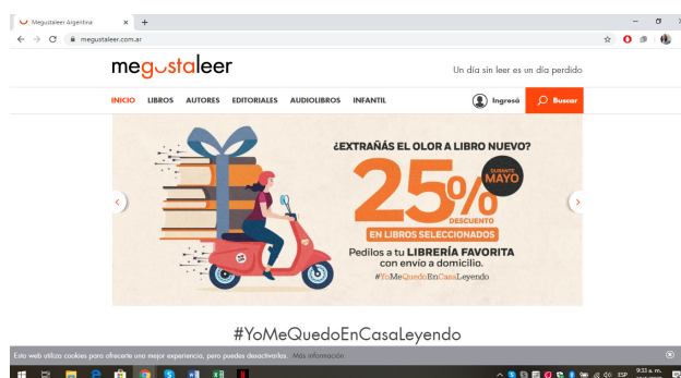
Imagen 1.

reconocidas–, entre otras. Las redes de la editorial más grande del mundo se renovaron, adaptaron y reconvirtieron en torno a la comunicación en el contexto de pandemia. Mediante la utilización del hashtag #YoMeQuedoEnCasaLeyendo, que imprimió todas las publicaciones y novedades de las cuentas de Facebook, Instagram y Twitter, Random House se «relanzó» como editorial para la difusión de libros y otros productos en pandemia.