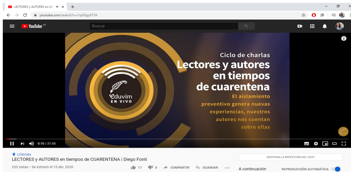
Imagen 7.

panorama de las actividades que realizan otros sellos con mayor captación del mercado como los ya expuestos, lo cual muestra la relevancia de las redes en cuanto que oportunidades para ampliar las ventas de la editorial. Tanto el ciclo llevado a cabo sobre el coronavirus como otros que se realizaron con posterioridad quedaron registrados en el canal de YouTube 6 como un repositorio o archivo editorial. Para su convocatoria es el propio director editorial quien utiliza WhatsApp según la segmentación de públicos y envía el link de acceso, lo cual se replica en la web del sello (Mihal, 2020), y algunas fotos de este u otros eventos se suelen subir a Facebook.