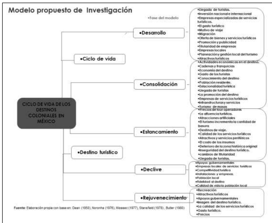
Figura 1.2 Modelo propuesto para el análisis de la fases del ciclo de vida de los destinos

Fuente: Elaboración propia en base a la revisión documental: Dean (1950), Noronha (1976), Moissec (1977), Stanfield 1978, y Butler (1980).