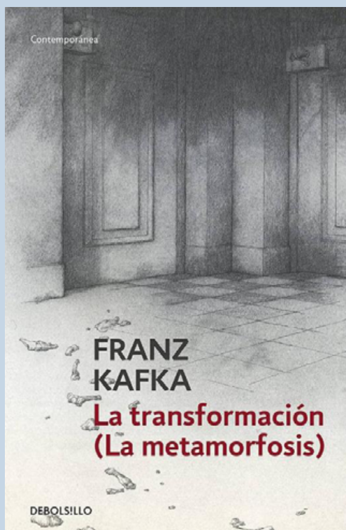
Fig. 1. Edición de La metamorfosis , cuyo título fue traducido como La transformación . Traducción de Juan José del Solar Bardelli, Barcelona 2005 y 2024.

Otra área significativa de investigación es la relación entre trabajo y subjetividad. Por ejemplo, Loy (2016) ha analizado cómo Gregorio Samsa, el protagonista de La metamorfosis , define su identidad a través de su rol laboral, mostrando más preocupación por su empleo que por su propia transformación física en un insecto. Este enfoque resalta la crítica de Kafka a la alienación del individuo en una sociedad dominada por el trabajo y las obligaciones económicas, y cómo esta alienación impacta las relaciones familiares y la identidad personal.