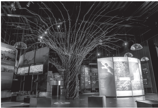
Figura 4. Fotografía del Caracol Museo de Ciencias (Nota. Fotografía de Alcaraz- Flores (2022) sobre la Sala de la Tierra del “Caracol Museo de Ciencias”, Ensenada, Baja California, México).

Museo “Caracol Museo de Ciencias” en la ciudad de Ensenada ( Ver Figura 4 ), fundado en 1988 con el nombre de Tecciztli de Baja California S.C., con una re-apertura en 2015, que implicó el cambio de nombre e instalaciones. Consta de tres salas permanentes: Sala del Mar y Acuario, Sala de la tierra, Sala del cielo, brinda talleres ambientales y de astronomía, así como proyecciones en domo. (Sistema de Información Cultural, 2023). Su objetivo es brindar un espacio para la divulgación y difusión de las ciencias y tecnologías, así como mostrar su aplicación a la vida cotidiana (Caracol Museo de Ciencias, 2023, párrafo 8).