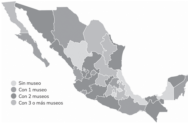
Figura 1. Distribución de Museos de ciencia y tecnología en México, 2018 (Nota. Alcaraz-Flores (2020), basado en la Estadística de Museo de 2018, del Instituto Nacional de Estadística y Geografía, 2017).

Reynoso (2012) observa que el que la sociedad posea conocimientos científicos y tecnológicos permite que sus habitantes gestionen de mejor forma tanto su política pública como su vida cotidiana.