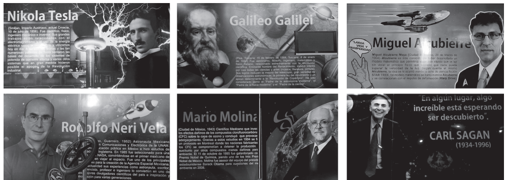
Figura 5. Cédulas sobre biografías de científicos destacados (Nota. Fotografías de Alcaraz-Flores (2022) sobre láminas informativas bibliográficas y de labor científico existentes en el museo Sol del Niño).

como se observa en la Figura 5 , es complicado entender la articulación entre las láminas de información biográfica de científicos.