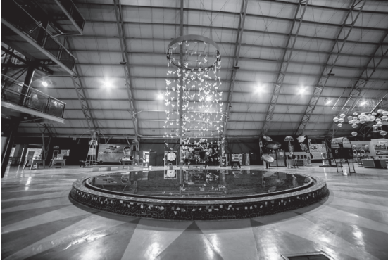
Figura 2. Fotografía del museo Sol del Niño (Nota. sobre el plano general de la sala principal del Museo “Sol del Niño”, Mexicali, Baja California, México).

analizó el material de la sala que en ese momento tenía por nombre “Más allá del cielo”.