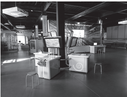
Figura 3. Fotografía del museo Trompo (Nota. Fotografía de Alcaraz- Flores (2022) sobre la Sala Integra del museo “Trompo”, Tijuana, Baja California, México).

Museo “El Trompo” en la ciudad de Tijuana (Ver Figura 3), fundado en 2008 con la intención de brindar un espacio educativo para transmitir conceptos de ciencias aplicables a la vida diaria. Cuenta con las siguientes salas permanentes: Sala Educa, Sala Experimenta, Sala Genera, Sala Integra, Sala Valora, así como con tres salas temporales. Brinda espacios para conciertos y conferencias, así como talleres de programación, robótica, ciencia, escritura y pintura, robótica infantil y programación de computadoras.