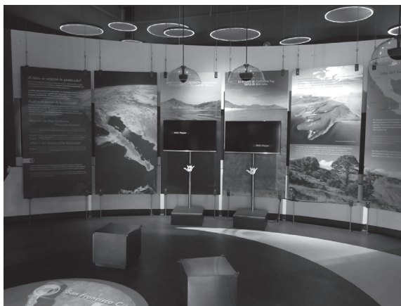
Figura 7. Cédulas sobre el origen de la Península de Baja California (Nota. Fotografías de Alcaraz-Flores (2022) sobre láminas informativas descriptivas acerca de la constitución de la península bajacaliforniana, Sala “De la tierra” - Caracol Museo de Ciencias).

Para Sala “De la tierra” del Caracol Museo de Ciencias las láminas de ilustraciones y fotografías representativas del territorio de la Baja funcionan como iconos descriptivos que permiten a los usuarios explorar visualmente otros territorios - hábitats de la región (Ver Figura 7).