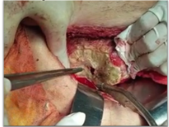
Figura 4. Hallazgos transquirúrgicos: pérdida de toda la cara posterior del injerto renal, con apertura de pelvis renal, con abundante fuga urinaria.

gran riesgo para la pérdida del injerto renal y para la vida del paciente en caso de no realizarse un tratamiento oportuno.