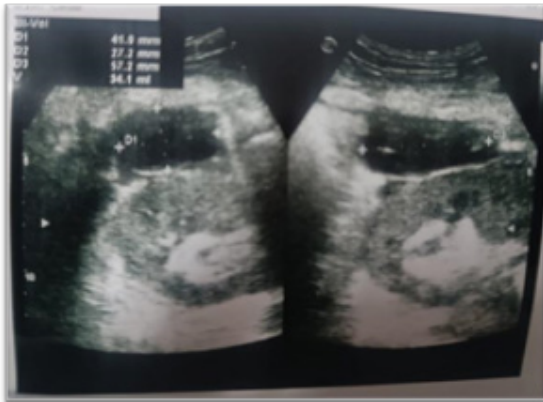
Figura 1. Ecografía del injerto renal, evidenciando colección peri y pararenal, con adecuada vasculatura del injerto.

se prefiere las técnicas de reimplante extravesicales, la preservación de la grasa periureteral y anastomosis arterial a la arteria iliaca externa, y a la vena iliaca común, como técnicas más protectoras para evitar complicaciones, además el tiempo quirúrgico es importante debido a que un tiempo más prolongado se asocia a mayores tasas de nefrectomía del trasplante 3 .