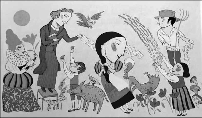
Mural dedicat al Rector, pintat per Ignasi Blanch i la gent de Vallfogona a la Plaça Francesc Vicent Garcia el dia 16 de juliol de 2023.