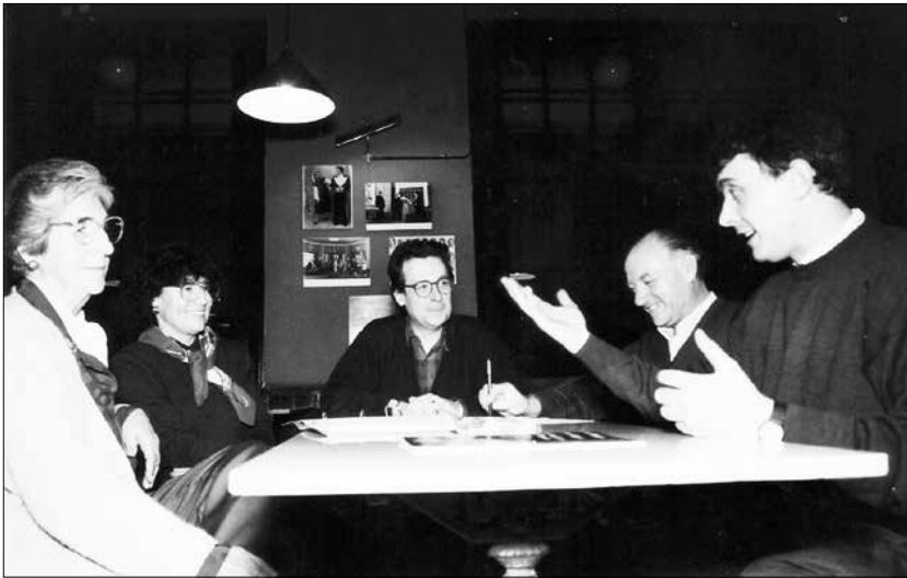
Amb els companys de l'Associació d'espectadors del Teatre Lliure (1993).