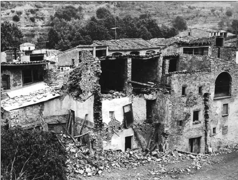
Imatge de Vallfogona en els moments de l'emigració. (1973)

menestrals a peu de carrer. Olors i sons li venen a la memòria, com el forn i el pa acabat de fer; el ferrer i el carreter, déus del foc i de l'enclusa; la perruquera i el barber, amb el seu assortiment de maquinetes i perfums; el fuster i la seva catifa permanent d'encenalls i serradures... I els pagesos, pantalons apedaçats, ells i espadenyes a retaló, elles. Cap al tros o cap a l'hort, de cacera o als safarejos i els diumenges i festius, ben mudats, a missa, al cafè i al cinema. Els nens i nenes, tot el dia eren al carrer. El gran escenari on passava tot: jocs, descoberta del terme, passar el riu per la palanca, les cabanes a l'obaga o als solans. L'escola i la doctrina, la sotana negra i arnada del rector. Sense oblidar el pas de les estacions: hiverns gebrats, glaçats o nevats; primavera esclatant, el collir cireres i piuladissa d'ocells de tota mena; el segar i el batre, el tràfec dels sacs de blat o d'ordi als casals durant l'estiu; i a la tardor, la verema: piar el raïm, el primer most, i la brisa que fermenta al cup. I a l'entrada d'hivern, bolets, magranes i la matança del porc, el mondongo i el rebost ple per passar el rigorós fred. I la vida i la mort: batejos i confits; enterraments d'albats, viàtics als moribunds i plors resignats als funerals endolats.