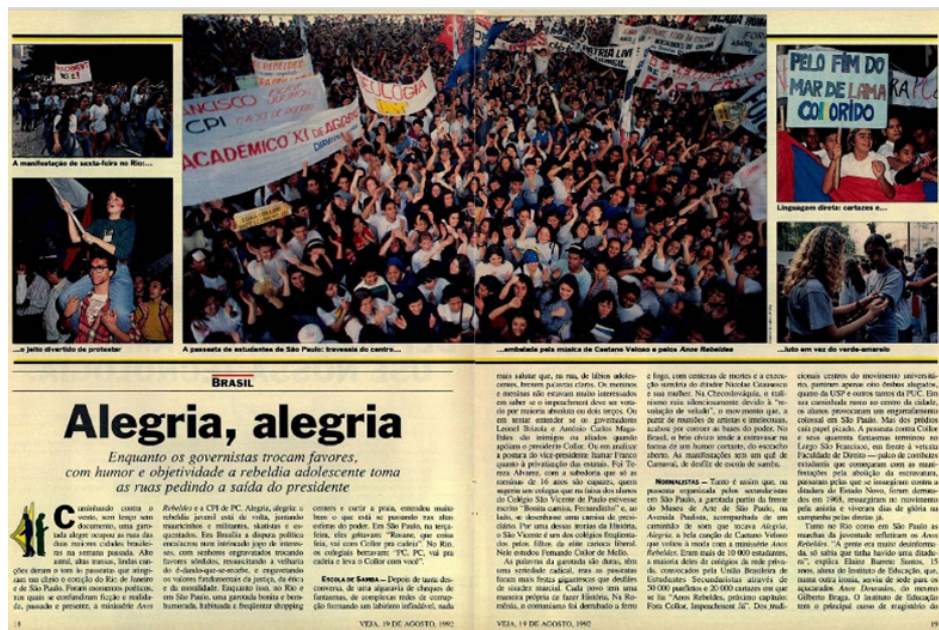
Figura 2. “Alegria, Alegria”

A grande foto ao centro da revista, de autoria de Egberto Nogueira, é da passeata ocorrida em São Paulo. Além dos secundaristas, pela pouca idade, há presença de universitários, pois diversas são as faixas que registram a participação de centros acadêmicos e/ou curso superior – duas do Centro Acadêmico XI de Agosto, do curso de Direito da USP, e outra do curso de Geologia da mesma instituição. Ao fundo, à direita, há um amontoado de faixas das quais pode-se ler apenas trechos como “Os estudantes de Carapicuíba... Fora Collor”, “Pátria livre”, “Nenhum