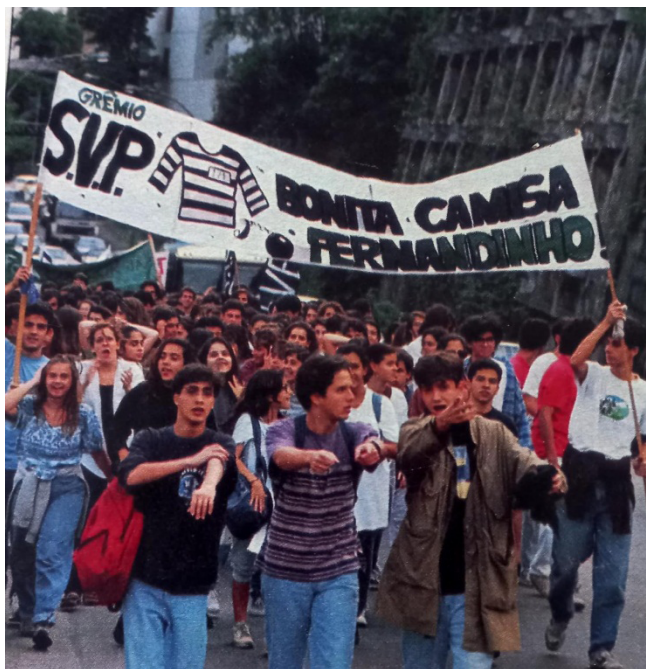
Figura 18. Estudantes do São Vicente de Paulo