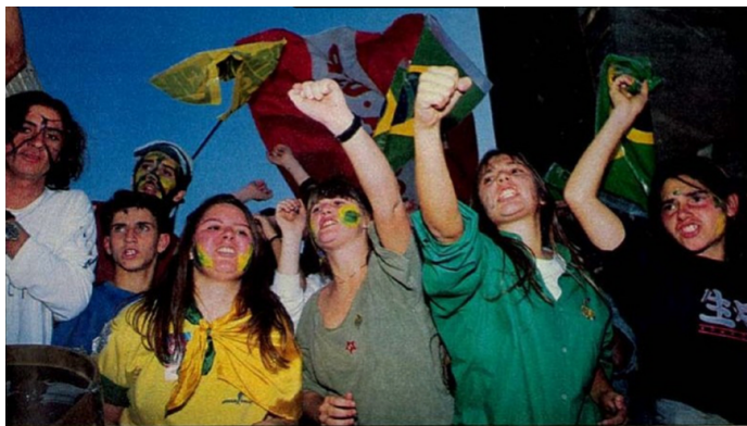
Figura 13. Jovens manifestantes