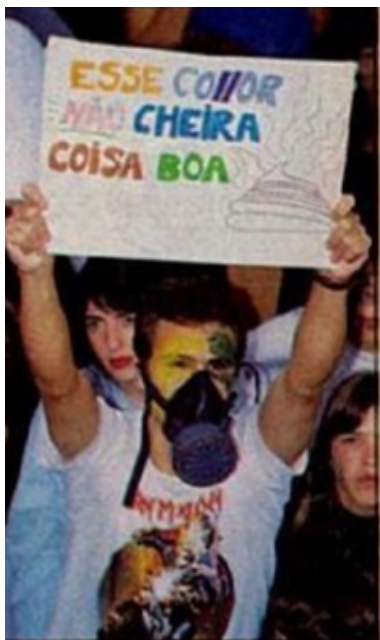
Figura 11. Manifestante com cartaz