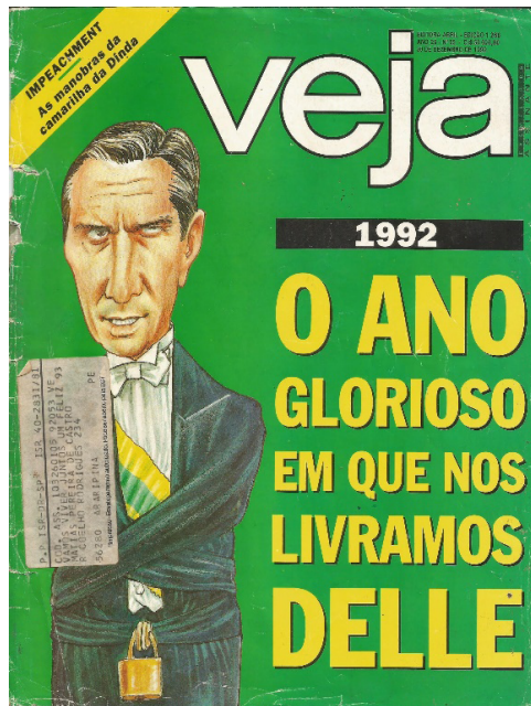
Figura 19. O ano glorioso