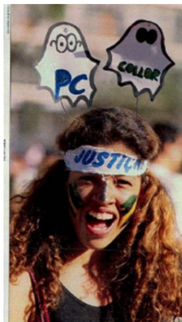
Figura 12. Jovem manifestante pedindo justiça