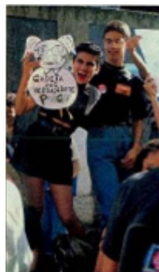
Figura 14. Manifestação em Recife