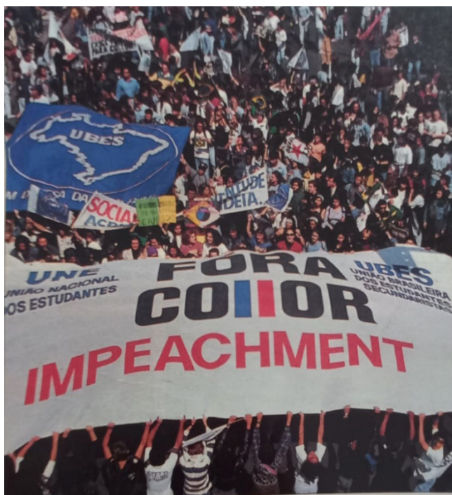
Figura 17. Cartaz impeachment