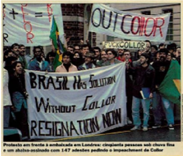
Figura 6. Protesto em Londres