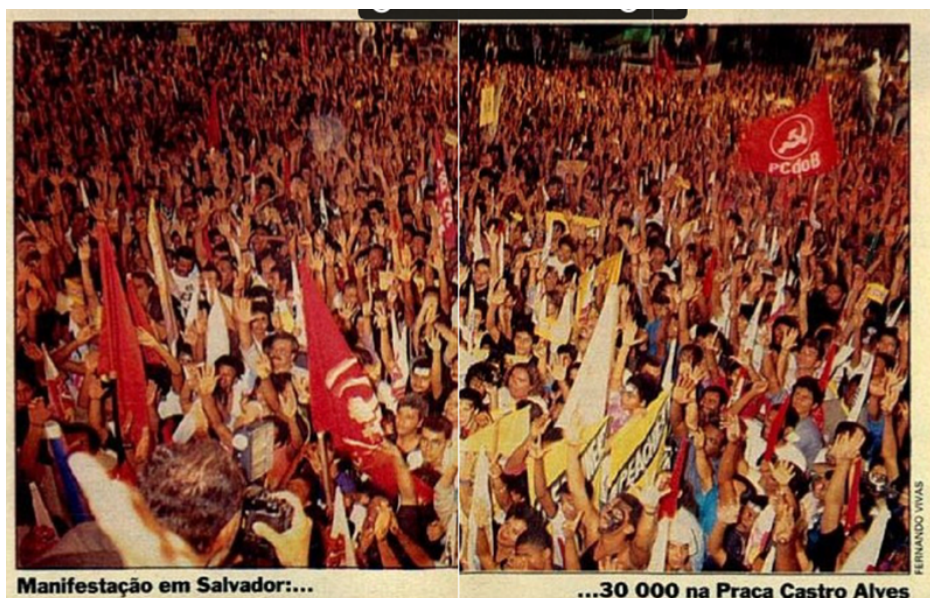
Figura 9. Manifestação em Salvador