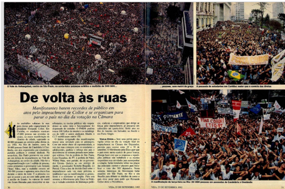
Figura 8. Manifestações em São Paulo, Rio de Janeiro e Curitiba