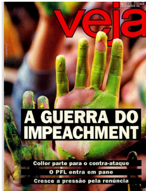
Figura 7. Capa da edição 1250 da revista Veja