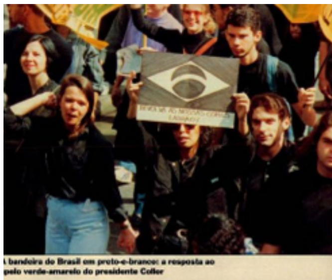
Figura 5. A bandeira do Brasil em preto e branco