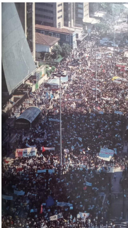
Figura 15. Avenida Paulista