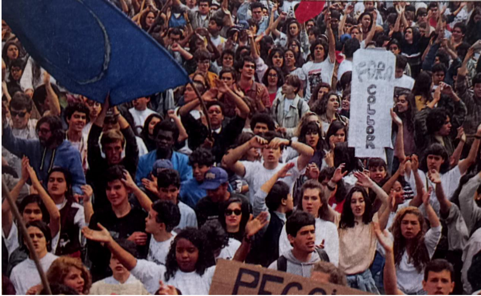
Figura 10. Manifestantes com cartazes