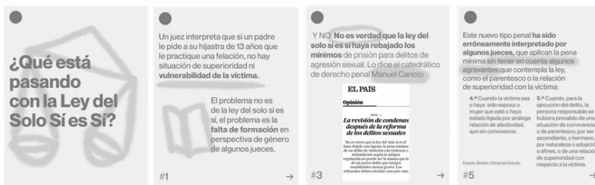
Figura 2: ¿Qué es la ley del “solo sí es sí”