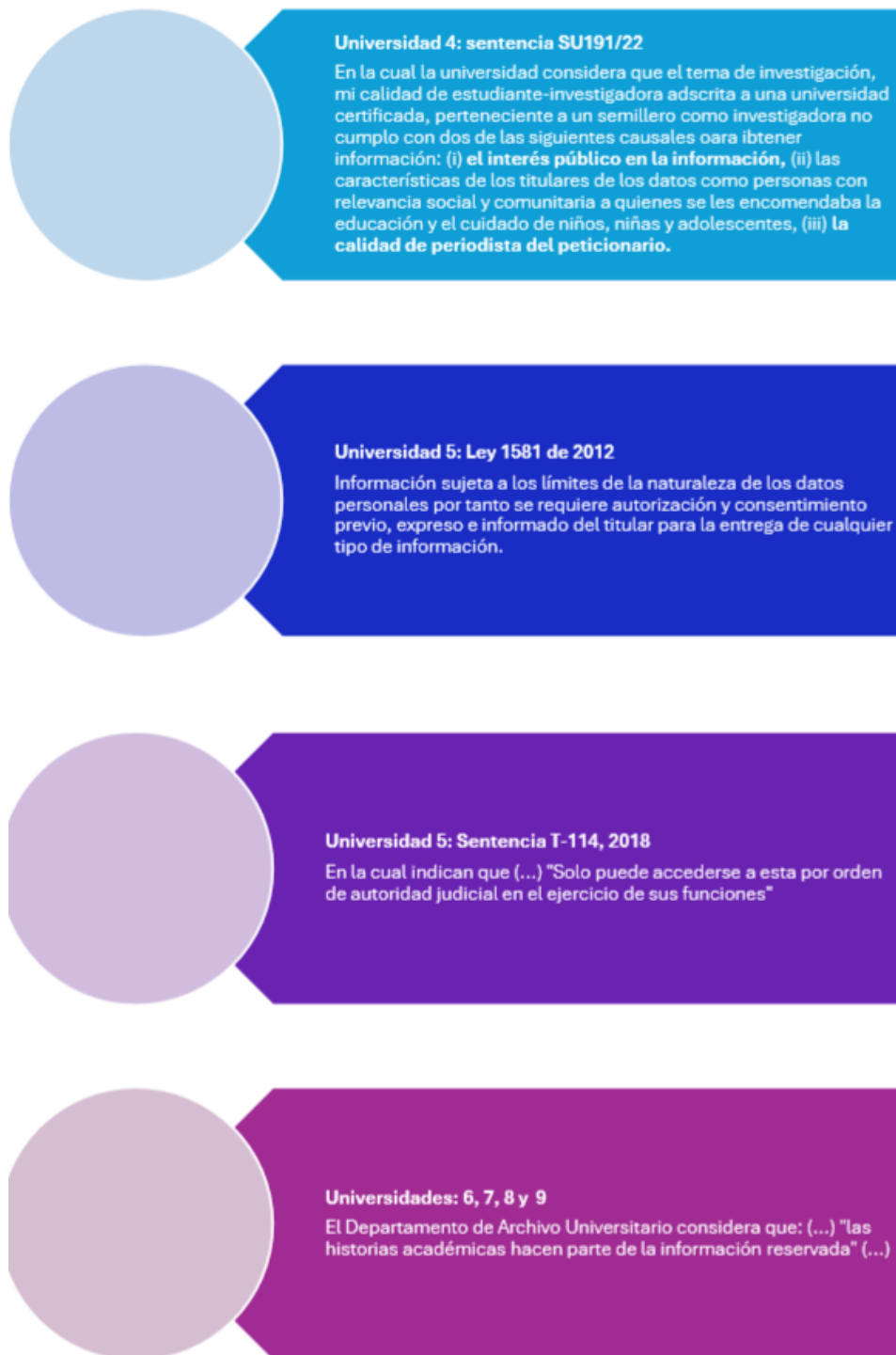
FIGURA 2. Justificaciones de IES para no brindar Información Estadística de Reportes de VBG Fuente: elaboración propia.