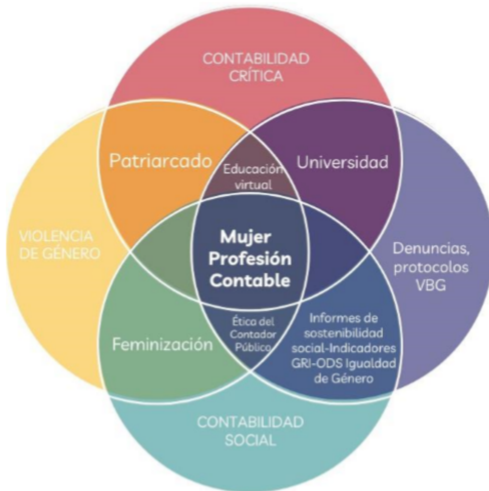
FIGURA 1. Búsqueda y exploración de información bases de datos

Para el análisis de las estructuras de VBG en estudiantes de Contaduría Pública en las modalidades distancia-virtual, fueron necesarias las entrevistas semiestructuradas a diez contadoras expertas en género en contabilidad, reconocidas como el 80 % de contadoras en Colombia que investigan en esa variable. Según Patiño et al. (2022) el número de investigadores con varias publicaciones en este tema son escasos; es decir, existen muchos académicos que investigan en género, pero pocos que se centran específicamente en la variable género en contabilidad. Por otro lado, fue necesario entrevistar a la coordinadora de bienestar de las universidades estudiadas. También se solicitó información a entidades como: MEN, CTCP y junto a ellos, a las IES en Bogotá que ofrecen Contaduría Pública con registro calificado, en modalidades virtual-distancia a febrero 2023, seleccionadas mediante muestreo a conveniencia de todas las universidades de Bogotá (ver tabla 1).