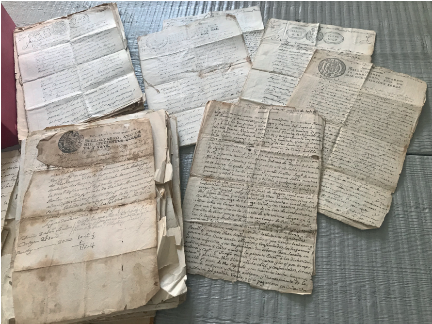
Detalle del fondo documental de Casa Manolico.

De los cuarenta documentos que forman parte de este archivo privado, seis pertenecen al siglo XVIII, veinticinco al XIX y nueve al XX. Todos son de carácter privado: predominan capitulaciones matrimoniales, testamentos, escrituras de compraventa de