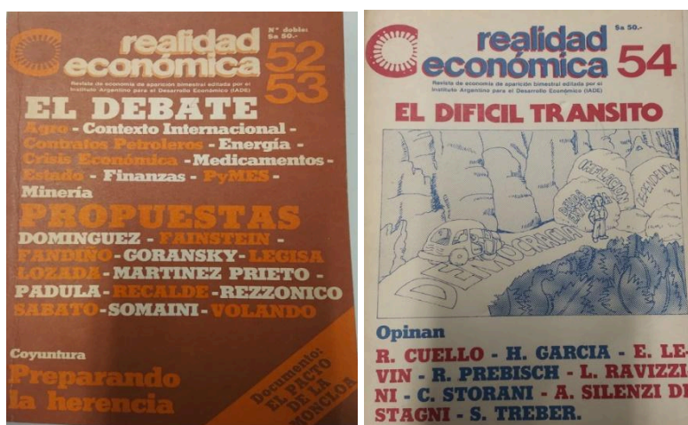
Imagen 1. Portadas de RE de los años 1984 y 1984. RE . Tapa. Núm. 52-53, 3er y 4to bimestre de 1983 y RE . Tapa. Núm. 54, 1er bimestre de 1984.

Sus portadas se caracterizaron por presentar una variedad de colores importante, que eran combinados con el título, el número correspondiente, los principales autores y algunos términos centrales del contexto político y económico como puede verse en la imagen 1.