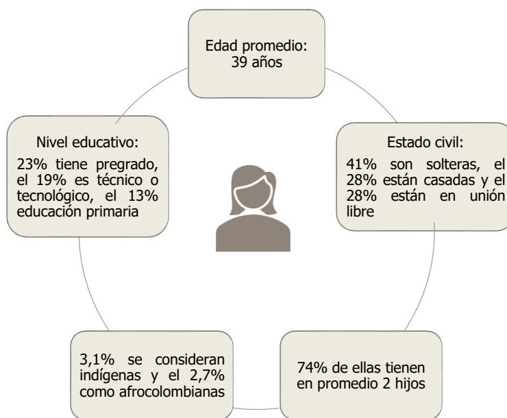
Figura 2. Identificación de las mujeres emprendedoras encuestadas

La características de la mujer emprendedora en la ciudad de Popayán muestra que es una mujer adulta, con una carga de cuidado elevada debido al número de hijos, su estado civil es soltera y con niveles de escolaridad bajo. Este perfil, podría explicar porque los emprendimientos en su mayoría se desarrollan en las viviendas y en el sector comercio donde hay un bajo nivel de valor agregado (Fajardo Hoyos et al, 2020).