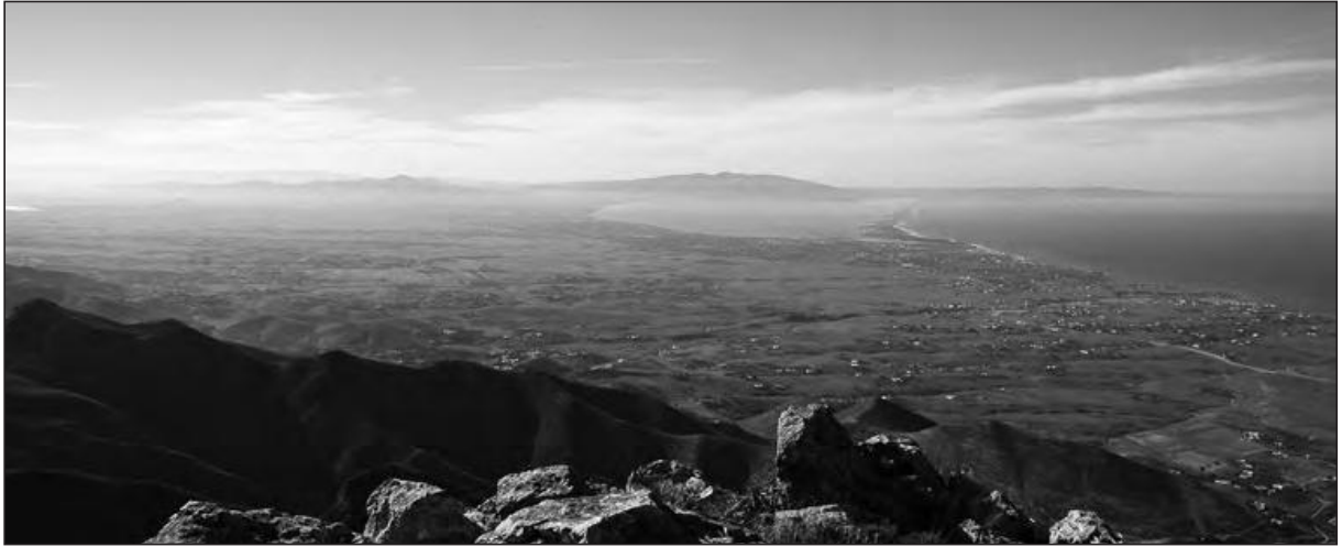
Figura 1.- Mar Chica. González Novo

El verano de 1921 fue testigo de una de las derrotas militares más terribles sufridas por el ejército español a lo largo de su historia. La política expansiva del alto comisariado de España en Marruecos Dámaso Berenguer, y la cual estaba encaminada al sometimiento del territorio del Protectorado, llevó a las fuerzas españolas al conocido como Desastre de Annual (22 de julio – 9 de agosto de 1921).