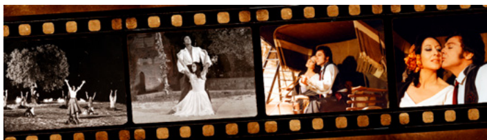
Figura 38. Plantilla celuloide amor brujo Guadix