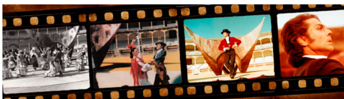
Figura 39. Plantilla celuloide taberna toro Ronda

En 1973 realiza una gira por España (Madrid, Sagunto y Benidorm) y de nuevo realiza otra grabación para Televisión Española, en esta ocasión para el programa «La gente quiere saber».