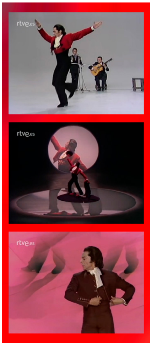
Figura 42. Gala Fin año 1975

También este año de 1975 participa en el "Gran Especial de Fin de Año" de Televisión Española en el que interpreta «Flamenco» y «Zapateado de Sarasate». (Figura 42)