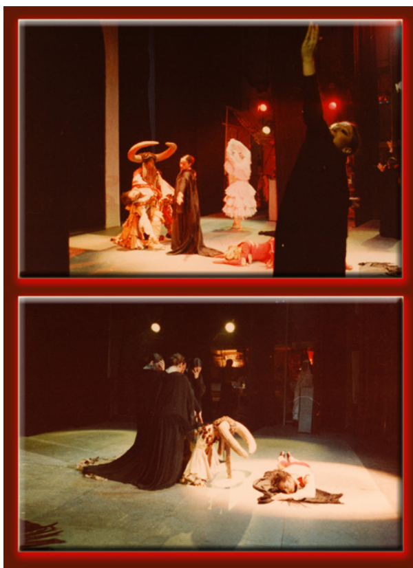
Figura 46. "La sangre derramada" Gira despedida 1978