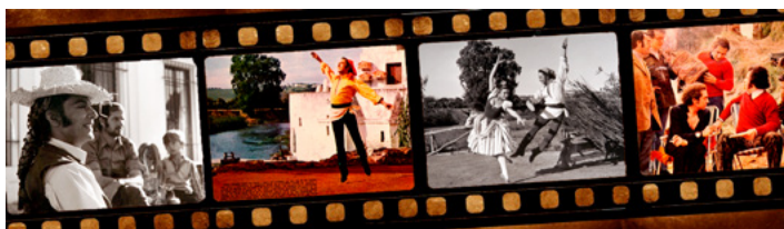
Figura 37. Plantilla celuloide sombrero arcos

También en 1972 realiza dos grabaciones para Televisión Española; una en el programa «360 Grados» dedicado a Pepa Flores y otra, como protagonista, en el programa «Siempre en domingo», grabado en su estudio de la Calle Coslada (Madrid), en el que realizan un recorrido por todas las estancias de dicho estudio, finalizando la grabación con su célebre "Zapateado" (música de Pablo Sarasate).