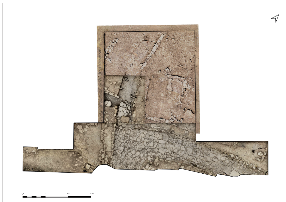
Figura 2. Fotomontaje con las imágenes fotogramétricas obtenidas en las distintas campañas de excavación realizadas en la Cata 1 del Sector I (2018, 2019, 2020 y 2023).

excavación se habían encontrado este tipo de materiales, como tampoco escorias. Particular interés tiene el hallazgo de una pelvis humana en un rincón de una habitación de la casa, cerca de la puerta, que sin duda corresponde a otra víctima civil del ataque militar sufrido por sus moradores tras la entrada de la milicia sertoriana en la ciudad.