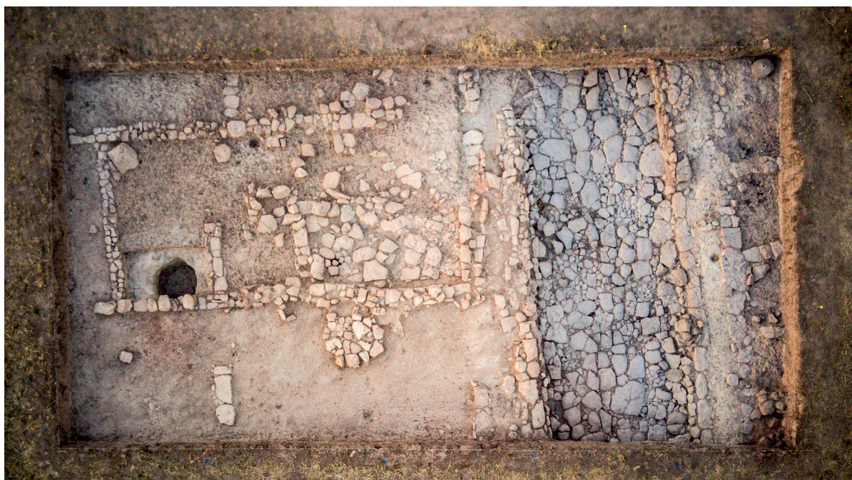
Figura 3. Foto aérea final de la Cata 4 del Sector II obtenida el 1 de septiembre de 2023.

no es muy buena dado que su potencialidad ha sido mermada por la presión agrícola desarrollada desde antiguo en esta parcela. Sin embargo, ha sido interesante comprobar cómo debajo de esta última fase constructiva sellada por el incendio que arrasó la ciudad aparece otra unidad estructural representada por una casa que inicialmente pudo ser más pequeña, de planta rectangular. Sospechamos que fue así porque dispone de un frente sobre la fachada que da a la calle, que tiene una compartimentación bipartita donde una de las dos estancias está enlosada, en idéntica disposición como las que descubrimos el año pasado en la Cata 3. Esto permite pensar que, en esta zona, quizás a principios del siglo I a. C. o al menos antes de las guerras sertorianas, se pudo construir una nueva vivienda de planta cuadrangular de tipo itálico por agregación de varias casas pareadas anteriores de planta rectangular. No obstante, esta interpretación queda abierta a la investigación futura que se pueda desarrollar en este sector del yacimiento, pues la excavación solo se ha desarrollado en una estancia de la casa