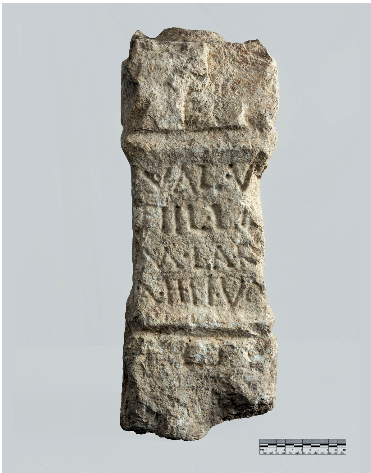
Figura 3. El ara romana de Larunbe, vista frontal. Autoría: Juantxo Egaña. 2023.