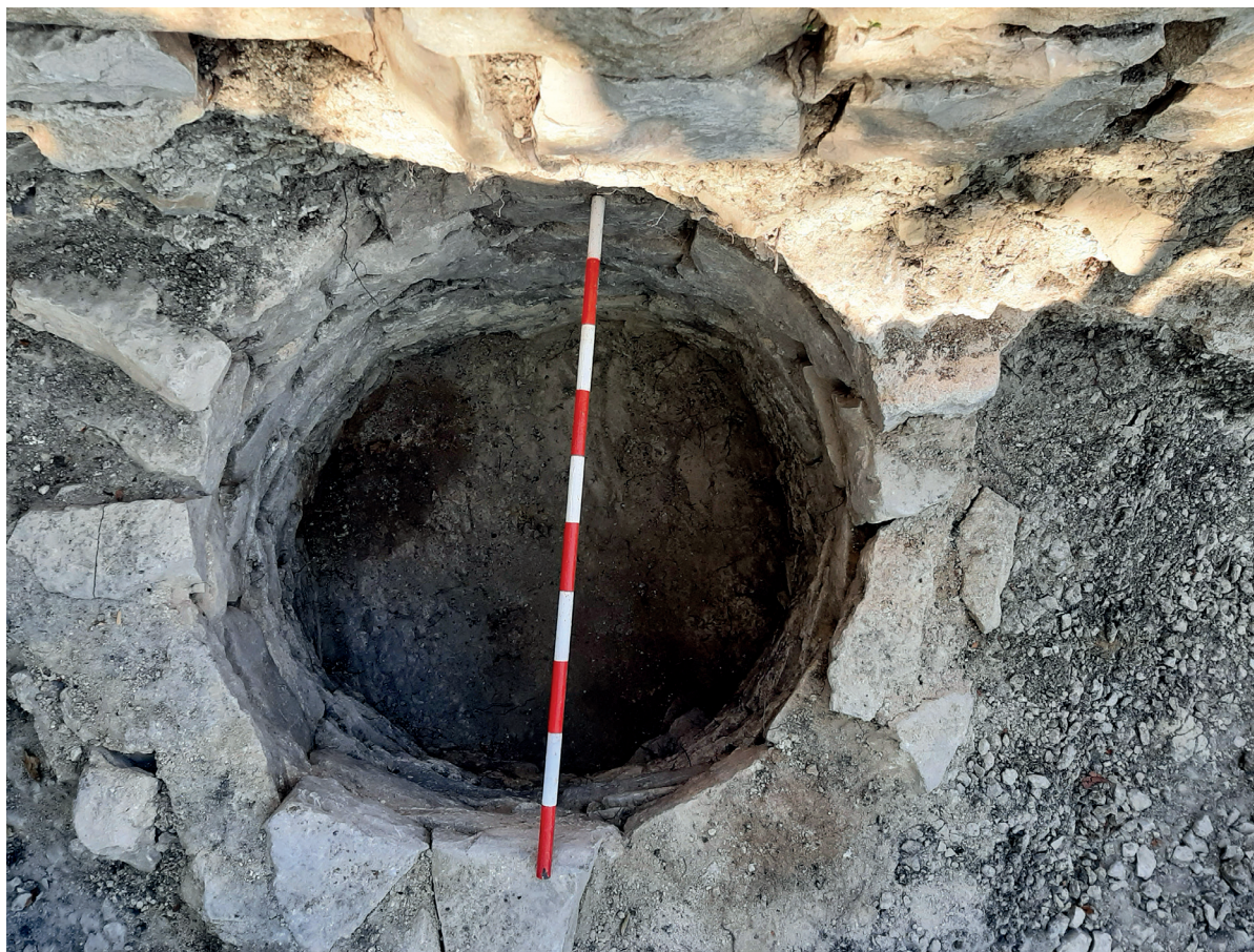
Figura 2. Vista cenital de embocadura e interior del pozo una vez extraído el sedimento. Autoría: J. Agirre-Mauleon. 2022.