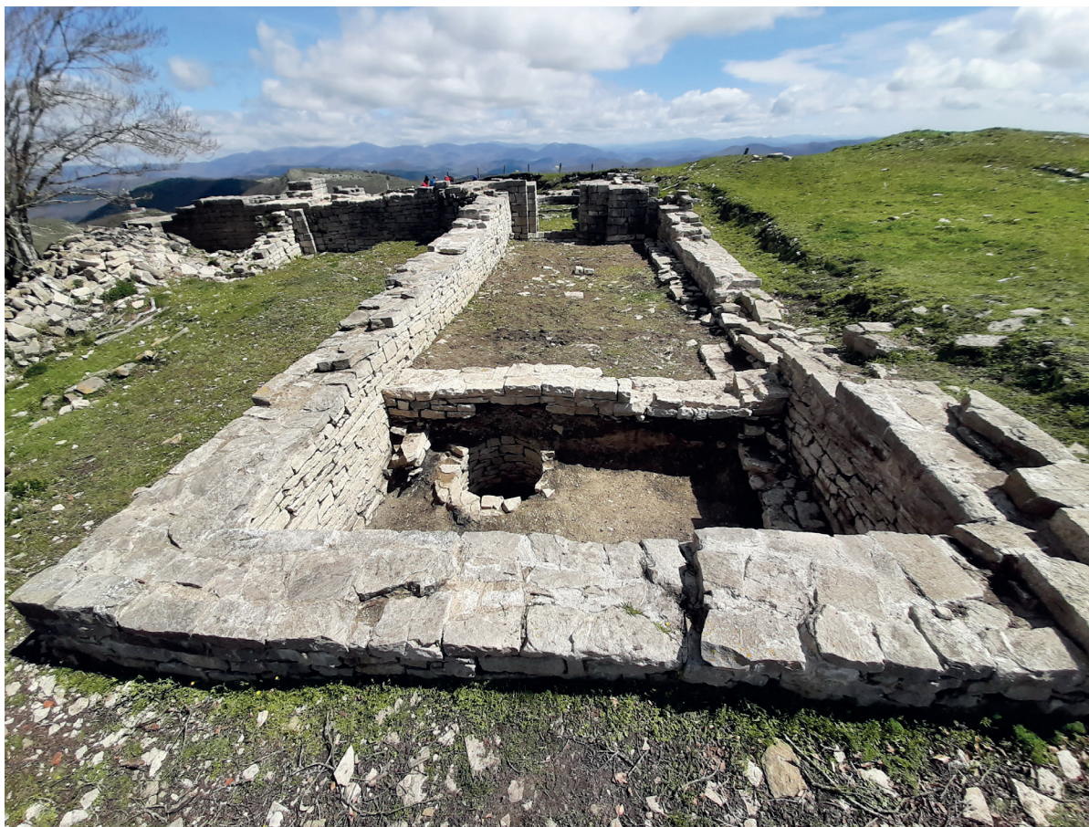
Figura 1. Vista general del zaguán del monasterio de Larunbe, en primer plano se aprecia el pozo. Autoría: J. Agirre-Mauleon. 2023.

una vez finalizada dichas fases de excavación y tras la consolidación de sus restos murarios, se procedió a la investigación arqueológica de la estructura denominada zaguán. Esta es una estructura de cronología claramente posterior, adosada a la traza monasterio románico y que responde a un concepto menos culto y de menor calidad constructiva. Además, era un elemento cuyos muros afloraban en la superficie notoria y necesario para entender la evolución constructiva del conjunto religioso.