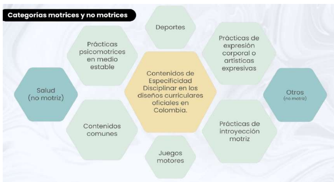
Figura #3. Categorías motrices y no motrices en los currículos de EFRD, Colombia