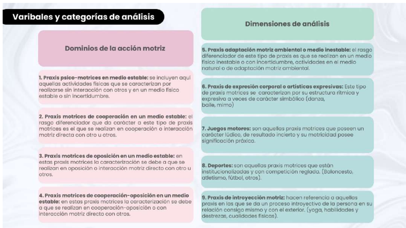
Figura # 1. Variables y Categorías de análisis

Conforme a dichos criterios, y de manera general y común para el análisis de todos los casos, las categorías resultantes acorde con las dos variables identificadas, agruparon los contenidos en una distribución de nueve (9) bloques que se corresponden con el mismo número de categorías numerados del 01 al 09, elemento que para una mejor visibilización y comprensión se recogen en la Figura # 1. Es de resaltar que se ha buscado construir unas categorías que sean exclusivas y mutuamente excluyentes; esto nos lleva a que situemos en el mismo grupo a todas aquellas praxis que las publicaciones oficiales dan denominaciones que podemos considerar como comunes o afines: las referidas a (las cualidades físicas, la percepción motriz, sensaciones kinestésicas, las habilidades y destrezas...) con la denominación de praxis de introyección motriz o moimotrices.; a las praxis motrices de adaptación motriz ambiental o en la naturaleza juntas; cosa que también haremos con las de expresión corporal o artísticas expresivas.