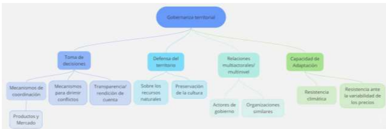
Gráfico 1. Categorías para el análisis de la gobernanza territorial.

las que se construyen los análisis y suplen la carencia de información oficial (tanto estadística como cartográfica) en producción cafetalera que permita profundizar en las dinámicas de los principales actores involucrados. De igual forma se complementó con la observación participante y el análisis documental, tomando en consideración estudios previos realizados en el territorio, principalmente el Programa de Ordenamiento Ecológico Territorial del Municipio de Cuetzalan de 2010, el cual se está actualizando en el momento actual. Para la organización de los resultados se emplearon las categorías analíticas de la gobernanza territorial del gráfico 1, con énfasis en los esquemas de articulación y arreglos entre productores.