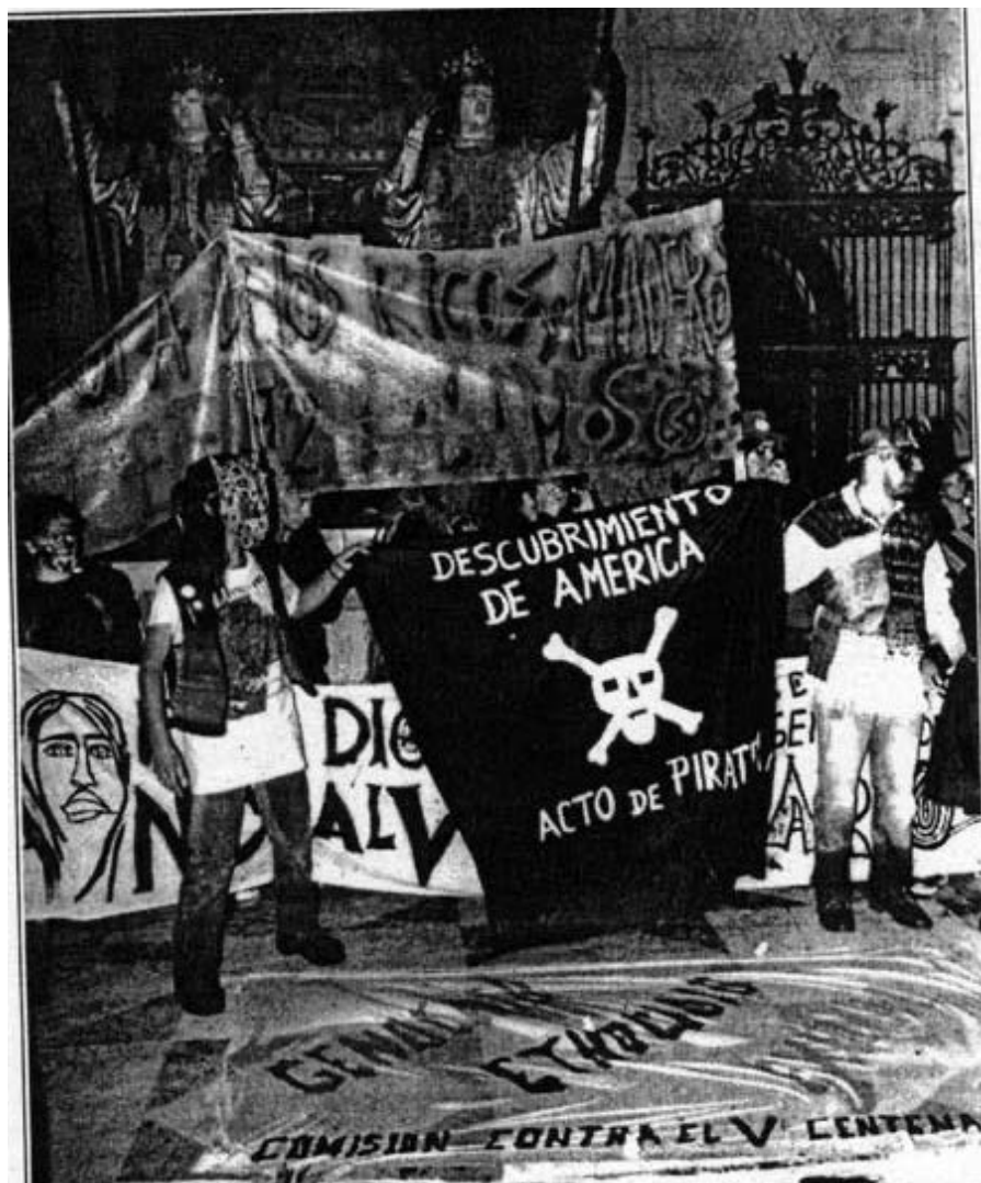
Protestas en la catedral de Sevilla.

de diversas asociaciones, entidades y movimientos políticos impiden hablar de ellos en singular 8 , pero pese a los diferentes objetivos o estrategias comparten