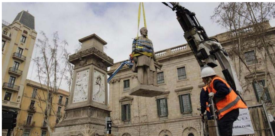
Retirada del monumento de Antonio López.

y momentos históricos ligados a las diferentes resistencias que se dieron contra la esclavitud, el colonialismo y el racismo».