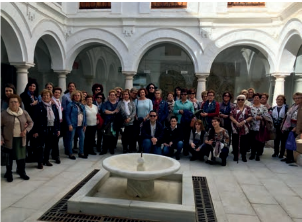
Visita de la Asociación de Mujeres "La Mesa" de Fuente-Tójar. 19 de noviembre de 2017