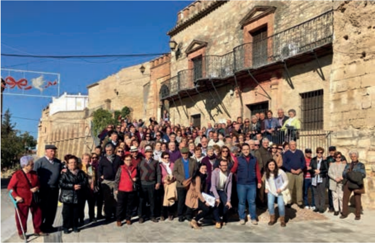
Visitantes de Fuente Obejuna. 16 de noviembre de 2017