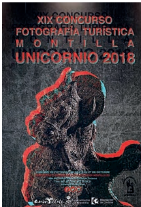
Cartel del XIX Concurso de Fotografía Turística de Montilla Unicornio

3. A finales del mismo mes de mayo, la asociación Agrópolis participó en el III Encuentro de Asociaciones Defensa del Patrimonio, celebrado en Carmona.