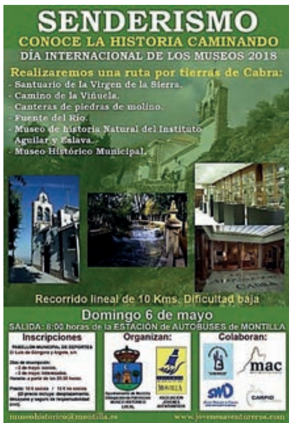
Cartel de Conoce la Historia Caminando