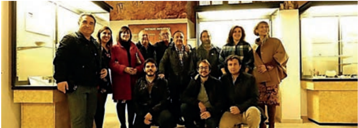
Colaboradores y miembros de la gestión interna que han hecho posible la apertura del Museo Histórico Local de Montilla