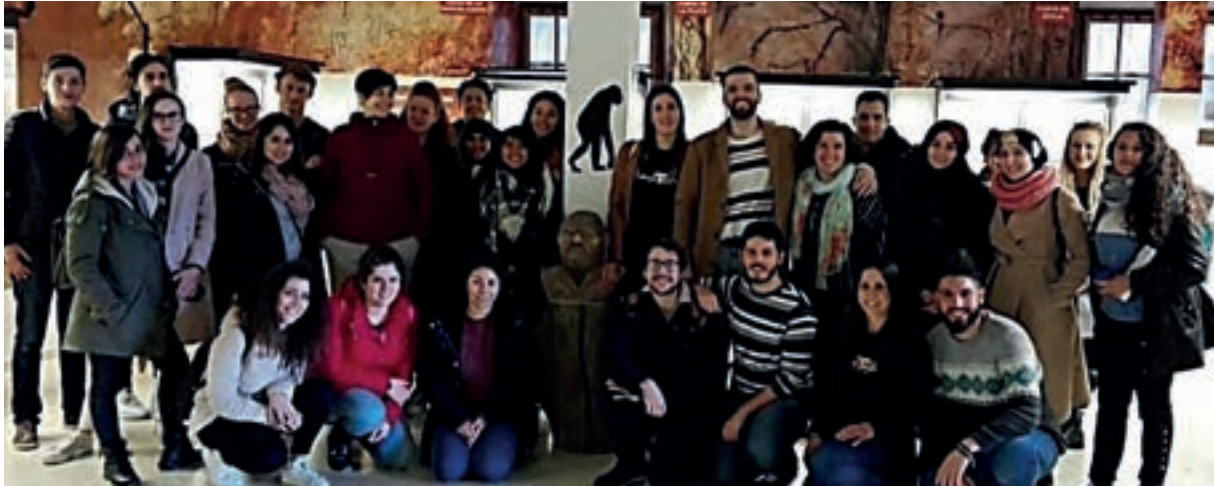
Cartel y participantes de Cátedra de Córdoba.