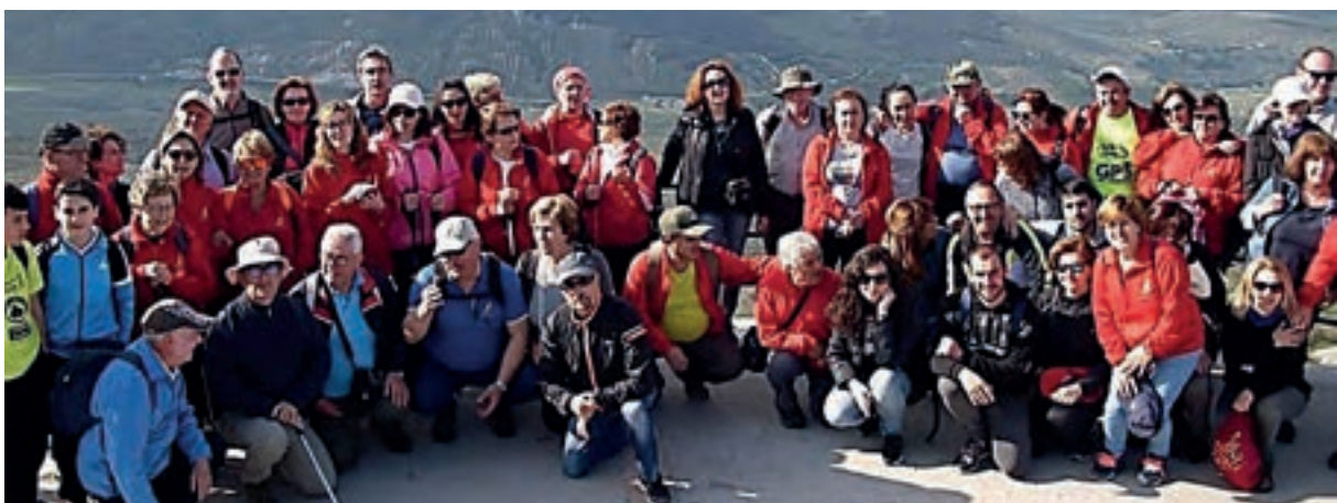
Participantes Conoce la Historia en Cabra

2. En el mes de mayo para la celebración del día Internacional de los Museos, se realiza desde hace unos años la ruta de senderismo “Conoce la Historia caminando”, para conocer en nuestro entorno enclaves arqueológicos y patrimoniales. En esta edición se realizó la ruta por tierras de Cabra, visitando el Santuario de la Virgen de la Sierra, el camino de la Viñuela, canteras de piedras de molino, la fuente del Río, el museo de historia natural del Instituto Aguilar y Eslava y el Museo Histórico Municipal.