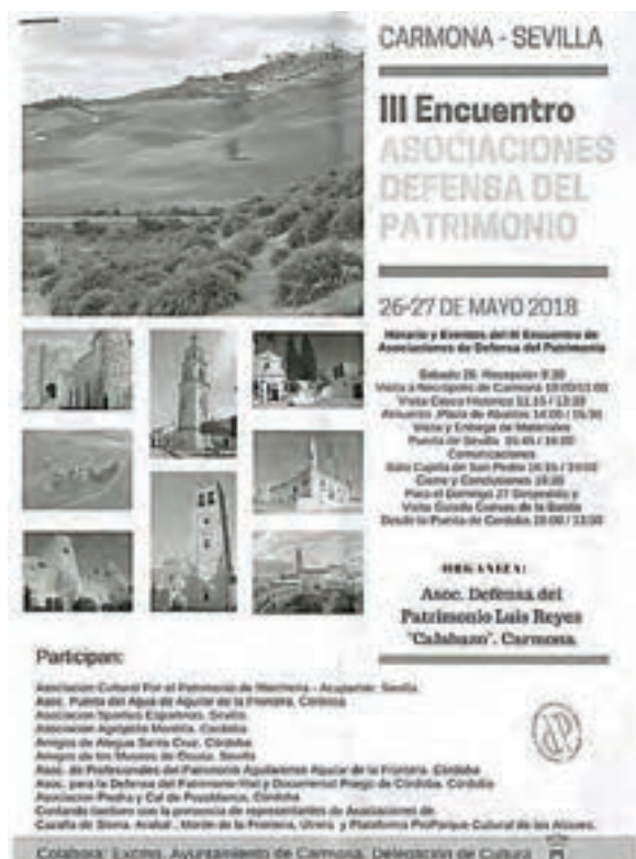
Cartel del III Encuentro Asociaciones Defensa del Patrimonio