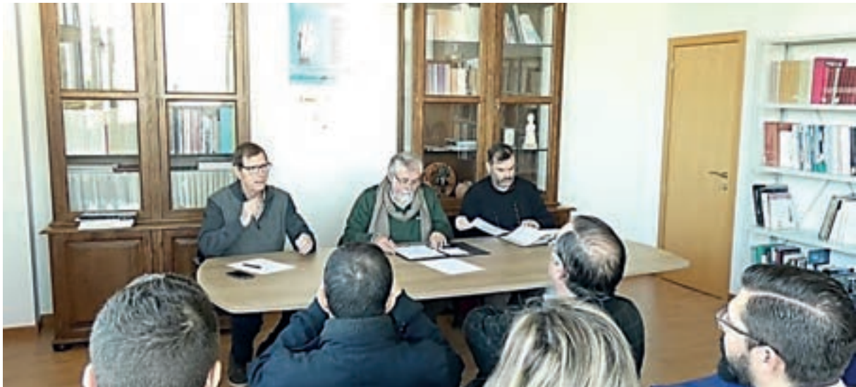
Asamblea de la Asociación Provincial de Museos Locales de Córdoba, en Santaella

sencia activa en las reuniones ordinarias, así como en los Encuentros de Museos Locales de la provincia de Córdoba.