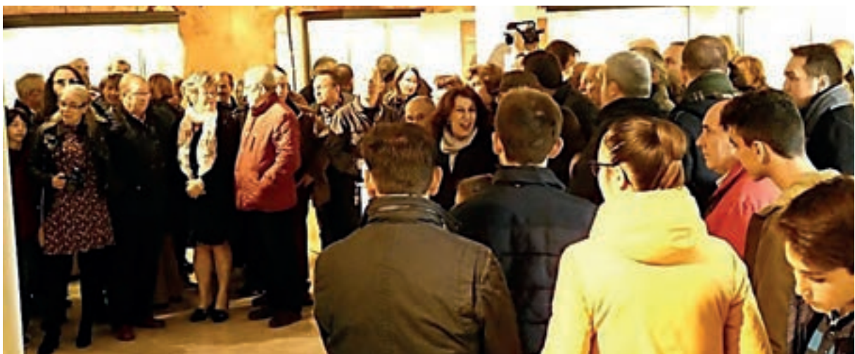
Asistentes en la inauguración de la nueva sede del Museo Histórico Local de Montilla