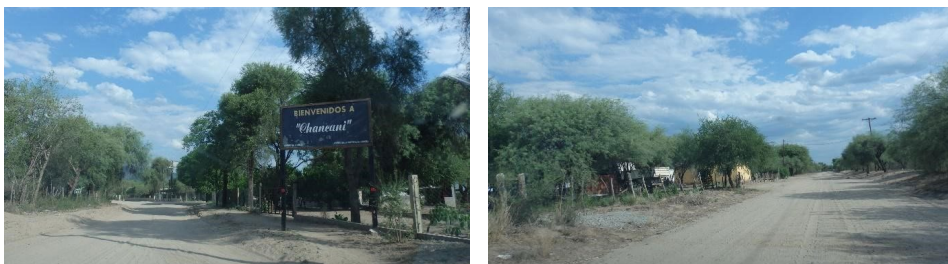
Figura 2. Trama urbana de la comuna de Chancaní

Considerando este panorama es menester señalar, según la entrevista al jefe comunal de Chancaní (2019), que la comuna está sumergida en un proceso migratorio interno dado principalmente por parejas y madres solteras entre los 20 a 35 años que proceden de los parajes (El Quemado y Los Dos Pozos) y se trasladan a Chancaní para acceder a un pequeño terreno con acceso a servicios como agua, electricidad y sistemas de salud y educación (figura 2).