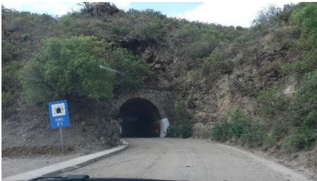
Figura 4. Túneles de Taninga