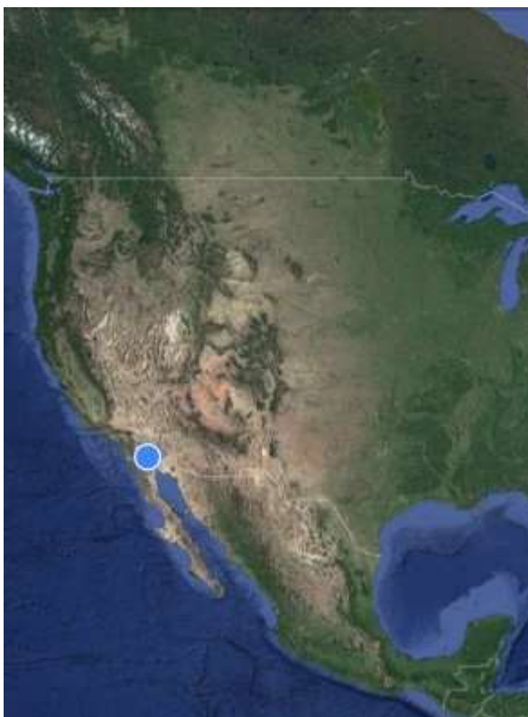
FIGURA 1 LOCALIZACIÓN ZONA OESTE FRONTERA MÉXICO-ESTADOS UNIDOS