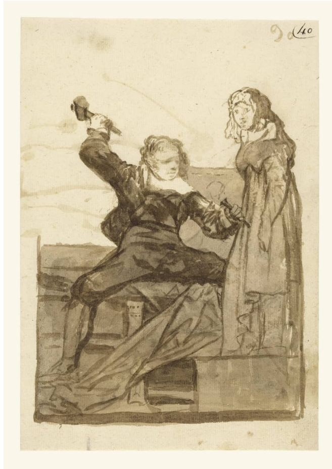
Francisco de Goya, Pigmalió i Galatea , ca. 1812 – 1820

Si tornem al mite representat a la pintura, trobarem una sèrie d'imatges semblants a les que ens mostra el quadre de Gérôme, on Galatea, bella i sensual, respon a les carícies del seu creador. Es tracta d'una interpretació interessada que no apareix en el text, però que plau als senyors pintors i contempladors de l'obra.