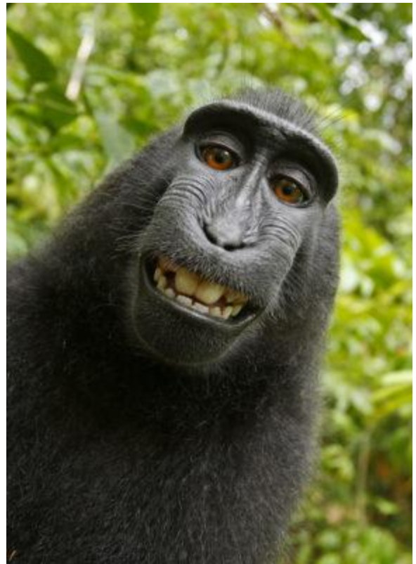
Retrat d'una femella Macaca nigra a Indonesia, que va activar la càmera del fotògraf David Slater.

He llegit i acceptat les condicions establertes en l' avís legal i política de privacitat .