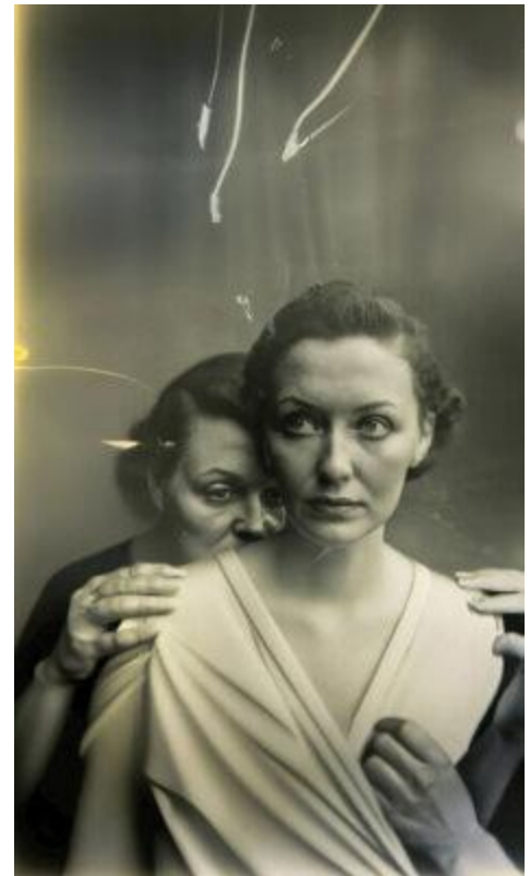
'Pseudomnesia' de Boris Eldagsen. La imatge premiada en el Sony World Award.

L'artista va manifestar que la seva intenció era denunciar que aquells premis, que es troben entre els més coneguts i prestigiosos del sector, no disposaven de normes clares en relació amb el processament de les imatges.