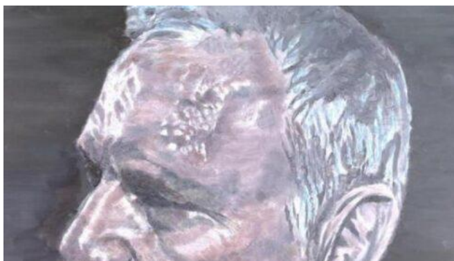
L'oli 'A Belgian politician', de Luc Tuymans, és, gegons el tribunal, un plagi

Aquesta polèmica va posar damunt la taula, una vegada més, tant la vigència dels drets d'autor en un món digital com la pregunta de com caldria regular-los jurídicament en el nou entorn protagonitzat per la IA. A més, ens situa davant de diversos interrogants de més abast sorgits des del primer moment d'aparició dels sistemes de reproducció mecànica de les imatges i que segueixen vigents a dia d'avui. Diversos teòrics i pensadors, com Walter Benjamin ( L'obra d'art a l'era de la reproductibilitat tècnica , 1966), Jean Baudrillard ( Cultura i simulacre , 1978) o Gilles Lipovetsky i Jean Serroy ( La pantalla global , 2007, i L'estetització del món , 2015), han reflexionat sobre quina és la naturalesa de la imatge i el seu valor en un context caracteritzat per la seva proliferació en el medi social, en el qual quasi no podem distingir —o ha esdevingut irrellevant— si ens trobem davant d'un original, d'una còpia o, tal vegada, d'un simulacre.