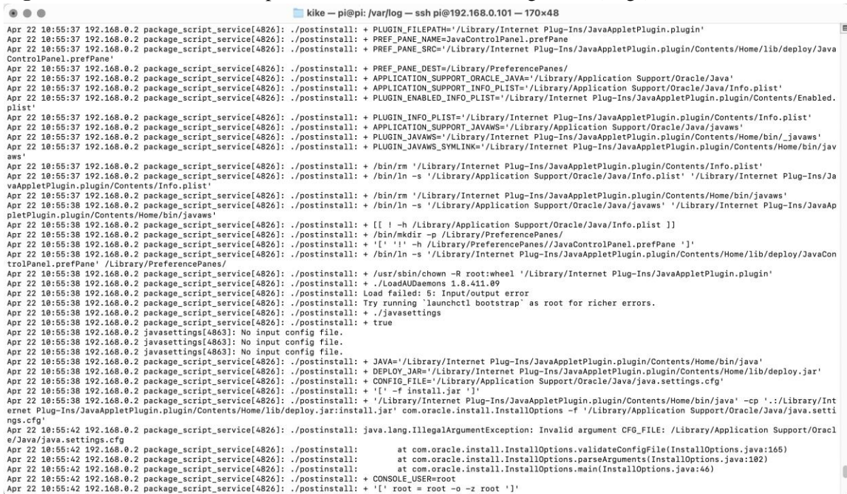
Figura 3 Eventos recolectados para detección de eventos de seguridad (Logs).