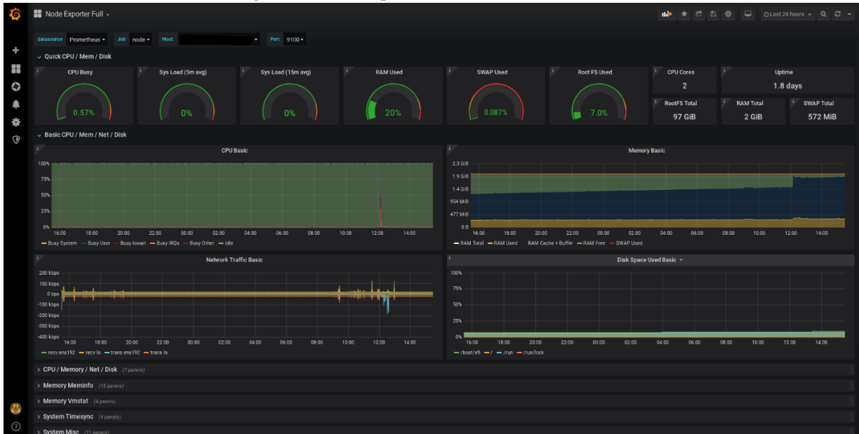
Figura 2: Dashboard de datos gráficamente representados

Node Exporter Full | Grafana Labs, s. f.