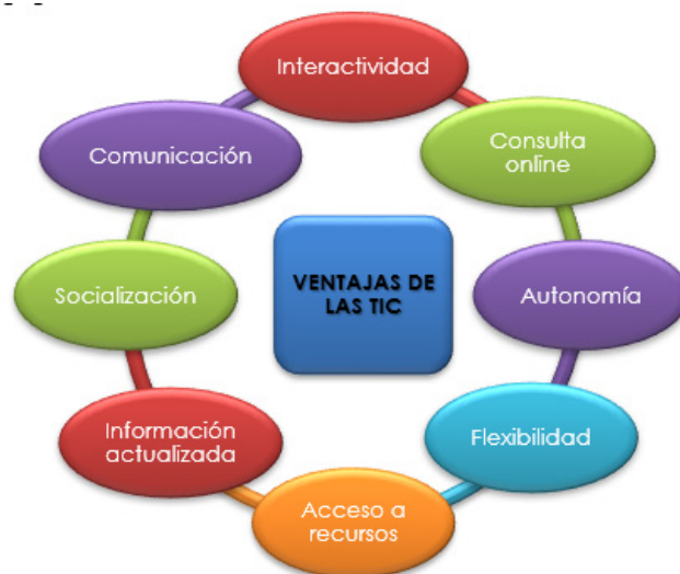
Figura 2. Ventajas de las TIC.