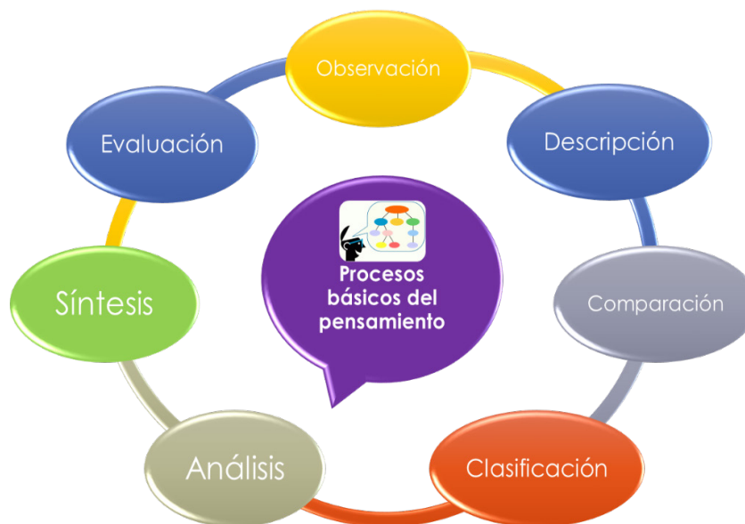
Figura 3. Habilidades básicas del pensamiento.