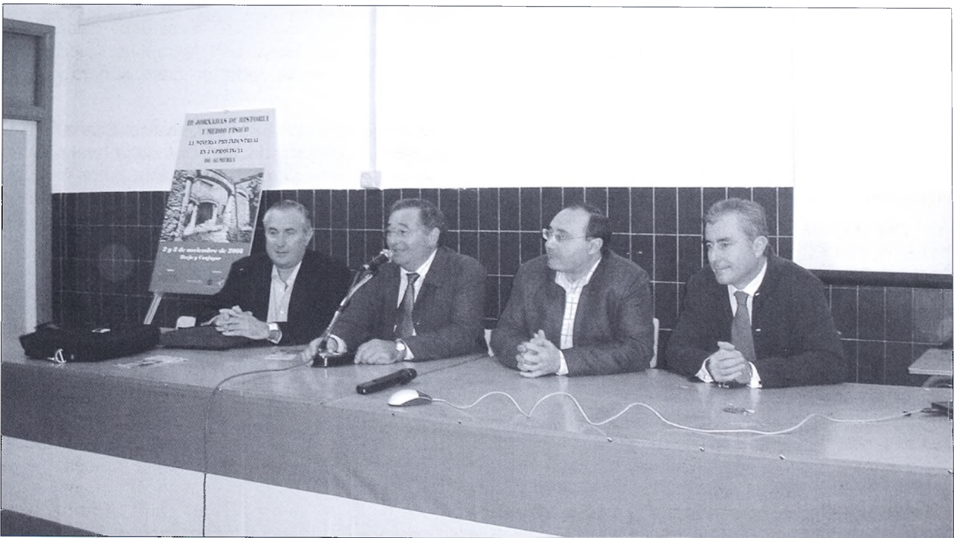
Jornada sobre la minería preindustrial en la provincia de Almería