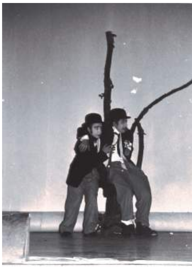
Grupo de teatro Valle Inclán; representación de la obra "Esperando a Godot".

Al finalizar la primera temporada (65-66), se produce una escisión en el grupo, incluido el director, que hace peligrar su continuidad. Sin embargo, al comienzo del siguiente curso (66-67) la incorporación de nuevos componentes facilita su continuidad, de esta forma se pone en escena Llanto por la muerte de Ignacio Sánchez Mejías de Federico García Lorca y A las seis en la esquina del boulevard , de Enrique Jardiel Poncela. Para primeros de año (1967) se empieza a ensayar El viajero sin equipaje de Arthur Miller, a pesar de ello no hay referencias de su puesta en escena siendo estas las últimas noticias que se tienen de este grupo.