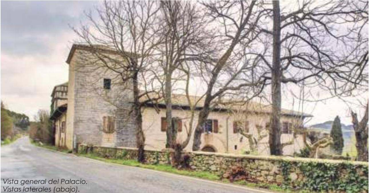
Vista general del Palacio. Vistas laterales (abajo).

Francisco Javier GALÁN SORALUCE galansoraluce@telefonica.net