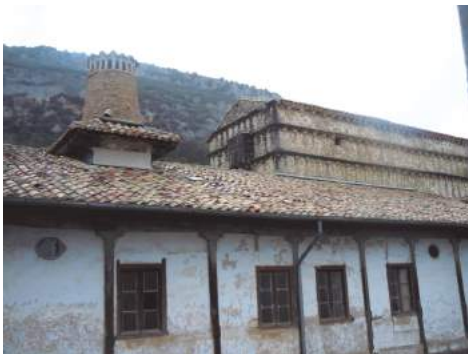
Vista del patio con la gran chimenea.

El palacio, con una maravillosa tipología medieval de alas horizontales, con construcción en sillarejo (piedras irregulares y labradas toscamente) y torreones cuadrados en las esquinas, rematado en palomar. Además, tiene la puerta ligeramente apuntada. Todo él data del siglo XVI, como la pequeña iglesia adjunta y, a pesar de los años, conserva toda su majestuosidad. Al entrar al edificio principal descubrimos su patio, alrededor del cual se desarrollan todas las estancias en dos plantas. Destaca un cuerpo más alto en la parte noroeste del mismo, y la fachada sur, con una gran galería que se abre sobre el jardín y el paisaje. En sus muros se abren algunos vanos, entre los que destaca la ventana geminada de una de las torres. Destacan las dos torres de planta rectangular. En la parte superior de la fachada de una de las torres se ven dos cornisas que rodean el edificio y bajo las que se ven pequeñas ménsulas. Se adosa a la fachada un bello escudo rococó de la segunda mitad del siglo XVIII.