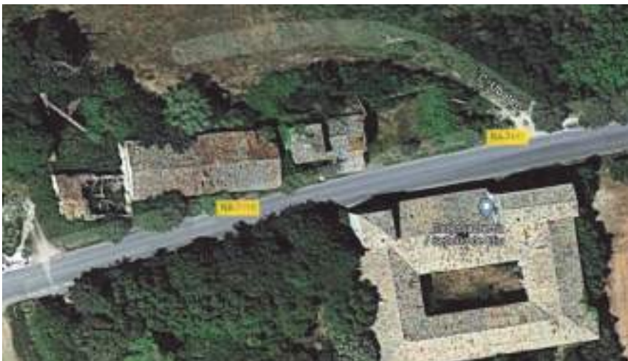
Vista aérea del conjunto.