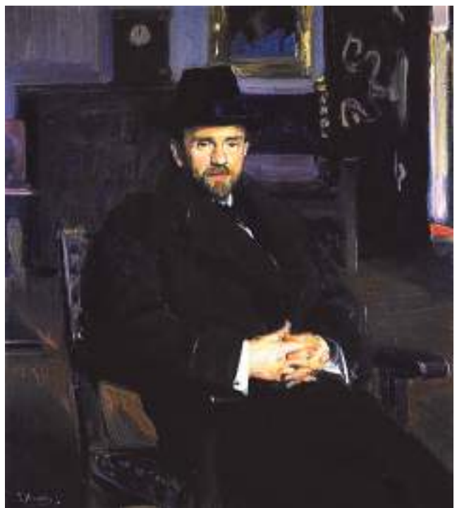
Retrato de Don Pío Baroja. Pintor: Joaquín Sorolla (1914).