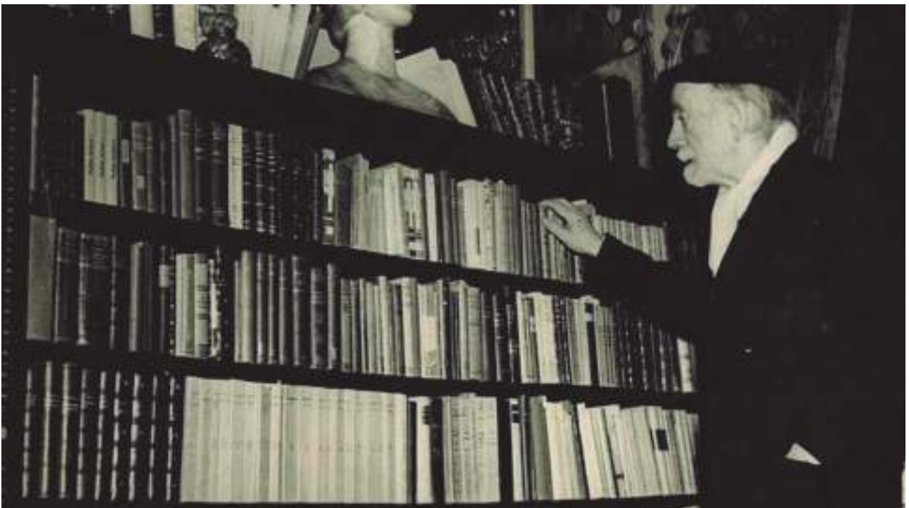
Pío Baroja en su biblioteca de Itzea.

Asociando a todo esto lo que es incluso más importante y vital en un escritor, la existencia de lectores ávidos, junto a las reediciones continuadas de sus libros y los estudios de todo tipo sobre su literatura y su persona. Baroja cada año que pasa ga-