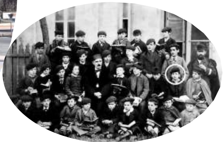
Curso 1881-2 del Colegio Huarte (Pamplona). Pío Baroja señalado por un círculo.