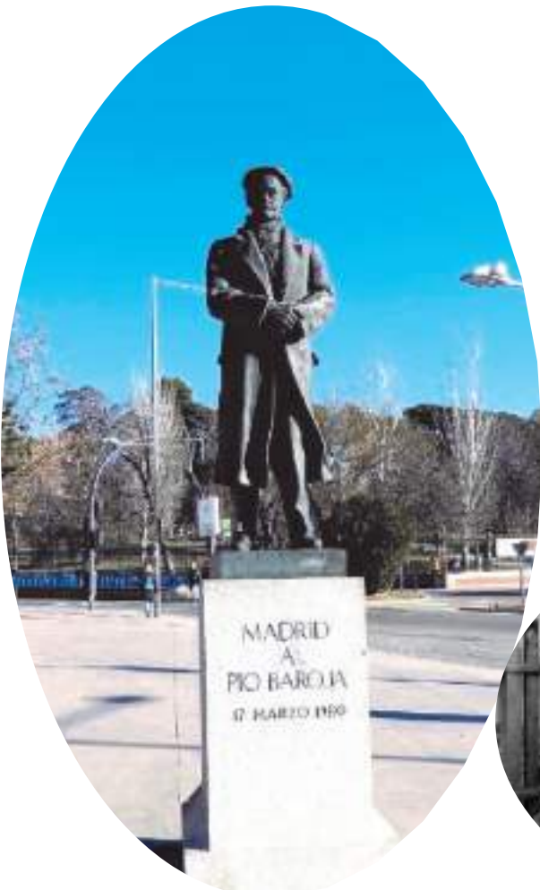
Monumento a Don Pío Baroja en Madrid. Escultor: Federico Coullaut Valera (1978).

na en frescura y en modernidad, cada día es más actual. Se presenta solitario, resplandeciendo con luz propia.