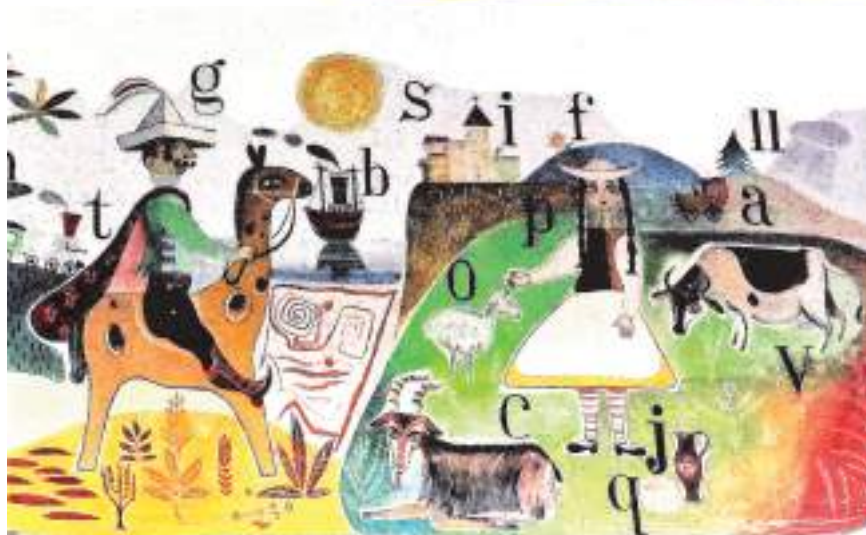
Diversos detalles de las pinturas en el aula de los Maristas.