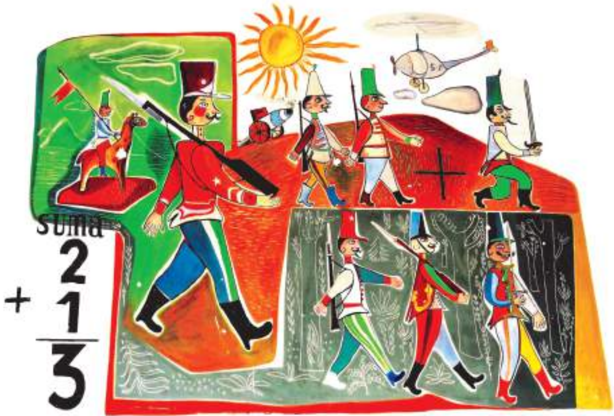
Diversos detalles de las pinturas en el aula de los Maristas.