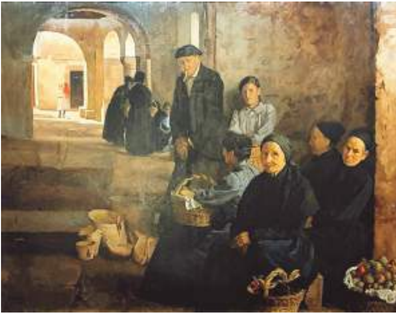
Mercado de Elizondo, por Javier Ciga (1914). Ayuntamiento Pamplona.

vincia y las limitrofes, y á que cuanto antes se consiga la unión que quiere la constitución de la Monarquía". Por ello desean los de Fitero la concesión de un mercado semanal para vender sus productos, si bien en fechas distintas a las tradicionales para evitar la competencia con mercados de pueblos contiguos no navarros, caso de Ygea, Ágreda y Cervera. Todo un mes, hasta el 5 de mayo de 1841, esperó la solicitud de Fitero a recibir el visto bueno de su Diputación.