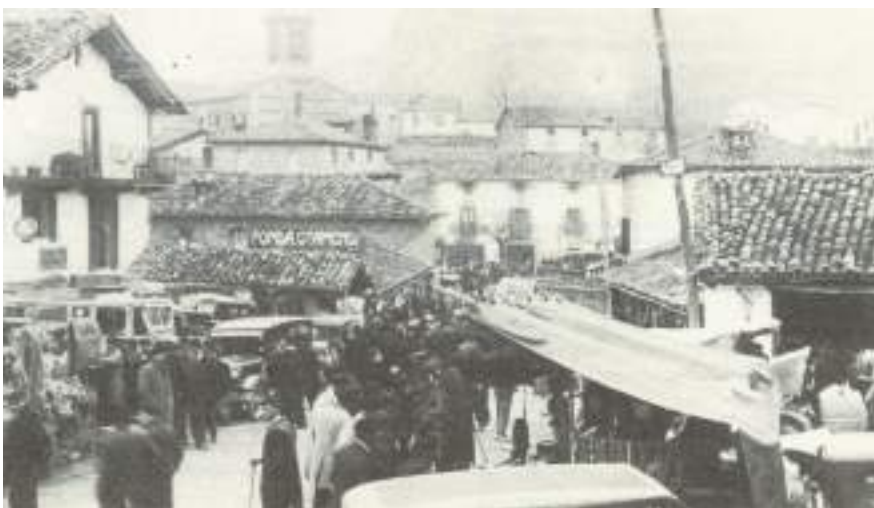
Vista antigua del mercado de Iruzun.

Para cumplir lo mandado y evitar daños en la carretera causados por el ganado de cerda y el vacuno traídos a las ferias, los vecinos de Iruzun y Echeberri que formaban un mismo concejo y que por turno presidían sus respectivos alcaldes, acuerdan por ese motivo "hacer una plaza cerrada para el ganado cerdio a la mayor brevedad de cabida de cinco robadas ó lo que juzgue suficiente dicho concejo". Primero había que comprar el terreno, en agosto de 1872 una vez recogida la cosecha, y después concluir la obra el año siguiente. Iniciativa que seguramente pospuso los combates de la tercera guerra carlista en aquel estratégico