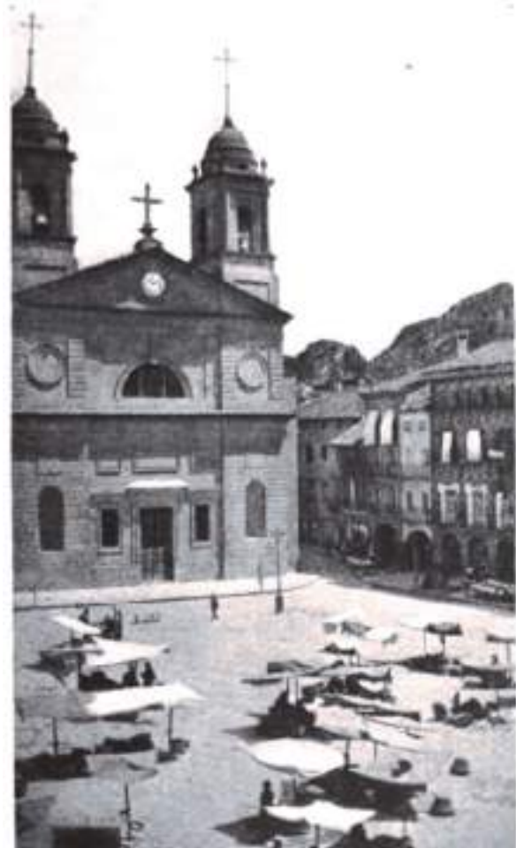
Vista del mercado de Estella. (1920)

A principios 1872, cuando todavía no había estallado la tercer guerra carlista, el celador de Obras públicas del distrito de Irurzun daba cuenta a la Diputación de Navarra de los daños que los días uno y dieciséis de cada mes sufrían las tres carreteras que allí confluían: "se llenan de ganado cerdío y vacuno que estorba el paso al transeúnte". No extraña que entre todos los ganados el buen celador tuviera al cerdío como principal destructor de las vías y el más peligroso en sus tropiezos con caballerías y vehículos. Sobre todo en los meses finales de cada año y principios del siguiente, cuando los cerdos eran mayoritarios en las ferias, pero también los que causaban mayores perjuicios en el cruce de carreteras. Por ello el celador demanda del alcalde que en el mismo ferial establezca un local cerrado apartado de las carreteras y que se arreglen estas, "porque es abundantísimo el ganado cerdío que se suele acumular". Y así lo decide la Diputación el 22 de febrero.