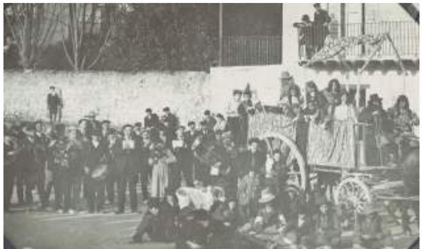
Ferias en Santesteban.

Y una curiosa reflexión sobre las aduanas: si durante siglos no hubiese sido Fitero un pueblo de señorío, de los monjes cistercienses, haría tiempo que la villa habría pedido la concesión de un mercado. Y no lo había hecho por el inconveniente desde hacía siglos de las aduanas, pero ahora podrían gozar de las ventajas de su desaparición, dadas "las rencillas que por razón de los fueros había entre esta Pro-