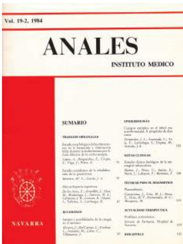
ANALES Volumen XIX-2, 1984. Ultimo numero editado del formato revista de ANALES Instituto médico correspondiente a la segunda época.