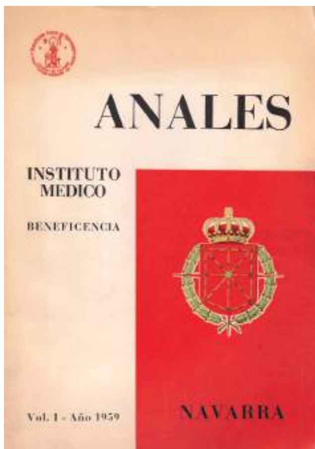
ANALES Volumen I, 1959. Primer número editado de ANALES del Instituto Médico de la Beneficencia.