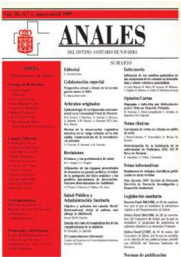
ANALES del Sistema Sanitario de Navarra. Volumen 20, 1º, 1997. Primer número de la tercera época de recuperación de la revista científica.

ción para apoyar proyectos, y creamos la Beca Ortiz de Landázuri, como investigador referente. Los centros sanitarios habían comenzado a investigar