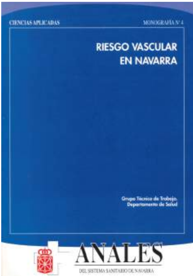
Portada de ANALES serie de Ciencias Aplicadas.

Los investigadores buscan publicar revistas con reconocido "Factor de Impacto" que expresa las veces que la revista ha sido citada en las publicaciones científicas de reconocimiento internacional. Por ello ANALES buscó desde primer momento el ser reconocida en los índices de citaciones que exige una trayectoria constante de la calidad de lo publicado. De este modo, en el año 2000 la revista fue aceptada en la base de datos Índice Médico Español; en el año 2001 en la base europea Excerpta Médica (EMBASE); en el año 2002 en la base norteamericana Index Medicus (Medline), y en el Índice Bibliográfico Español en Ciencias de la Salud (IBECS) y en SCIELO. Finalmente en el año 2007, entró en la base de datos Journal Citation Report, área de Salud Pública, que le adjudicó Factor de Impacto. Así pues, en el año 2009 ANALES del Sistema Sanitario de Navarra obtuvo un Factor de Impacto de 0,351 y en el año 2020 fue de 0,829. Todo un éxito. Sólo 13 revistas españolas están incluidas, siendo la de mayor factor de impacto. Medicina Clínica, fundada en 1943, con 1,7 en 2022.