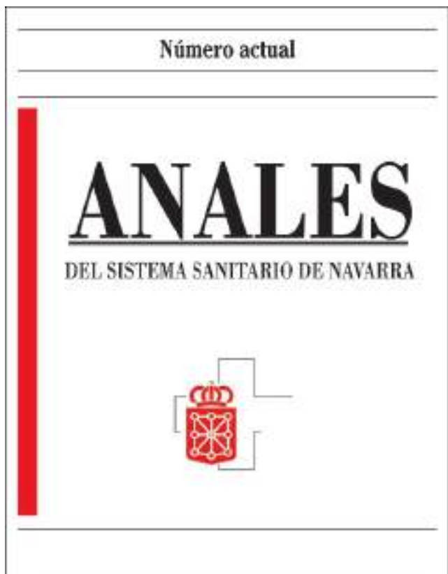
Portada actual de ANALES. (enero de 2023)

Pronto pasó la revista a poder seleccionar los trabajos y a enviarlos a evaluación a profesionales expertos, tanto internos como externos, y hacer una base de correctores por pares a los autores de los trabajos. Cada vez mayor exigencia, con éxito, ya que a la vuelta de los 25 años el índice de aceptación de los trabajos recibidos es del 20%.