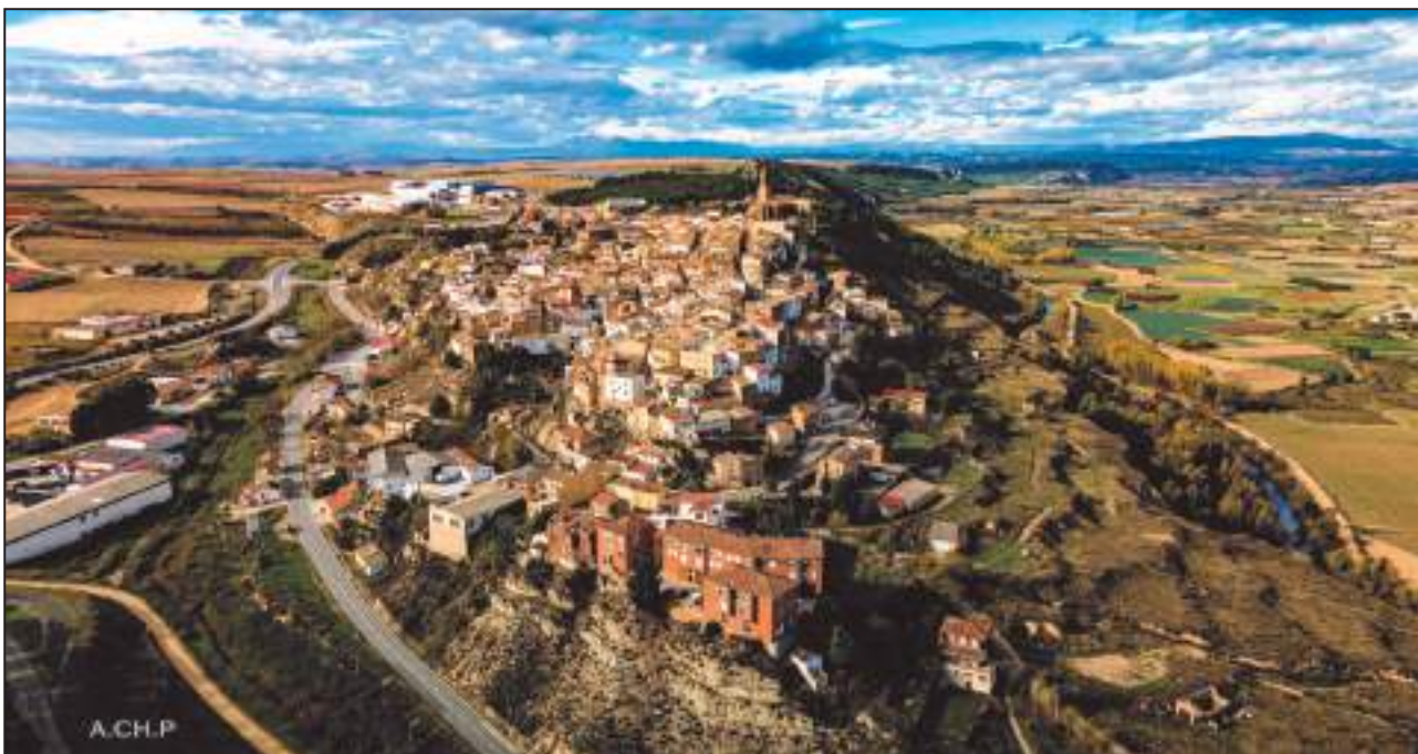
Vista aérea de la villa de Cárcar, su localidad natal.