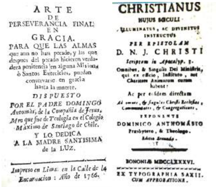
Portadas de libros del Padre Antomas.

los amables objetos que me hizo abandonar la providencia, puedo asegurar con verdad que no es V.S. quien tiene menos parte en mi corazón. Llegué a España falto de conocimientos y cuando aguardaba todas las calamidades consiguientes a los hombres que vivían en desgracia del mejor de los Monarcas, V.S. con una generosidad digna de sus virtudes, auxilió a este miserable bendiciendo su nobleza los temores de la opinión pública".