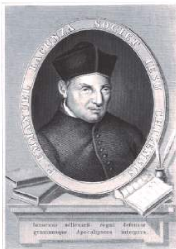
Grabado representando al Padre Manuel Lacunza.