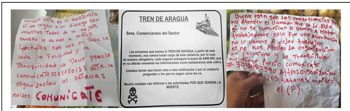
Foto 1. Imágenes de panfletos enviados por criminales a comerciantes durante 2023 – 2024.